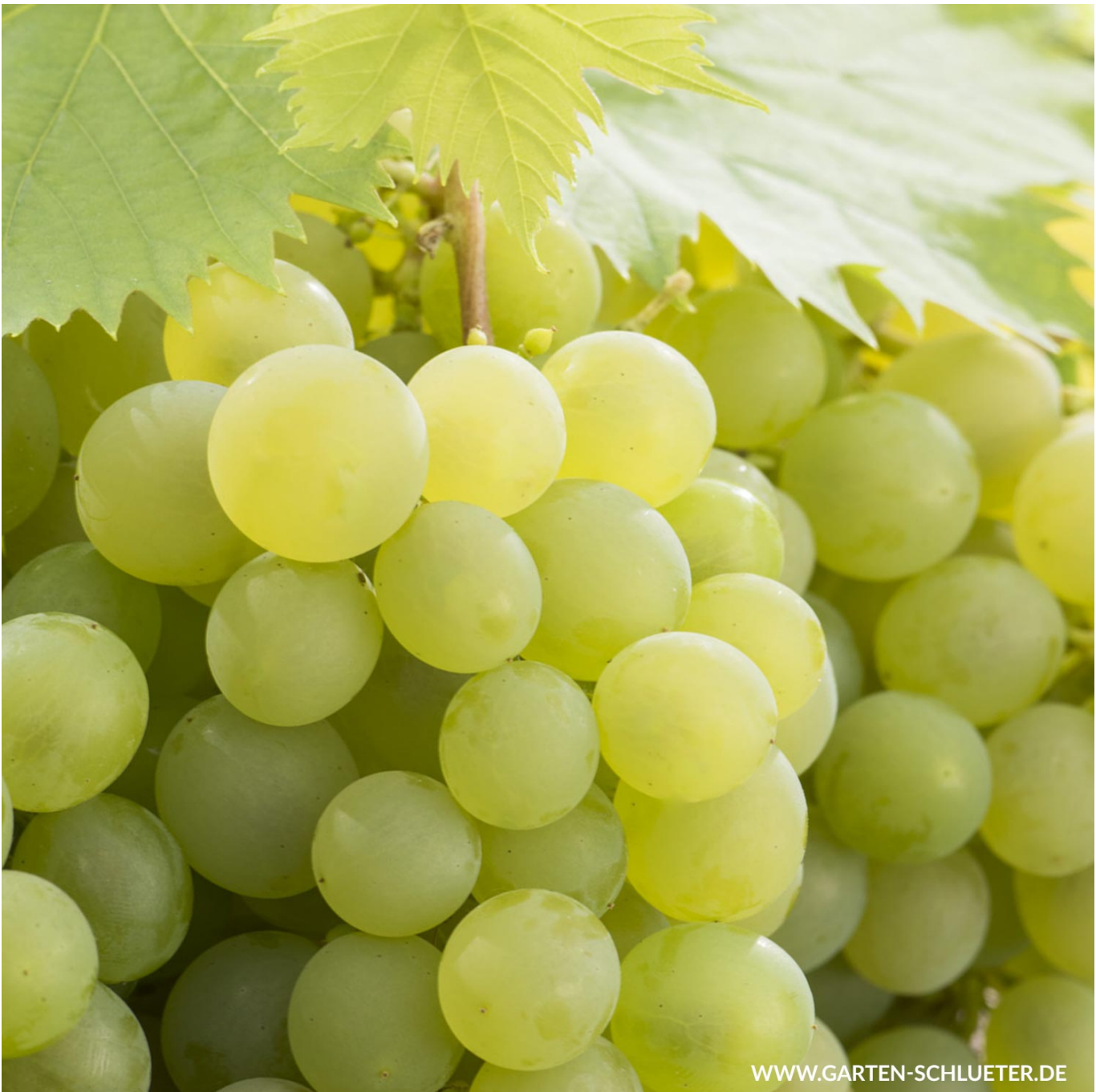
Kernarme Weintraube 'Phönix' Liefergröße: 80 - 100 cm, gestäbt - Vitis 'Phönix'