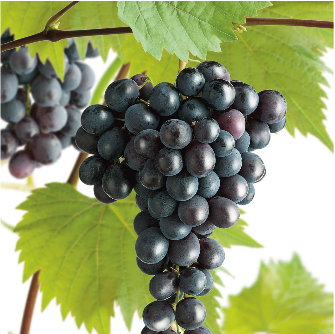
Kernarme Weintraube 'Venus' Liefergröße: 80 - 100 cm, gestäbt - Vitis

Ein Traum wird wahr: Weintrauben aus dem eigenen Garten! Leckere und gesunde Weintrauben im eigenen Garten ernten? Das ist gar nicht so schwierig, wie man es sich vielleicht vorstellt! Denn obwohl man bei Weintrauben zuerst einmal an steile Weinberge und mediterranes Klima denkt, ist es überhaupt kein Problem, einen Weinstock im eigenen Garten zu pflanzen. Mit unseren Tipps und Infos gelingt es ganz bestimmt! Roter Wein 'Venus' kommt mit jedem Gartenboden gut zurecht. Wenn Sie Ihren Weinstock einpflanzen, sollten Sie sicherstellen, dass die Veredelungsstelle nicht mit Erde bedeckt wird. Achten Sie auf einen nicht zu feuchten Standort, an dem sich keine Staunässe bildet. Weinstöcke lieben sonnige Standorte, gerne auch windgeschützt, z. B. an einer nach Süden ausgerichteten Gartenmauer oder Hauswand. So können sich die Früchte optimal entwickeln. Rechtzeitige Düngergabe im Frühjahr trägt zusätzlich zu einer guten Fruchtbildung bei. Damit Ihr roter Wein 'Venus' klettern kann, benötigt er unbedingt eine Rankhilfe. Diese können Sie im Gartenfachmarkt vor Ort erwerben oder mit etwas handwerklichem Geschick sogar selber bauen. Während längerer Trockenperioden sollte der Weinstock regelmäßig bewässert werden. Die winterharte Vitis 'Venus' kann eine Wuchshöhe von 300 - 350 cm erreichen. Durch einen Rückschnitt im Herbst können Sie Ihre Weinrebe in der gewünschten Form halten. Im Frühjahr bilden sich an Ihrem roten Wein 'Venus' unauffällige, grüngelbe Blüten. Während der