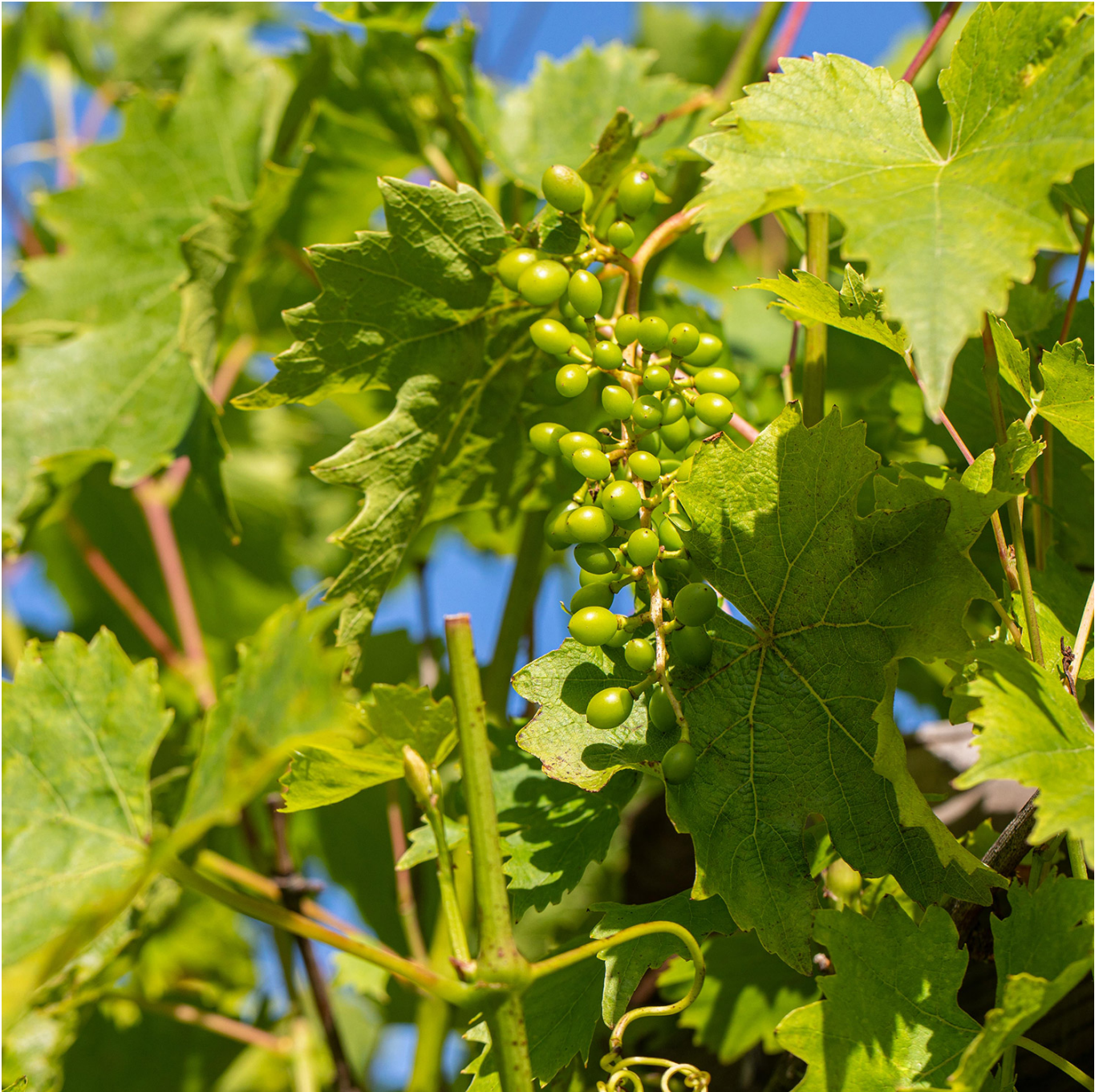
Kernarme Weintraube 'Romulus' Liefergröße: 80 - 100 cm, gestäbt - Vitis 'Romulus'

Weintraube 'Romulus': Robuste Süße für Ihren Garten Weintraube 'Romulus': Ein süßer Traum für Gartenfreunde Die Weintraube 'Romulus' ist eine besonders robuste und ertragreiche Sorte, die Gartenliebhaber mit großen, süßen und saftigen Trauben belohnt. Diese Sorte ist bekannt für ihre Widerstandsfähigkeit gegenüber Krankheiten und ihre Anpassungsfähigkeit an unterschiedliche Klimabedingungen, was sie zu einer idealen Wahl für den Anbau in heimischen Gärten macht.