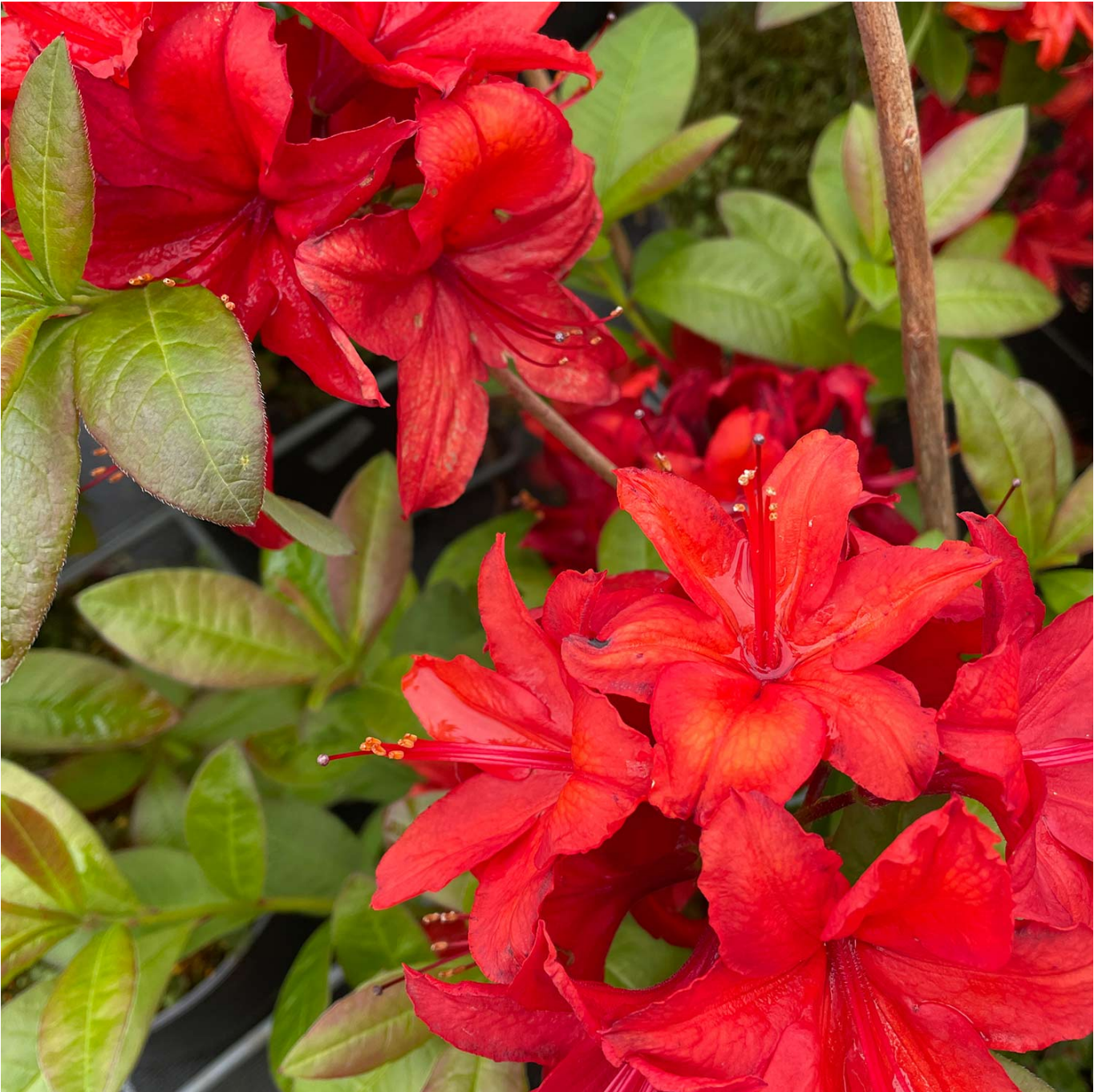
Duftazalee 'Gibraltar', 5 - 7,5 Liter, 60 - 70 cm Liefergröße: 60 - 70 cm - Rhododendron luteum 'Gibraltar'

Ein Fest für die Sinne: Duftazalee 'Gibraltar' Entdecken Sie die Duftazalee 'Gibraltar', eine außergewöhnliche Bereicherung für jeden Garten, die nicht nur durch ihre leuchtend orangefarbenen Blüten besticht, sondern auch durch ihren betörenden Duft. Die 'Gibraltar' ist bekannt für ihre große Blütenpracht und ist eine wahre Freude für jeden Gartenenthusiasten. Jede Blüte ist ein kleines Meisterwerk, das in der Frühlings- und Frühsommersonne erstrahlt und jeden Betrachter in ihren Bann zieht. Die beeindruckende Blüte der Duftazalee 'Gibraltar' Die 'Gibraltar' gehört zur Familie der Rhododendron und ist berühmt für ihre üppigen, orangefarbenen Blüten, die jeden Garten in ein leuchtendes Farbenmeer verwandeln. Die Blüten sind groß und trichterförmig, was ihnen ein besonders ansprechendes Aussehen verleiht. Der intensive Duft der Blüten macht die 'Gibraltar' zu einem Highlight in jedem Garten und verleiht eine einzigartige Atmosphäre. Pflege und Standort der Duftazalee 'Gibraltar' Die Pflege der Duftazalee 'Gibraltar' ist unkompliziert, was sie zu einer ausgezeichneten Wahl für Gartenanfänger und Experten gleichermaßen macht. Sie bevorzugt einen halbschattigen Standort und einen sauren, gut durchlässigen Boden. Ihre Robustheit gegenüber verschiedenen Wetterbedingungen