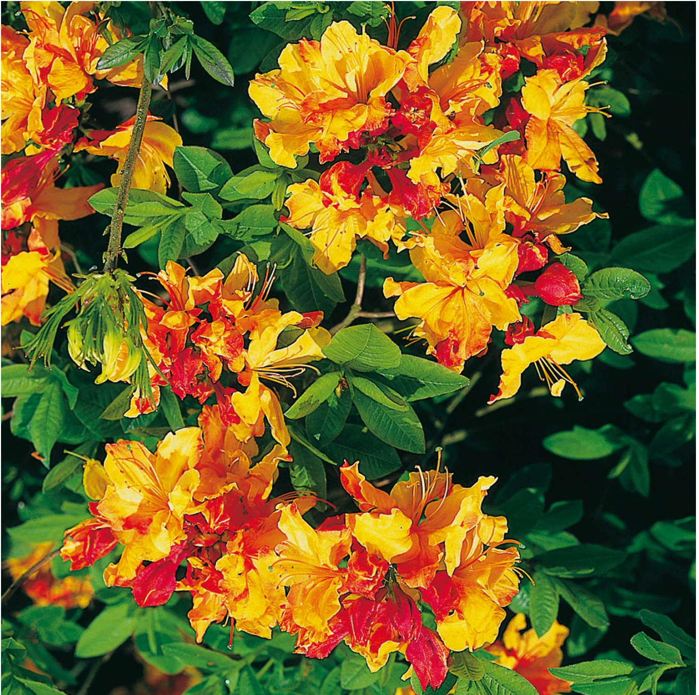
Duftazalee 'Sunte Nectarine, 5 Liter, 30 - 40 cm Liefergröße: 30 - 40 cm - Rhododendron luteum 'Sunte Nectarine'

Laubabwerfende Azalee 'Sunte Nectarine' - Ein leuchtendes Blütenwunder Die Laubabwerfende Azalee 'Sunte Nectarine' verzaubert von Ende Mai bis Mitte Juni mit einem intensiven Farbspiel aus Goldgelb und Orangerot, das die Blicke in jedem Garten auf sich zieht. Eine Meisterin der Farben Die großen, weit geöffneten Blüten der 'Sunte Nectarine' beeindrucken durch ihre brillante Farbe und den detailreichen, rot geflammten Außenseiten der Blütenkelche. Ihre üppigen Dolden bedecken den ganzen Strauch und schaffen eine überwältigende visuelle Präsenz. Kultivierung und Pflege Als aufrecht und breit wachsende Pflanze erreicht 'Sunte Nectarine' Höhen von 120 bis 160 cm und breitet sich 100 bis 140 cm aus. Sie bevorzugt sonnige bis halbschattige Standorte mit frischem, humosem und gut durchlässigem Boden. Dieser zauberhafte Strauch ist nicht nur ein Highlight für das Auge, sondern auch äußerst pflegeleicht und robust gegen kalte Winter. Gartenplanung und -design Die 'Sunte Nectarine' eignet sich hervorragend als Solitärpflanze, für Gruppenpflanzungen oder als farbenfroher Akzent in asiatisch inspirierten Gärten. Ihre herbstliche Laubfärbung in strahlendem Orange verlängert ihre Jahreszeit der Attraktivität weit über