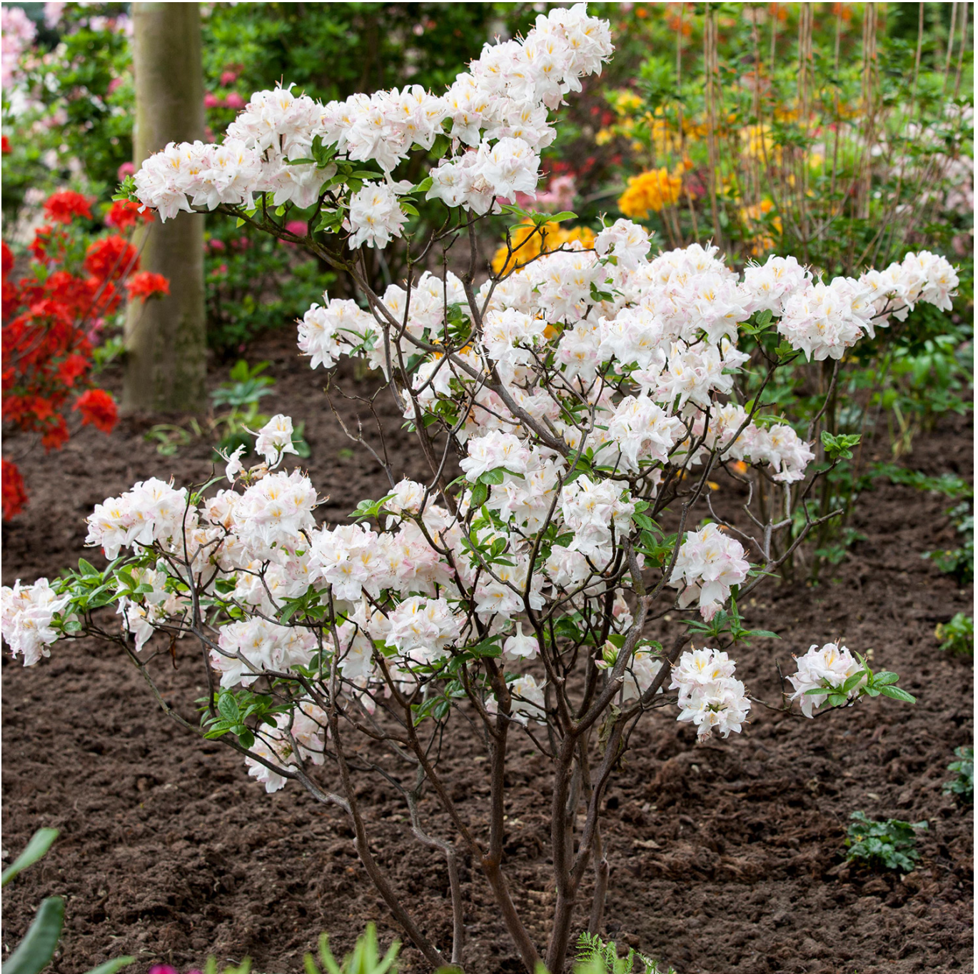
Duft-Azalee 'Satomi', 5 Liter, 30 - 40 cm Liefergröße: 30 - 40 cm - Rhododendron luteum 'Satomi'

Laubabwerfende Azalee 'Satomi' - Eleganz in Rosa Die laubabwerfende Azalee 'Satomi' besticht durch ihre auffallend großen und weit geöffneten Blüten, die von Mitte bis Ende Mai den Frühling begrüßen. Zarte Schönheit mit markanten Details Die Blüten der 'Satomi' strahlen in einem sanften Weißrosa, umrandet von einer intensiveren rosigen Flammung, während im Zentrum ein lebhaftes, goldenes Auge fasziniert. Mit einem Blütendurchmesser von 7,5 bis 8,5 cm ziehen sie alle Blicke auf sich. Robuster Wuchs und leichte Pflege Der Strauch wächst locker und aufrecht und erreicht nach 10 Jahren eine Höhe von etwa 120 cm und eine Breite von 140 cm. Dank seiner hervorragenden Winterhärte von über -24^{\circ}\text{C} eignet sich 'Satomi' ausgezeichnet für kältere Klimazonen und bereichert jeden Garten durch ihre robuste und pflegeleichte Natur. Vielseitig einsetzbar Diese Azalee verschönert als Solitärpflanze oder in einer Gruppe arrangiert Heidegärten, gemischte Grenzen oder wird als auffällige Zierpflanze in großzügigen Landschaftsprojekten eingesetzt. Ihr mittelstarker Wuchs und die üppige Blüte machen sie zu einem wahren Juwel in jedem Garten.