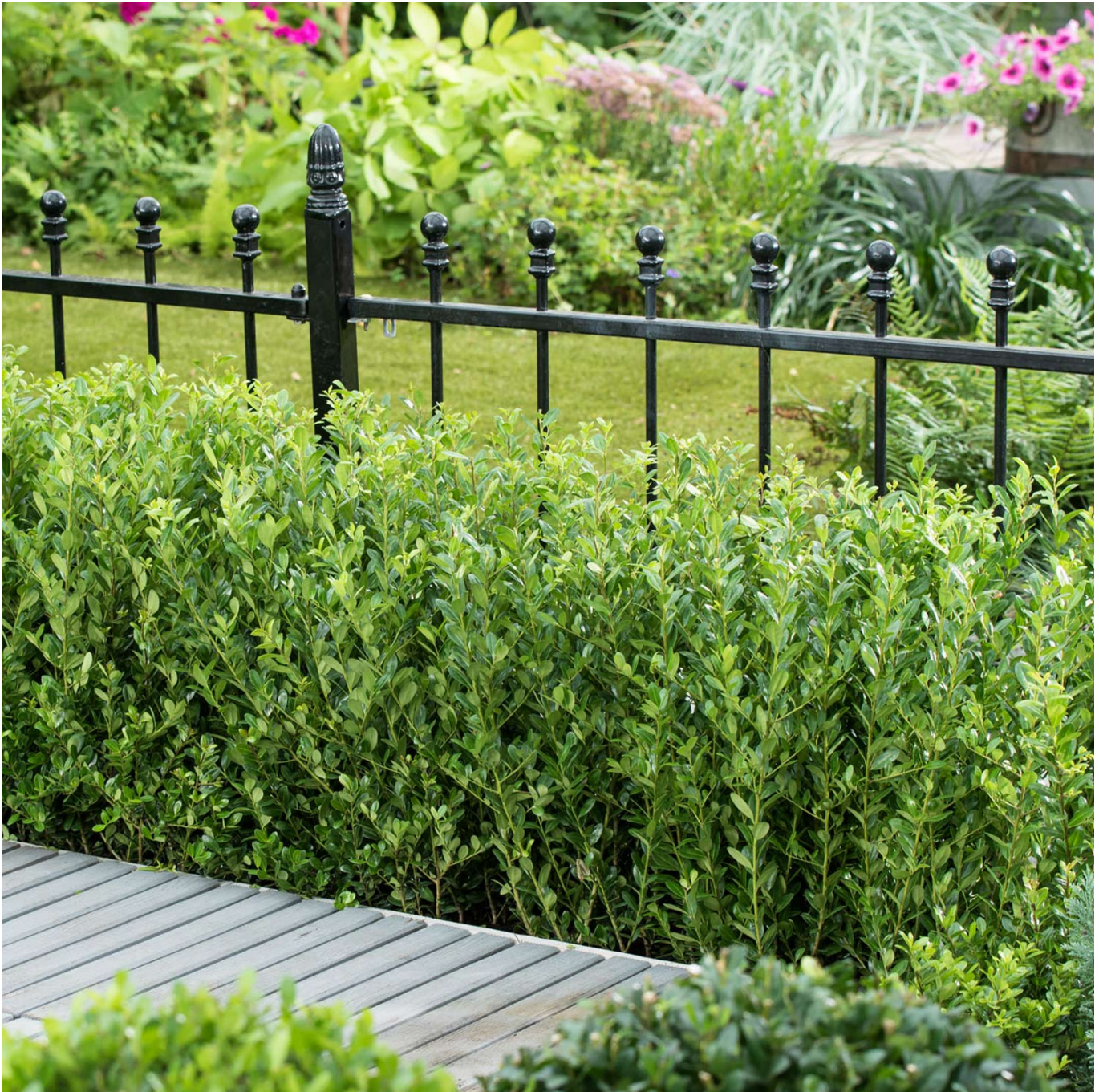
Berg-Ilex 'Glorie Dwarf' (S) C10, 80 - 100 cm Liefergröße: 80 - 100 cm - Ilex crenata 'Glorie Dwarf' (S)

Beste Voraussetzungen für lange Freude! Eine verlässliche, robuste, immergrüne Formhecke zu erhalten, ist gar nicht so einfach. Wir können Ihnen zwar die Arbeit nicht abnehmen, aber dafür das beste Ausgangsmaterial bieten! Berg-Ilex 'Glorie Dwarf' (S) erfüllt all diese Bedingungen und eignet sich ideal als Buchsersatz. Die deutsche Neuzüchtung gehört zur Gattung der Japan-Hülse. "Dwarf" bedeutet übrigens "Zwerg" - und dieser Sortennamen ist absolut berechtigt. Nicht nur, dass der Wuchs mit einer maximalen Höhe von etwa 60 cm niedrig bleibt. Auch das Laub von Berg-Ilex 'Glorie Dwarf' (S) scheint einer Miniaturwelt entsprungen. Fest, dunkelgrün glänzend und rundlich schmückt es die zahlreichen Verzweigungen. Schnittmaßnahmen steckt 'Glorie Dwarf' (S) problemlos weg! Die Blätter stehen so dicht, dass Schnitte im Holz bereits nach kurzer Zeit kaum mehr zu sehen sind. Dazu kommt eine ausgesprochene Anspruchslosigkeit und der geringe Pflegeaufwand. Ilex crenata 'Glorie Dwarf' (S) gedeiht auf jedem sonnigen bis schattigen Standort. Er bevorzugt frische und durchlässige Bodenbedingungen. Die Sorte ist eine männliche und bildet daher keine Früchte aus. Den gedrungenen, dichten Wuchs erreicht 'Glorie Dwarf' (S) durch langsames, aber stetiges Wachstum. Gerade dieser Umstand macht den Berg-Ilex einsatzbereit für die verschiedensten Pflanzsituationen. 'Glorie Dwarf' (S) eignet sich ideal als Ersatz für Buchs. Seine Einsatzgebiete sind niedrige Hecken und Einfassungen.