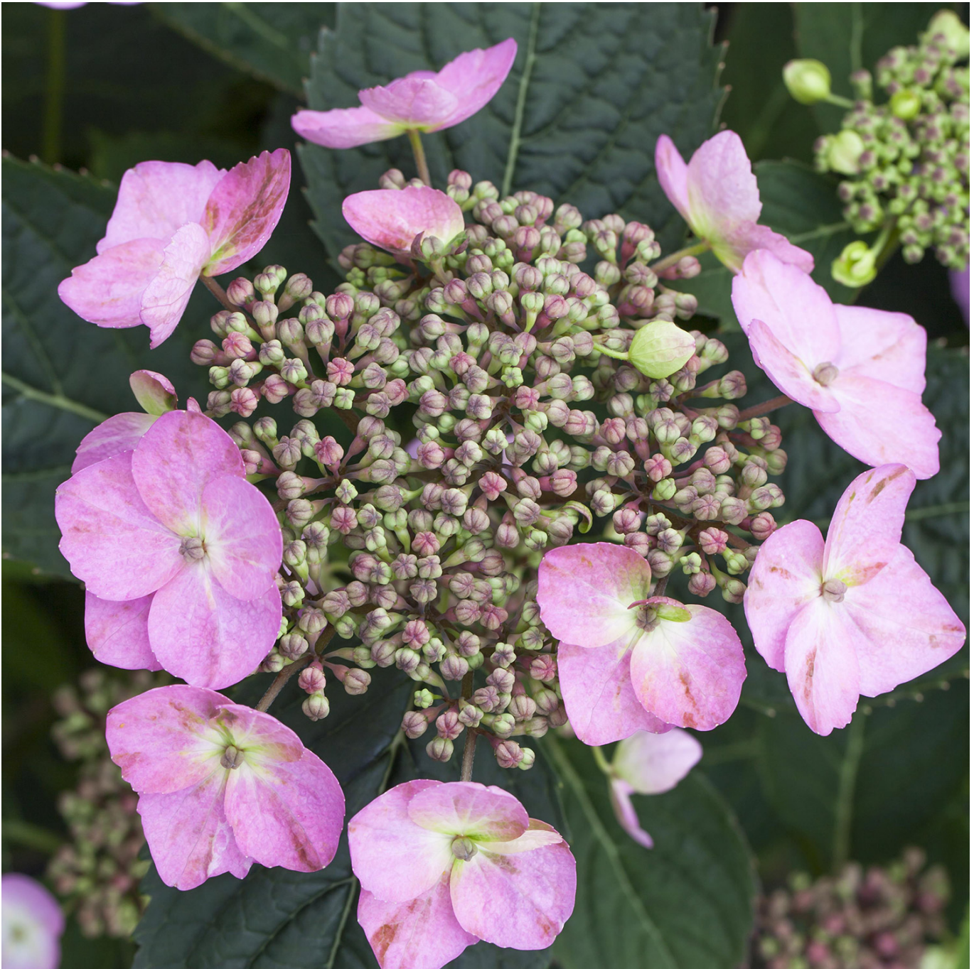
Tellerhortensie 'Cotton Candy' Liefergröße: 30-40 cm - Hydrangea serrata 'Cotton Candy'

Süß wie Zuckerwatte! Der bezaubernde Sortenname 'Cotton Candy' dieser Tellerhortensie bedeutet übersetzt "Zuckerwatte". Hat man sich das einmal verinnerlicht, so erinnert sie tatsächlich an die süße Jahrmarkt-Sleckerei. Die großen Scheinblüten von 'Cotton Candy' sind rosa und weisen in der Mitte kleine, cremeweiße Blättchen auf. Die Ränder sind gebuchtet, was der Blüte einen verspielten Eindruck verleiht. Je nach Bodenbedingungen kann sich das Rosa von 'Cotton Candy' auch in ein Heidelbeer-Blau mit cremeweißer Mitte wandeln. Zudem blüht 'Cotton Candy' am ein- und mehrjährigen Holz. Üppige Blütenpracht ab Juni garantiert! Was 'Cotton Candy' zusätzlich so hinreißend macht, ist ihr kleiner Wuchs. Buschig, gut verzweigt und kompakt wachsend erreicht sie Höhen zwischen 80 und maximal 120 cm. Diese Qualitäten haben ihr bereits die Goldmedaille auf der Plantarium, der internationalen Fachmesse der Baumschulwirtschaft, eingebracht! Hydrangea serrata 'Cotton Candy' verträgt alle sonnigen bis halbschattigen Standorte. Hinsichtlich der Bodenbedingungen ist sie recht anspruchslos. Lediglich ausreichend feucht und durchlässig sollte das Erdreich sein. Das Laub der Tellerhortensie 'Cotton Candy' ergänzt sehr schön die Blüte. Es ist dunkelgrün mit rötlich-braunem Rand, der nach Innen hin verläuft. Unsere Tellerhortensie 'Cotton Candy' kann sowohl im Garten, als auch im Kübel kultiviert werden. Besonders reizvoll wirkt sie entlang von Mauern oder Wegen. Der niedrige Wuchs erlaubt auch