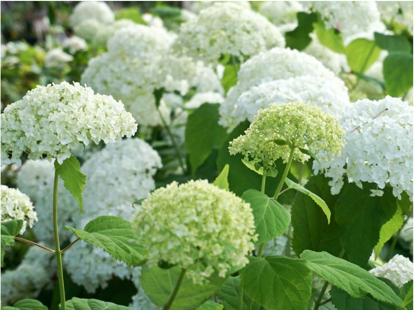
Ballhortensie 'Annabelle' • Hydrangea arborescens 'Annabelle'