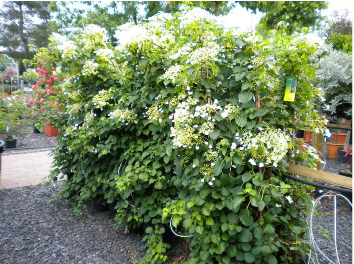
Kletterhortensie • Hydrangea petiolaris