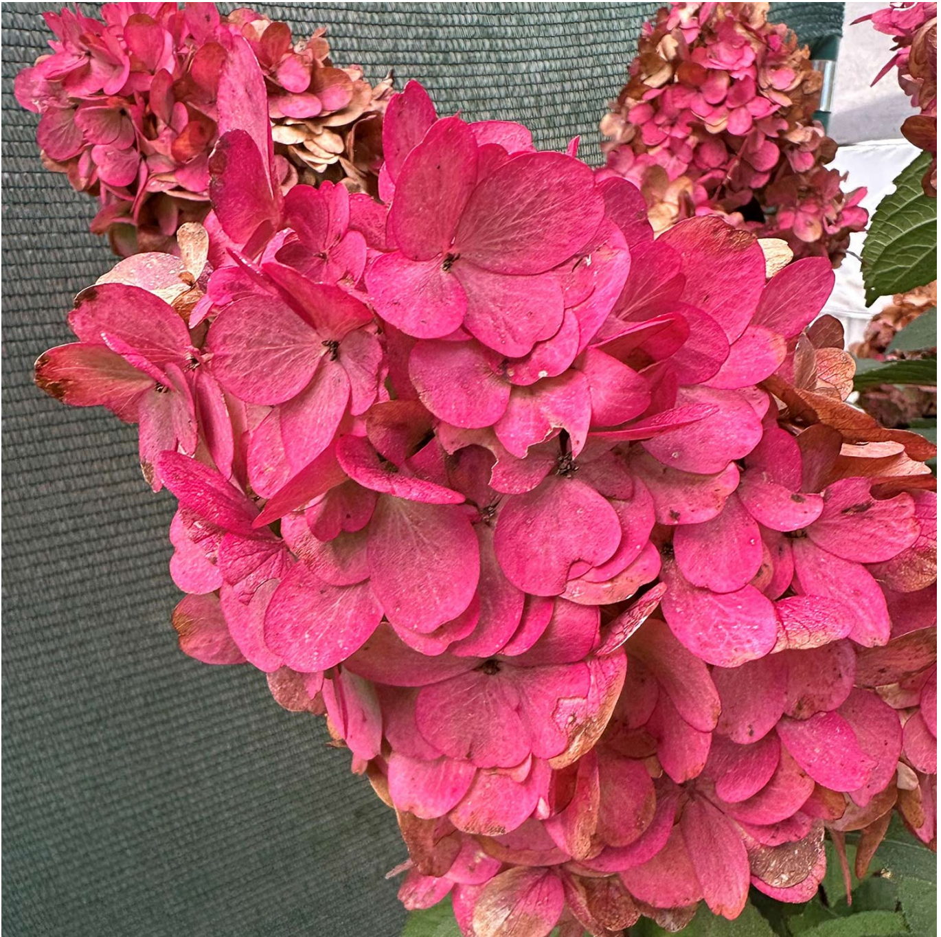
Rispenhortensie 'Bloody Marie' 5 Liter, 80 - 100 cm Liefergröße: 80 - 100 cm - Hydrangea paniculata 'Bloody Marie®'

Rispenhortensie 'Bloody Marie': Farbenpracht im Garten Ein Hauch von Eleganz und Mystik Die Rispenhortensie 'Bloody Marie', botanisch als Hydrangea paniculata 'Bloody Marie' bekannt, ist eine atemberaubende Bereicherung für jeden Garten. Diese Sorte ist eine wahre Meisterin der Farbenpracht, die mit ihren tiefroten Blüten, die in ihrer Intensität und Schönheit an den berühmten Cocktail Bloody Mary erinnern, alle Blicke auf sich zieht. Jede Blüte ist ein kleines Kunstwerk, das mit seiner lebendigen Farbe und der eleganten Form beeindruckt. Im Sommer blüht die 'Bloody Marie' in einem lebhaften Rot auf, das im Herbst in ein sattes, tiefes Burgunderrot übergeht und somit den Garten in ein prachtvolles Farbspiel hüllt. Diese Farbgebung ist nicht nur einzigartig, sondern auch ein Symbol für Leidenschaft und Dramatik. Die Pflanze schafft eine Atmosphäre voller Eleganz und Mystik und verzaubert jeden Betrachter. Ihre Blütenpracht ist ein Fest für die Sinne und macht jeden Garten zu einem unvergesslichen Erlebnis. Darüber hinaus ist die 'Bloody Marie' eine Symbolfigur für Stärke und Widerstandsfähigkeit, da sie trotz ihrer eindrucksvollen Erscheinung erstaunlich unkompliziert in der Pflege ist. Sie gedeiht prächtig in verschiedenen Gartenbedingungen und zeigt eine bemerkenswerte Anpassungsfähigkeit. Die Rispenhortensie 'Bloody Marie' ist daher nicht nur ein optischer Höhepunkt in jedem Garten, sondern