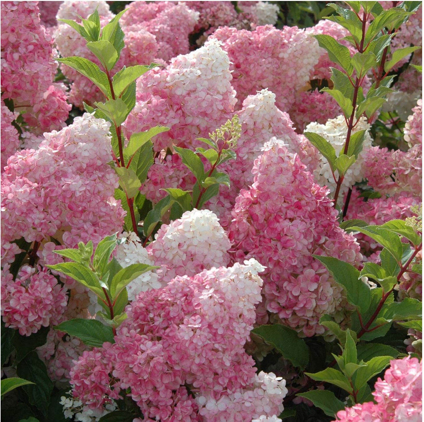
Rispenhortensie 'Vanille-Fraise®', 5 Liter, 40 - 60 cm Liefergröße: 40 - 60 cm - Hydrangea paniculata 'Vanille-Fraise'

Die Rispenhortensie Vanille Fraise ist eine neue, aus Frankreich stammende Züchtung, die uns mit ihren unglaublich schönen Blüten überzeugt. Die Blüten beginnen im Juli in einem warmen Cremeweiß zu blühen und entwickeln dann eine rosa Farbe, die sich je nach Standort, Boden und Klima bis zu einem dunklen Purpurrot ausdragen kann. Die Blütenähren laufen spitz zu und bilden durch die vielen Einzelblüten einen Farbverlauf von rosa angehauchtem Weiß bis zu starkem Pink. Die Blüten dieser reizvollen Spätsommer-Blüher verwelken kaum, sie werden eher am Strauch zur Trockenblume und behalten viele Monate lang ihren hohen Zierwert. Rispenhortensie pflanzen Der deutsche Name der Hortensie kommt vom lateinischen Wort für Garten - "Hortus". Der botanische Name, Hydrangea, entspringt dem griechischen "Hydro" und zeugt von ihrer Vorliebe für ausreichend Wasser: Pflanze sie an eine ausreichend feuchte Stelle in deinem Garten. Oder arbeite Lehm, etwas in Flüssigdünger eingeweichte Holzkohle oder guten Kompost als Wasserspeicher mit in die Erde ein. An einem halbschattigen Standort ist es leichter, die Pflanzen feucht zu halten. Die Rispenhortensie Vanilla Fraise ist robust und anpassungsfähig, wird aber am richtigen Standort schöner. Bei der Auswahl des Platzes muss du bei Gehölzen die endgültige Breite des ausgewachsenen Strauches beachten: Eine Hydrangea