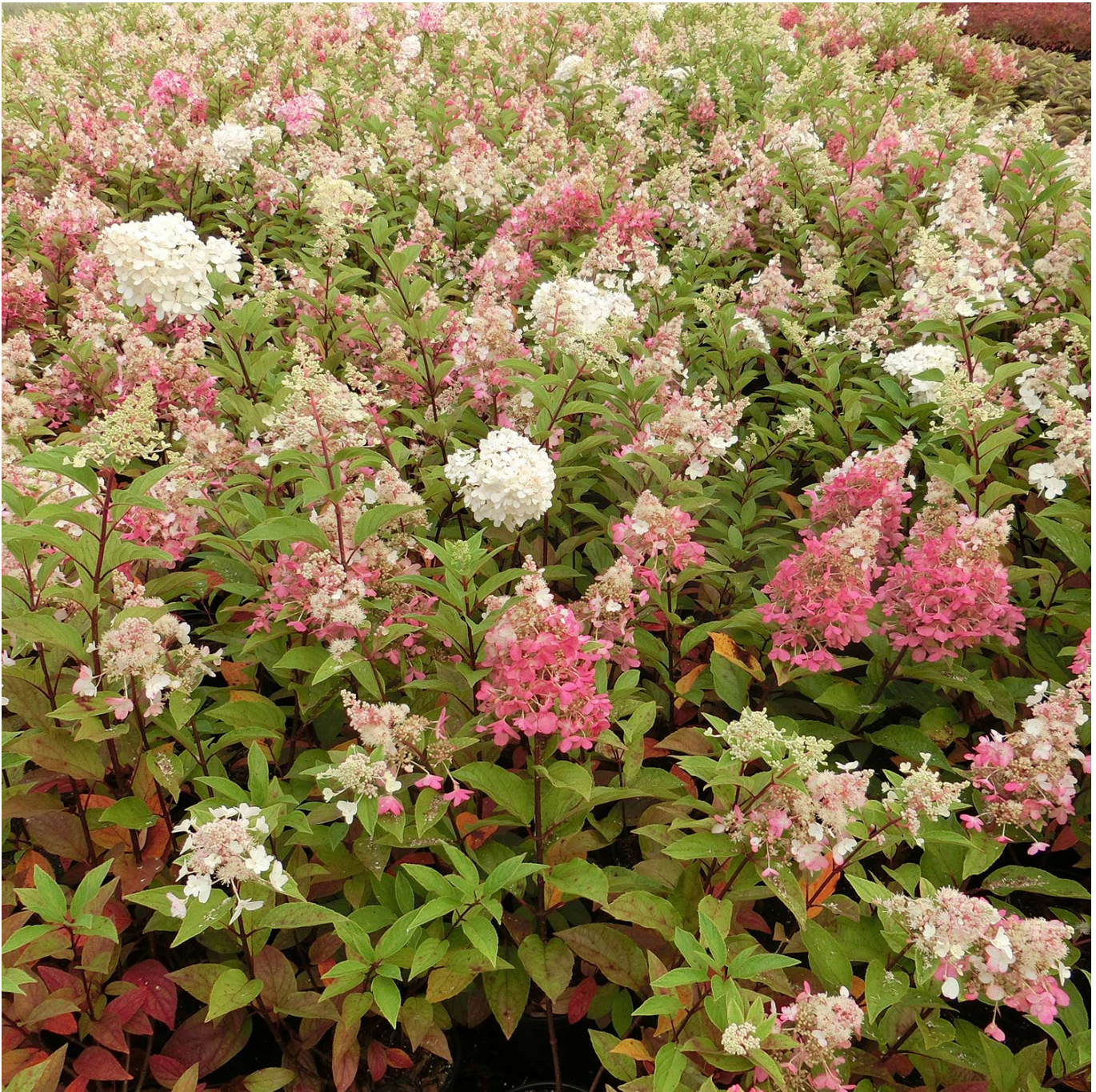
Rispenhortensie 'Candlelight'® 60 - 80 cm Liefergröße: 60 - 80 cm - Hydrangea paniculata 'Candlelight'®

Diese wunderschöne, kompakte Rispenhortensie "Candlelight" trägt knackig grünes Laub an roten Stielen, an denen Sie auch ihre großen, grüngelben Blütenrispen präsentiert. Im Sommer wandelt sich der Farbton von kräftigem Grüngelb hin zu einem romantischen Pastell-Grüngelb. Diese herrliche Hortensie "Candlelight" ( Hydrangea paniculata ) ist pflegeleicht und winterhart. Sie hat einen buschigen Wuchs und wird etwa 120 cm hoch und breit.