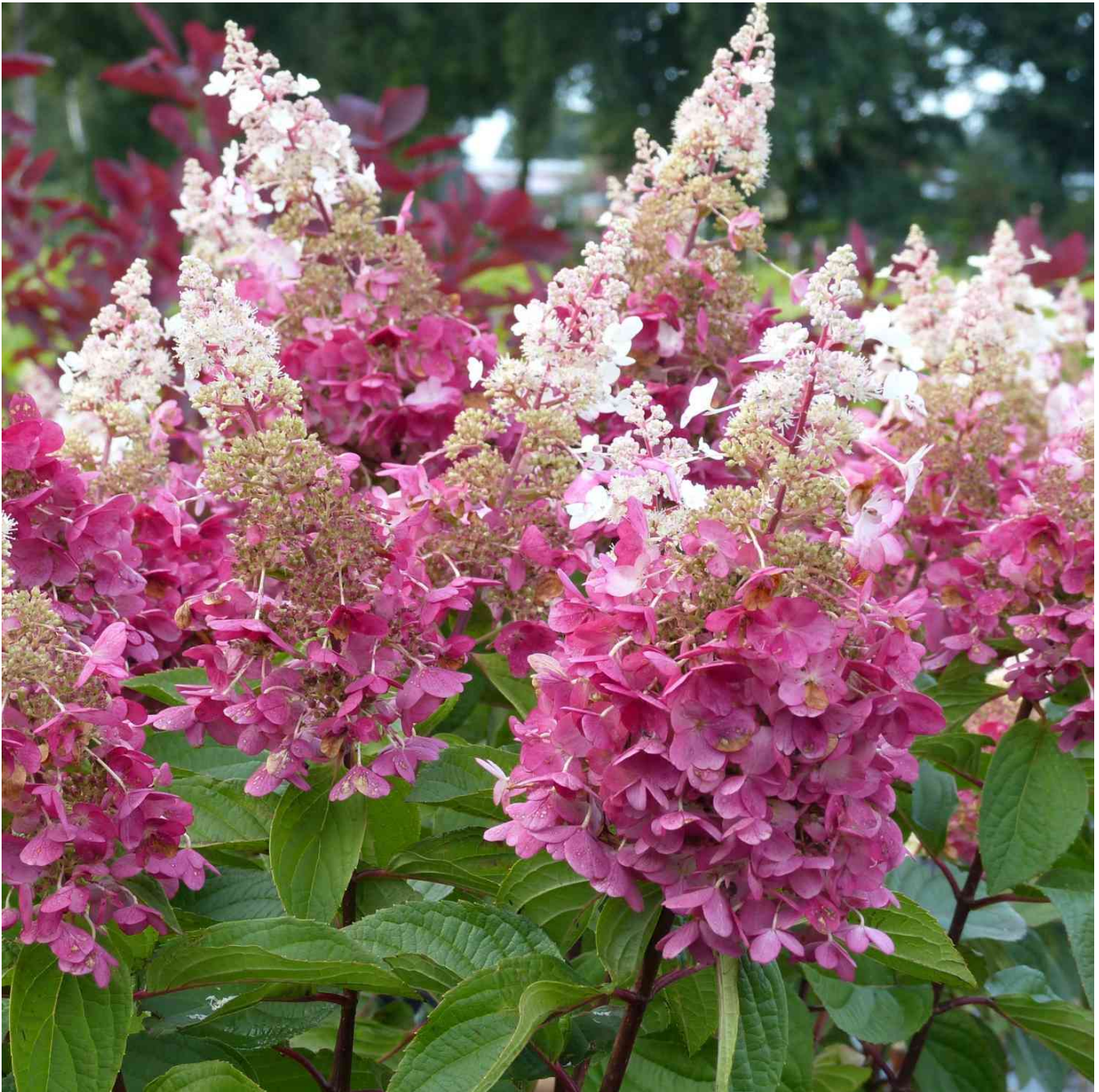
Rispenhortensie 'Pinky Winky®', 20 Liter, 80 - 100 cm Liefergröße: 80 - 100 cm - Hydrangea paniculata 'Pinky Winky®'

Rispenhortensie 'Pinky Winky' - Einzigartige Blütenpracht Die Rispenhortensie 'Pinky Winky' ist nicht nur ein Name, der Neugier weckt, sondern auch eine Pflanze, die mit ihrer beeindruckenden Blütenfarbe verzaubert. Schillernde Farbwechsel Beginnend mit großen, kegelförmigen, weißen Blüten, die sich im Laufe der Zeit von unten nach oben rötlich färben, bietet 'Pinky Winky' ein faszinierendes Naturschauspiel in Ihrem Garten. Robust und Anpassungsfähig Die Hortensie zeichnet sich durch einen aufrechten und breiten Wuchs aus. Ihre grünen, eiförmig zugespitzten Blätter bilden einen schönen Kontrast zu den spektakulären Blüten. Pflege und Standort 'Pinky Winky' gedeiht am besten in sonnigen bis halbschattigen Lagen und bevorzugt frische bis feuchte, nährhafte und gut durchlässige Böden. Die Pflege dieser Hortensie umfasst vor allem regelmäßiges Wässern während der Blütezeit und an heißen Tagen. Vielseitige Verwendung Ob als beeindruckende Hecke, als majestätischer Solitär im Garten oder in einem großen Kübel auf dem Balkon oder der Terrasse - 'Pinky Winky' ist eine vielseitige Pflanze, die jedem Außenbereich ein farbenprächtiges Flair verleiht.