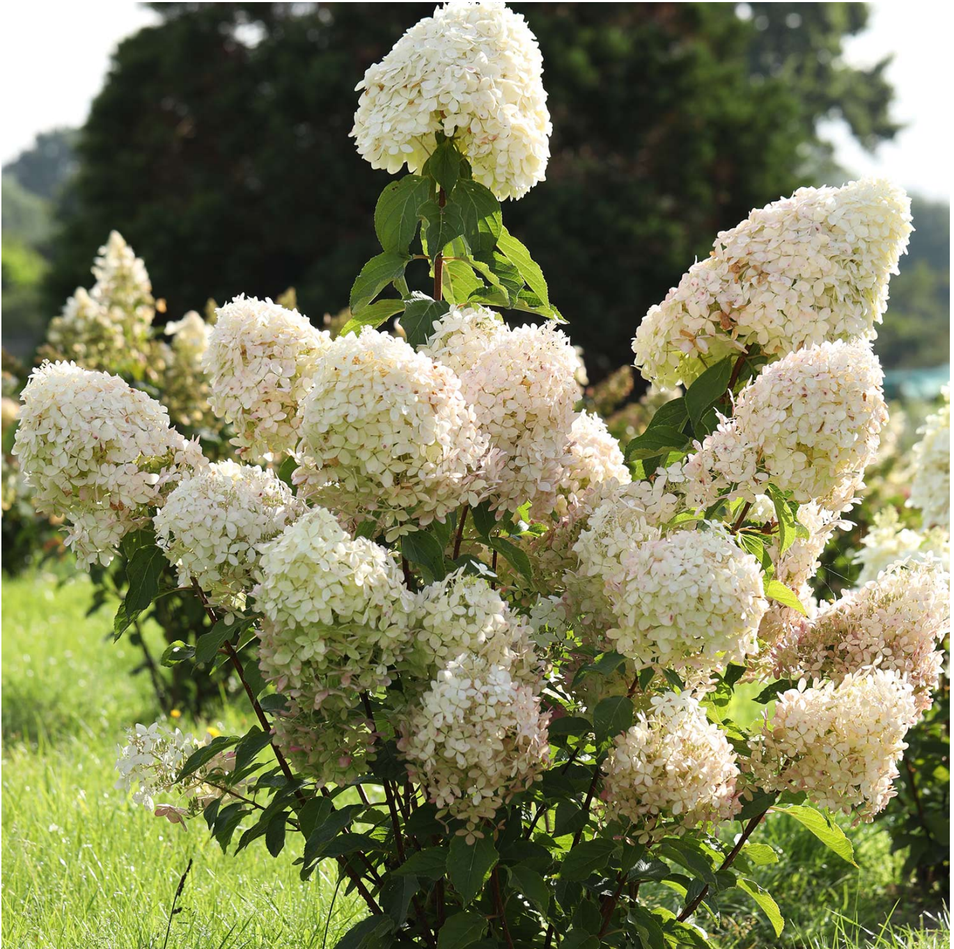
Rispenhortensie 'Phantom' 5 Liter Container Liefergröße: 40 -60 cm - Hydrangea paniculata `Phantom`

Die Rispenhortensie "Phantom" erfreut uns während ihrer Blütezeit mit einem einzigartigen Farbspiel. Ihre Blüten sind anfangs weiß und färben sich nach und nach hinüber zu einem rosarot. Die Blütenrispen sind ca. 30 cm groß und haben ihre Hauptblütezeit von August bis Oktober. Diese Hortensie ist besonders wirkungsvoll in Gruppen wie zum Beispiel als Hecke, kann aber auch sehr gut in Einzelstellung gehalten werden. Auch eine Pflanzung in einem großen Kübel ist denkbar. Hier sollte man noch mehr auf eine ausreichende Wasserversorgung achten, als ohnehin schon. Besonders in den ersten 3 Jahren ist ein leichter Winterschutz zu empfehlen.