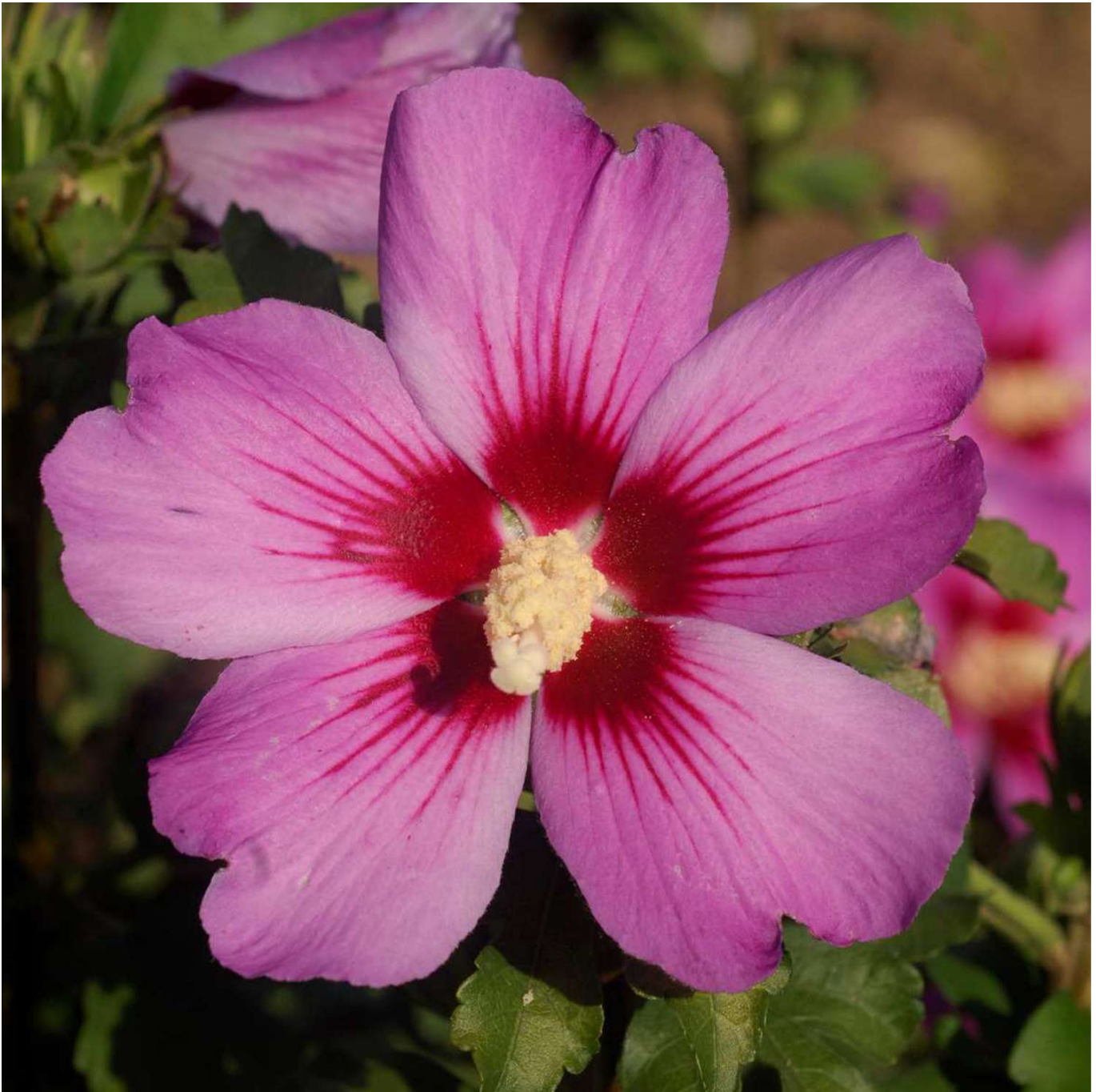
Garteneibisch 'Russian Violet®' Liefergröße: 40 - 60 cm - Hibiscus syriacus 'Russian Violet®'