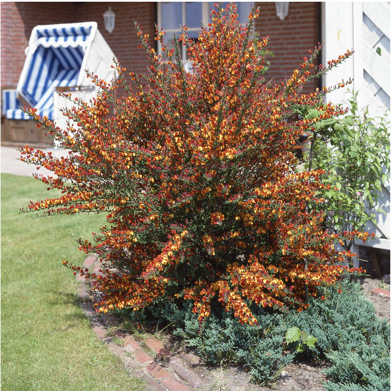
Edelginster 'Lena' Liefergröße: 40-60 cm - Cytisus scoparius 'Lena'