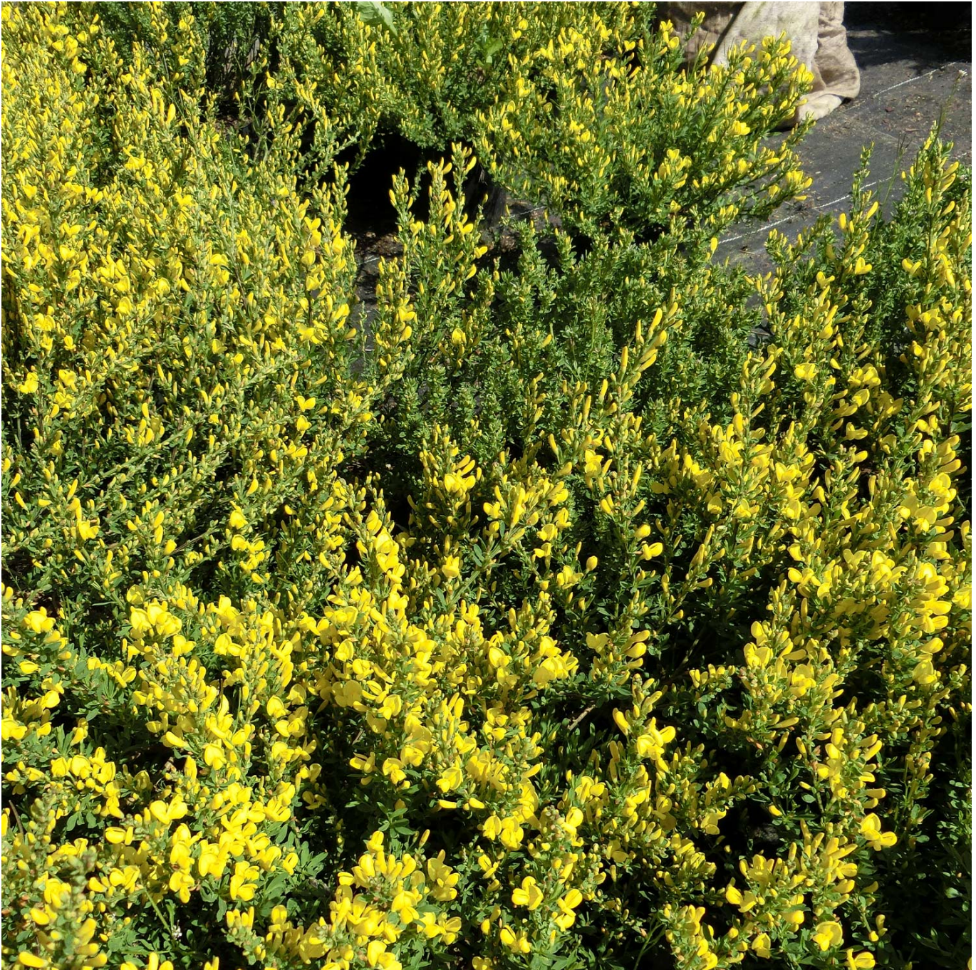
Edelginster 'Allgold' Liefergröße: 40-60 cm - Cytisus praecox 'Allgold'

Der Edelginster 'Allgold' - Ein goldener Frühlingsbote Der Edelginster 'Allgold' (botanisch: Cytisus praecox 'Allgold') ist eine spektakuläre Bereicherung für jeden Garten, die mit ihren intensiv gelben Blüten von Mai bis Juni nicht nur eine optische Augenweide bietet, sondern auch einen angenehmen, zarten Duft verströmt. Dieser Kleinstrauch, eine Kreuzung aus zwei Wildarten, ist in Mitteleuropa