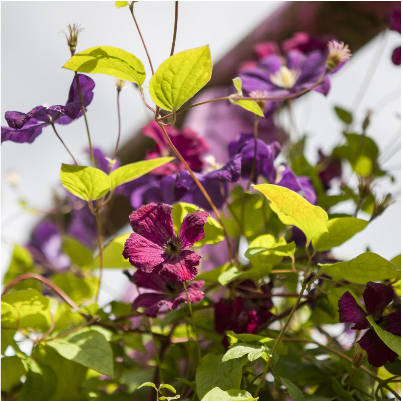
Clematis 'Rubra' Liefergröße: 40 - 60 cm - Clematis viticella 'Rubra'

Die fesselnde Schönheit der Clematis 'Rubra', ein Mitglied der viticella-Gruppe, verzaubert mit ihrer intensiven burgunderroten Blütenpracht von Juli bis September. Ihre samtigen Blüten, eingefasst mit einem leichten Weißschimmer an den Säumen, bieten einen atemberaubenden Anblick in jedem Garten. Eine robuste Ergänzung für Ihren Garten Dank ihrer Zugehörigkeit zur viticella-Gruppe ist 'Rubra' besonders robust gegenüber der Clematiswelke und zeigt eine beeindruckende Frosthärte. Diese Eigenschaften machen sie zu einer pflegeleichten Wahl für Gartenliebhaber. Ideal für Kübel und als Kletterpflanze. Kübelhaltung: 'Rubra' eignet sich hervorragend für die Pflanzung in Kübeln, wo sie mit ihrer prächtigen Blütenfarbe beeindruckt. Kletterhilfe: Als Kletterpflanze benötigt sie eine Struktur zum Ranken, ideal für Pergolen, Zäune und andere Gartenstrukturen. Pflege und Standort Diese Clematis bevorzugt einen sonnigen bis halbschattigen Standort und einen humosen, nährstoffreichen sowie gut durchlässigen Boden. Achten Sie darauf, Staunässe zu vermeiden, um optimale Wachstumsbedingungen zu schaffen. Gestalten Sie Ihr grünes Refugium mit der Clematis 'Rubra', die mit ihrer leuchtenden Farbe und Robustheit überzeugt. Ein Muss für jeden Garten, der mit Farbtiefe und Vitalität erstrahlen soll.