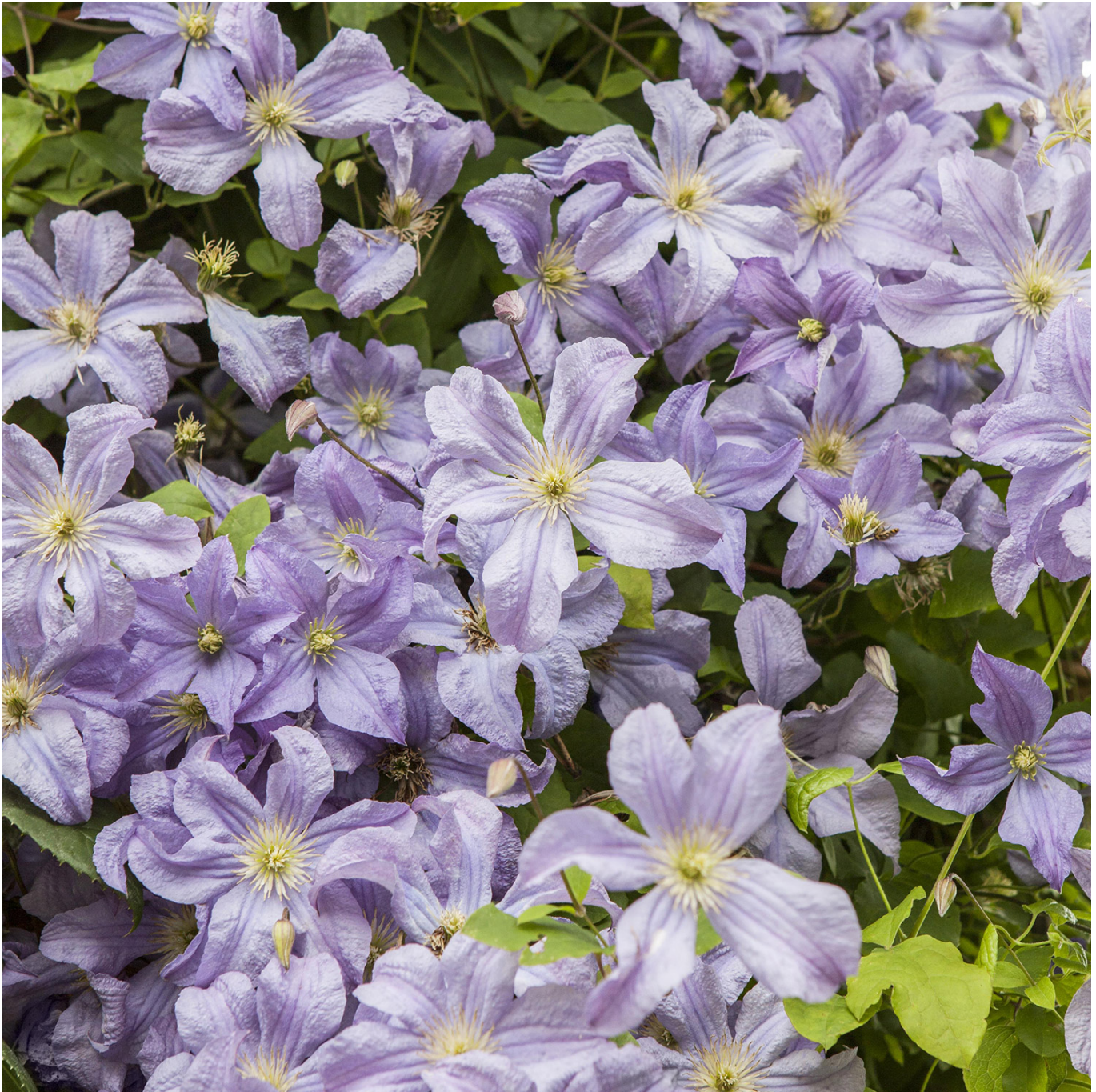
Clematis 'Prince Charles' Liefergröße: 60 -100 cm - Clematis viticella 'Prince Charles'

Clematis 'Prince Charles' - Ein blauer Adelige im Garten Benannt nach dem britischen Thronfolger, bereichert die Clematis 'Prince Charles' jeden Garten mit ihrer adeligen Präsenz. Ihre hell- bis mittelblauen Blüten, verziert mit einem charakteristischen purpurfarbenen Mittelstreifen, sind ein Zeugnis ihrer königlichen Eleganz. Ein Prachtexemplar für Einsteiger Als eine der gesündesten und robustesten Sorten der Clematis-Familie, ist 'Prince Charles' besonders geeignet für Gartenneulinge. Ihre Pflegeleichtigkeit und Widerstandsfähigkeit gegenüber der gefürchteten Clematis-Welke machen sie zu einer verlässlichen Wahl für jeden Garten. Farbspiel der Blüten Die Farbtintensität der Blüten wird maßgeblich von den Lichtverhältnissen beeinflusst, was der 'Prince Charles' eine faszinierende Dynamik verleiht. Von Juni bis September können Gartenbesitzer das Wechselspiel von Farben bewundern, welches die Pflanze in ein ständig veränderndes Kunstwerk verwandelt. Pflege und Standort Die Clematis 'Prince Charles' bevorzugt einen sonnigen bis halbschattigen Standort mit einem humosen, nährstoffreichen und gut durchlässigen Boden. Eine Mulchschicht am Fuß der Pflanze schützt die Wurzeln vor direkter Sonneneinstrahlung und bewahrt die Feuchtigkeit. Kletterhilfe für majestätisches