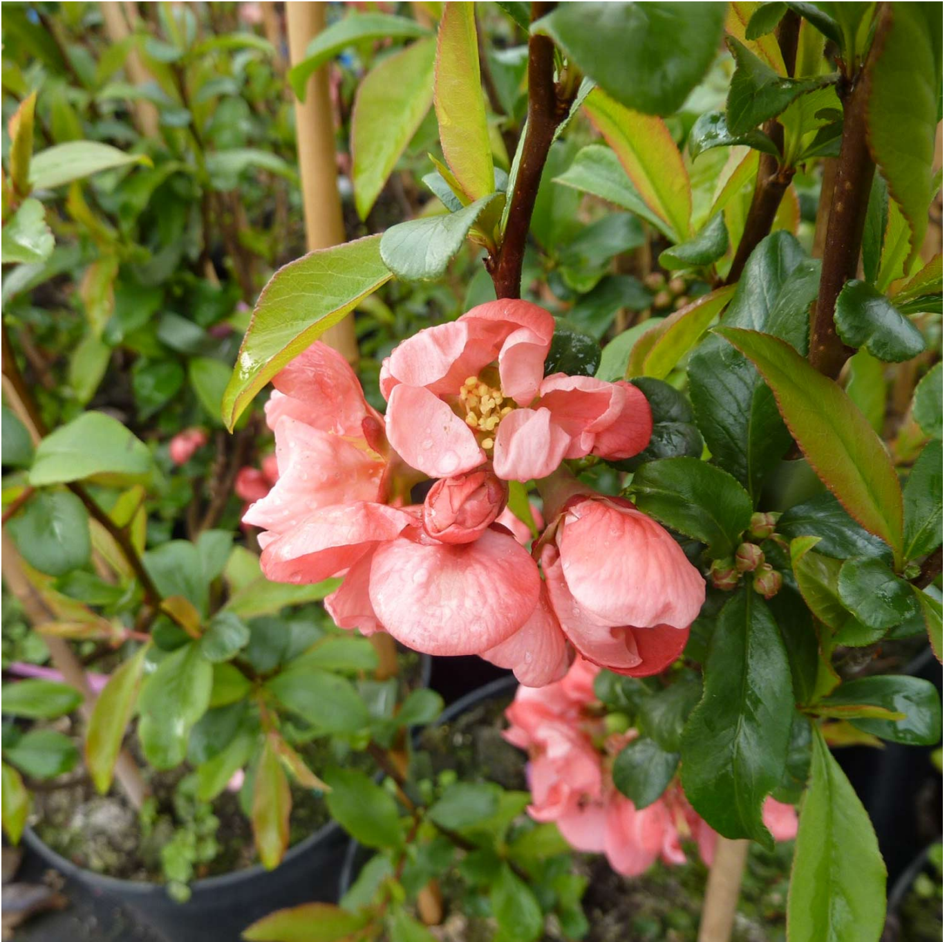
Zierquitte 'Pink Lady' Liefergröße: 40 - 60 cm - Chaenomeles 'Pink Lady'

Die Zierquitte "Pink Lady" ist wegen ihrer leuchtend dunkelrosa Blüten und den Früchten ein besonders beliebtes Ziergehölz. Die Blüten dieser Zierquitte blühen ab Mai am zweijährigen Holz, deshalb sollten Sie mit dem Rückschnitt vorsichtig sein. Ab September erscheinen die Früchte, sie sind gelbgrün, quittenartig und essbar. Sie lassen sich auch sehr gut für Gestecke verwenden. Der Wuchs der Zierquitte "Pink Lady" ist aufrecht und breitbuschig.