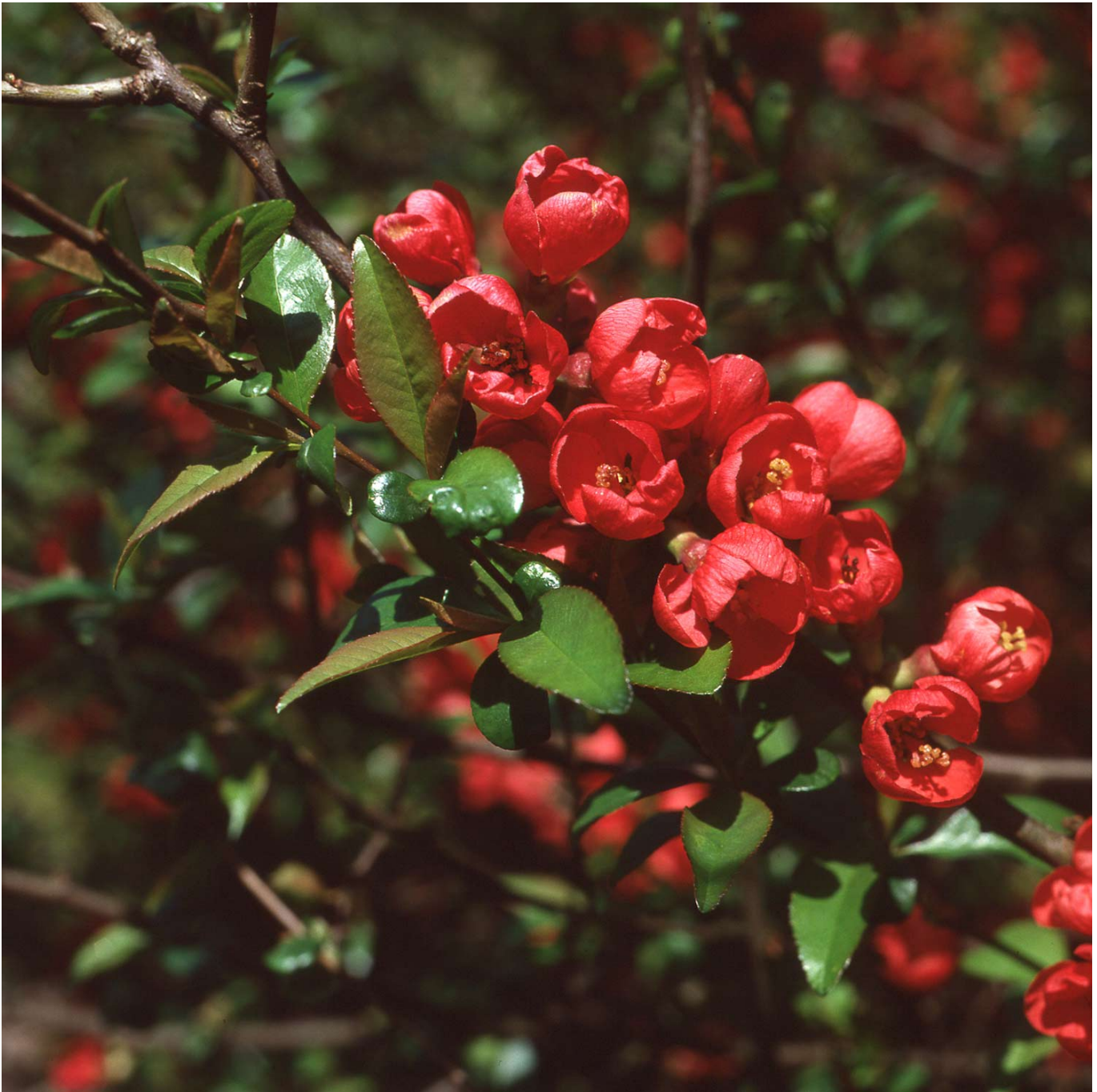
Zierquitte 'Fire Dance' Liefergröße: ca. 40 - 60 cm - Chaenomeles 'Firedance'

Die Zierquitte "Fire Dance" wird ein Highlight in Ihrem Garten sein. Die Blüten dieser Zierquitte sind signalrot und haben eine tolle Fernwirkung. Sie erscheinen ab Mai am zweijährigen Holz und blühen sehr üppig und zahlreich. Ihre Früchte trägt die Zierquitte "Firedance" ab September. Diese sind vorerst grün und werden zunehmend gelber. Sie sind essbar und gut für Dekorationen geeignet. Diese Zierquitte hat einen aufrechten, ausladenden Wuchs.