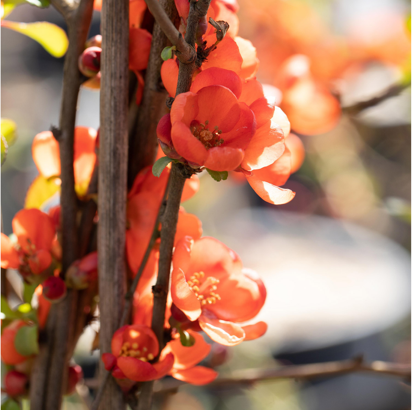
Zierquitte 'Orange Trail' Liefergröße: 40 - 60 cm - Chaenomeles x superba 'Orange Trail'

Zierquitten sind ideale Sträucher für kleine, dichte Hecken. Es sind kleine, dornige Sträucher, die auf jedem Boden gedeihen und keiner besonderen Pflege bedürfen. Die Apfel- Birnenförmigen Früchte der Zierquitte 'Orange Trail' werden goldgelb und bis zu 4 cm dick. Sie sind besonders aromatisch und sehr säurehaltig, sodass man gut Gelee, Mus, Likör oder beispielsweise Quittenbrot davon herstellen kann. Reif sind sie ca. von September bis November. Die Blütezeit der Zierquitte ist März bis Mai. Der Standort sollte sonnig bis halbschattig sein.