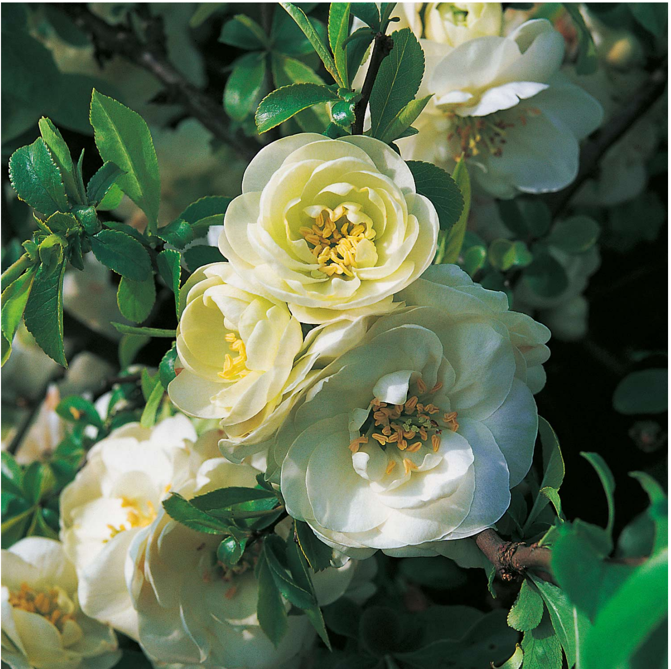
Zierquitte 'Nivalis' Liefergröße: 40-60 cm - Chaenomeles sp. 'Nivalis'

Die Zierquitte 'Nivalis': Ein Frühlingshighlight in ReinweißDie Zierquitte 'Nivalis' verzaubert jeden Garten mit ihren prachtvollen, reinweißen Blüten, die im Mai und Juni erscheinen. Ihre später leuchtend gelben, essbaren Früchte sind nicht nur eine Zierde, sondern bieten auch kulinarische Verwendungsmöglichkeiten.Strahlende Blüten und leuchtende FrüchteIm späten Frühjahr bedecken die reinweißen Blüten der 'Nivalis' die sparrig wachsenden Zweige und bieten einen herrlichen Anblick. Die anfangs grünen Früchte reifen zu einer intensiven gelben Farbe heran und sind ein wahrer Blickfang im Garten.Pflegeleicht und vielseitigMit ihrem sparrigen Wuchs und den bedornten Trieben eignet sich die Zierquitte 'Nivalis' hervorragend für Hecken und als Solitärpflanze. Sie ist anspruchslos und gedeiht besonders gut auf nährstoffreichen und gut feuchten, leicht sauren Böden. Ein Standort in voller Sonne