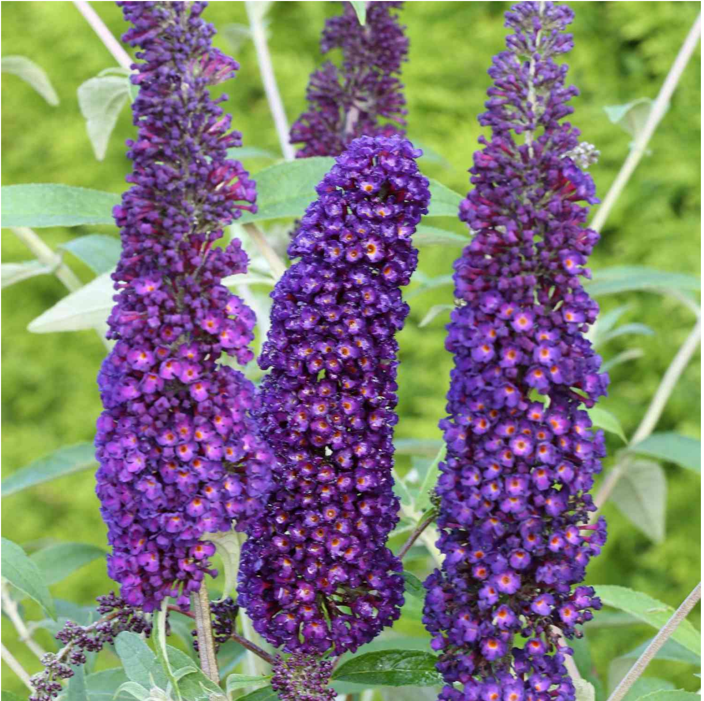
Schmetterlingsflieder 'Black Knight' Liefergröße: 40 - 60 cm - Buddleja davidii 'Black Knight'

Sommerflieder 'Black Knight': Der dunkle Schmetterlingsmagnet Sommerflieder 'Black Knight': Eine dunkle Schönheit Der Sommerflieder 'Black Knight' ist bekannt für seine intensiv dunkelvioletten Blüten