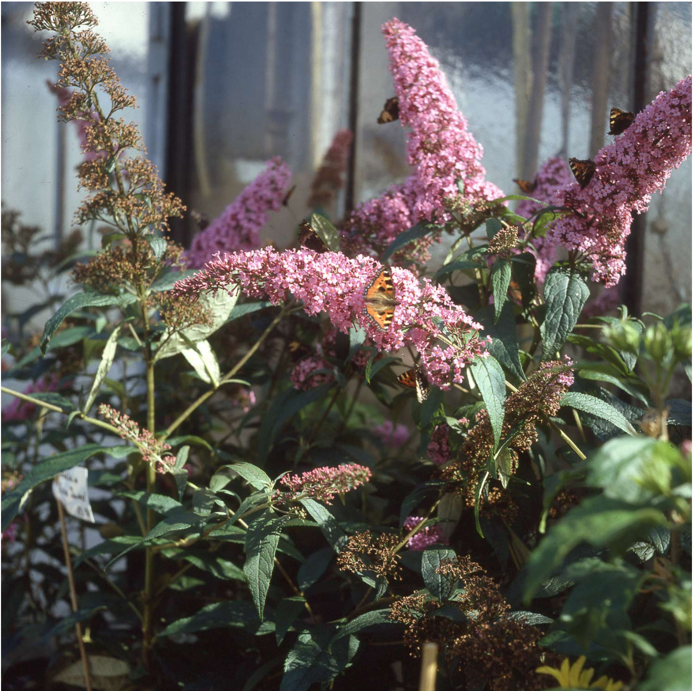
Schmetterlingsflieder 'Pink Delight' Liefergröße: 40 - 60 cm - Buddleja davidii 'Pink Delight'

Sommerflieder 'Pink Delight': Die Pracht der dunkelrosa Blüten Der Sommerflieder 'Pink Delight' ist bekannt für seine großblumigen, dunkelrosa Blütenrispen, die von Juli bis Oktober nicht nur das Auge erfreuen, sondern auch mittelstark duften. Blühende Schönheit mit Robustheit Diese Sorte zeichnet sich durch ihre Trockenheitstoleranz und Stadtklimafestigkeit aus. Die langen, bogig überhängenden Blütenrispen erscheinen am einjährigen Holz und bieten eine reich blühende Pracht, die durch einen Rückschnitt im Frühjahr noch intensiviert wird. Gestaltungsmöglichkeiten Mit seinem trichterförmigen Aufbau und den leicht überhängenden Seitenzweigen eignet sich 'Pink Delight' hervorragend als Solitärpflanze in sonnigen Gärten oder als Teil einer farbenfrohen Hecke, die Schmetterlinge anzieht und den Garten belebt. Blütezeit: Juli bis Oktober Farbe: Dunkelrosa, kräftige Rosafärbung Standort: Volle Sonne für beste Blütenbildung Boden: Durchlässig, nicht zu trocken Pflege und Standort Der 'Pink Delight'