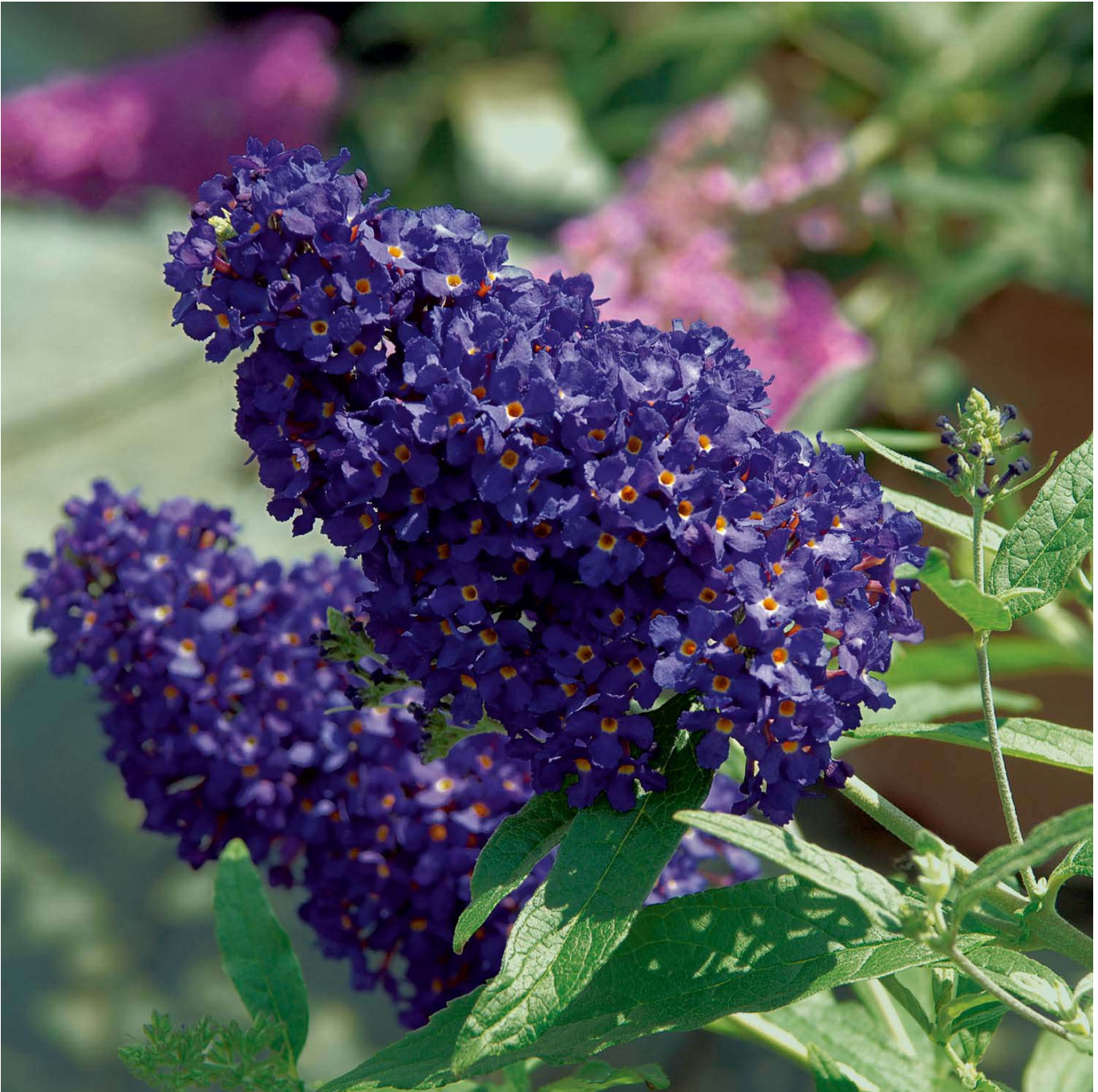
Sommerflieder 'Buzz Midnight' Lieferform: Im 3 Liter Topf - Buddleja davidii 'Buzz® Midnight'

Zwerg-Sommerflieder 'Buzz® Midnight': Ein nächtliches Duftwunder Zwerg-Sommerflieder 'Buzz® Midnight': Ein Magnet für Schmetterlinge Der Zwerg-Sommerflieder 'Buzz® Midnight' bringt mit seinen intensiven blauviolettten Blüten und dem herrlichen Duft Leben in jeden Garten, Balkon oder Terrasse. Trotz seiner kompakten Größe zieht dieser robuste und anspruchslose Strauch Schmetterlinge und Bienen in Scharen an, beweisend, dass wahre Attraktivität nicht in der Größe liegt. Hauptmerkmale des 'Buzz® Midnight' Intensiv gefärbte Blütenrispen: Dunkelrosa Blüten entwickeln sich zu prächtigen blauviolettten Rispen, die bis zu 25 cm lang werden können. Lange Blühzeit: Von Juli bis Anfang Oktober bietet 'Buzz® Midnight' ein durchgehendes Blütenmeer. Ideal für Kübelpflanzungen: Mit seinem kompakten, aufrechten Wuchs eignet sich dieser Strauch perfekt für die Terrasse oder den Balkon. Robust und pflegeleicht: Trockenheitstolerant und winterhart, benötigt 'Buzz® Midnight' nur minimalen Schutz in kalten Wintern. Schmetterlings- und bienenfreundlich: Ein wahrer Anziehungspunkt für bestäubende Insekten, bereichert er die Biodiversität Ihres Gartens. Pflege und Standort Der Zwerg-Sommerflieder 'Buzz® Midnight' bevorzugt sonnige bis halbschattige Standorte und