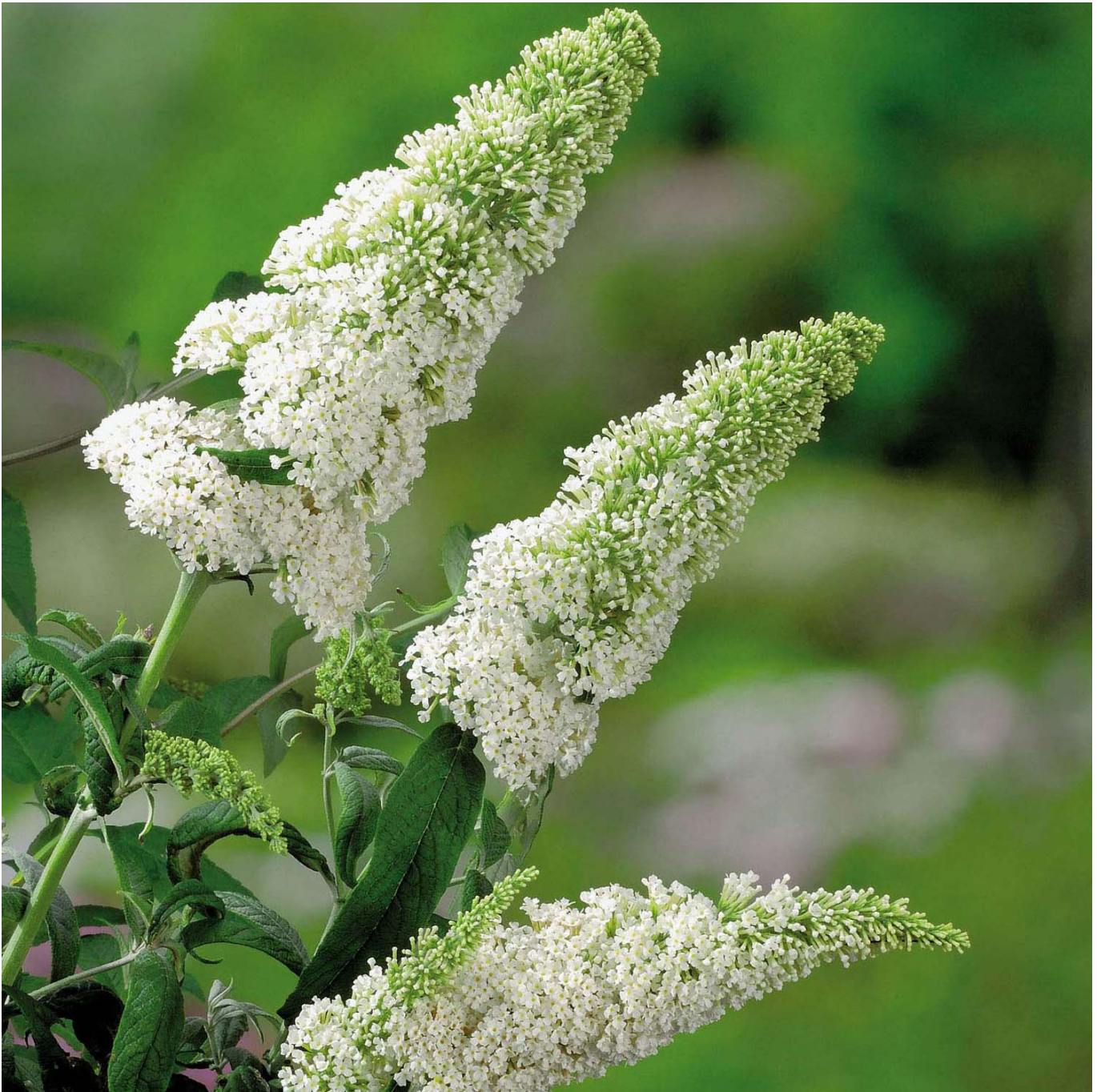
Schmetterlingsflieder 'White Profusion' Liefergröße: 40 - 60 cm - Buddleja davidii 'White Profusion'

Die Blüten des weißen Schmetterlingsfliers 'White Profusion' besteht aus großen Rispen, die im Hochsommer wunderbar nach Vanille und Muskatblüten duftet. Man kann sie auch sehr gut als Schnittblumen verwenden. Der Schmetterlingsflieder hat seinen Namen durch seine magnetische Anziehungskraft, die er auf Schmetterlinge ausübt. Sein Wuchs ist aufrecht mit hängenden Zweigen. Er erreicht eine Höhe von bis zu 3 Meter und fühlt sich auf normalen Gartenboden in der Sonne am wohlsten.