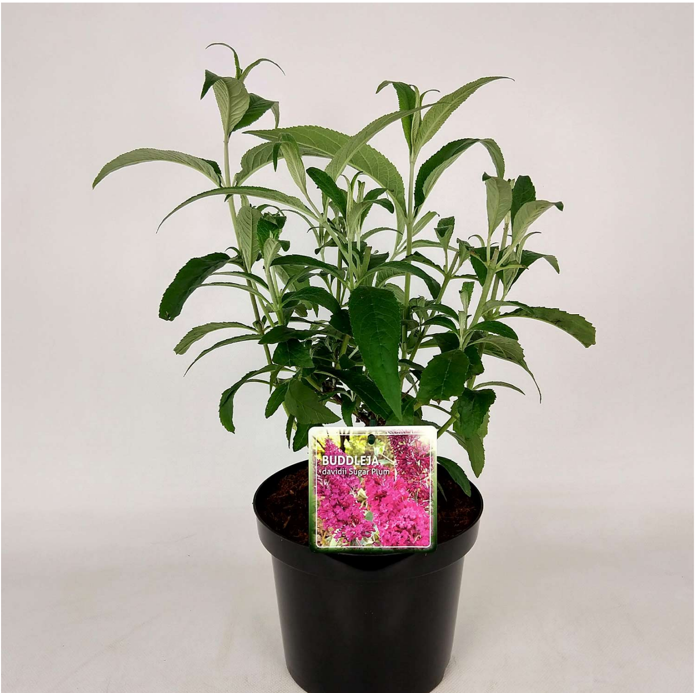
Sommerflieder 'Sugar Plum®' Lieferform: Im 3 Liter Topf - Buddleja davidii

Sommerflieder 'Sugar Plum®': Purpurrote Pracht und Insektenfreund Sommerflieder 'Sugar Plum®': Ein Duft- und Farberlebnis Der Sommerflieder 'Sugar Plum®' (Buddleja davidii 'Sugar Plum') ist ein sommergrüner Strauch, der mit seinen atemberaubenden purpurroten Blütenrispen und seinem angenehmen Duft von Juli bis September eine Bereicherung für jeden Garten darstellt. Die mittelgrünen, lanzettlichen Blätter, die eine Länge von 10 bis 20 cm erreichen, bilden den perfekten Hintergrund für die lebendigen Blütenstände, die Bienen und viele andere Insekten anziehen. Vorteile des Sommerfliers 'Sugar Plum®' Purpurrote Blütenrispen: Ziehen Bienen und Insekten an und bieten ein spektakuläres Farbspiel. Insektenfreundlich: Ein wertvoller Nektarlieferant für Bestäuber. Winterhart und pflegeleicht: Ideal für die Gartengestaltung mit minimaler Wartung. Duftender Zierstrauch: Bereichert Gärten, Terrassen und Balkone mit seinem herrlichen Duft. Pflanz- und Pflegehinweise Der Sommerflieder 'Sugar Plum®' bevorzugt einen vollsonnigen Standort und einen lockeren, durchlässigen, nährstoffreichen Boden. Dank seines trichterförmigen, lockeren und aufrechten Wuchses erreicht er eine Höhe von 100 bis 150 cm und eine Breite von 80 bis 100 cm. Auch in einem Kübel macht 'Sugar Plum®' eine gute Figur und bringt Farbe sowie Duft auf Terrassen und Balkone. Ein jährlicher Rückschnitt im Frühjahr fördert einen kräftigen Wuchs und eine reiche Blütenbildung. Erleben Sie die purpurrote Pracht