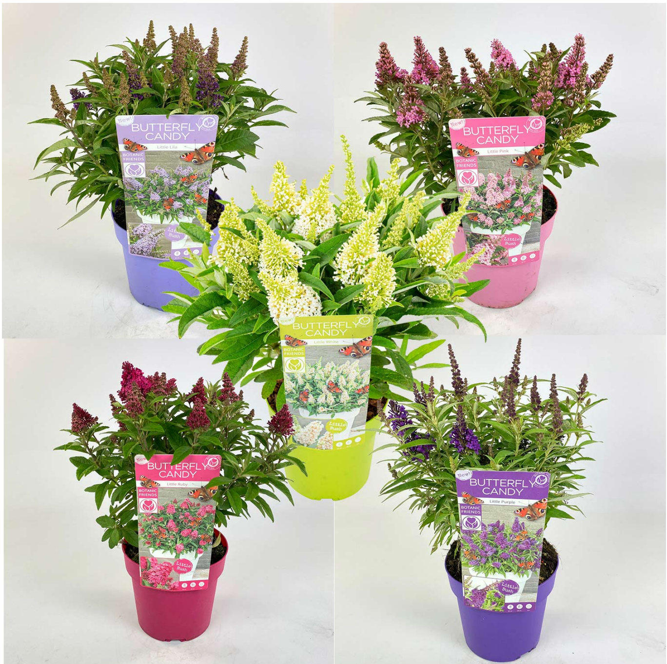
Zwerg-Schmetterlingsflieder 'Butterfly Candy®' - 5 Sorten im Set Liefergröße: , 5 Stück , 30 - 40 cm - Buddleja davidii