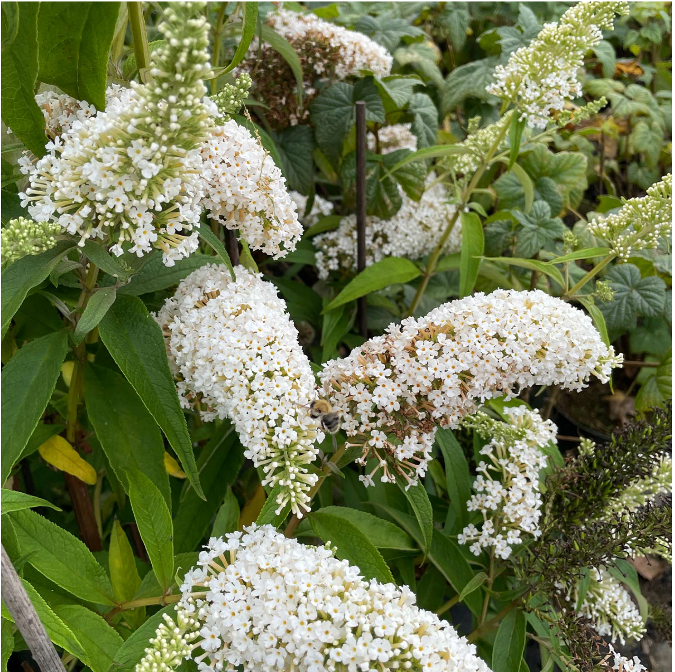
Schmetterlingsflieder 'Peace' Lieferform: Im 3 Liter Topf - Buddleja 'Peace'

Der Sommerflieder weckt Gefühle an schöne Tage im Sommer, an denen man das bunte Treiben unzähliger Schmetterlinge rund um die verzaubernden Blüten beobachten konnte. Der wüchsige Buddleja 'Peace' ist ein vitaler Sommerflieder und hat einen aufrechten und leicht überhängenden Wuchs. Dabei erreicht er eine Höhe von 2 bis 3 Metern. Ein wahres Muss aller Liebhaber von Schönheit und Schmetterlingen ist daher die Pflanzung dieses Flieders, der bei frostfreiem Boden ganzjährig gesetzt werden kann. Er ist winterhart und sehr schnittverträglich. Der Rückschnitt sollte dabei jährlich erfolgen um die gewünschte Verzweigung und Blüte zu erhalten. Zudem können Sie so das Verholzen der Pflanze verhindern. Das lanzettliche Blatt ist grün, leicht behaart und zeigt an der Blattunterseite eine silbrige Färbung. Dieses satte Grün ist ein wunderschöner Akzent zu den vollen, weißen Blüten die sich während Ihrer Blütezeit von Juli bis September präsentieren. Dabei verströmen die langen weißen Rispen einen leichten Duft. Auch deswegen wird dieser Strauch gerne als Schmetterlingflieder oder Schmetterlingsstrauch bezeichnet - er ist ein wahrer Schmetterlingsmagnet. Er bevorzugt sonnige bis halbschattige Standorte. Es kann ein Universal- oder Langzeitdünger zur Unterstützung verwendet werden.