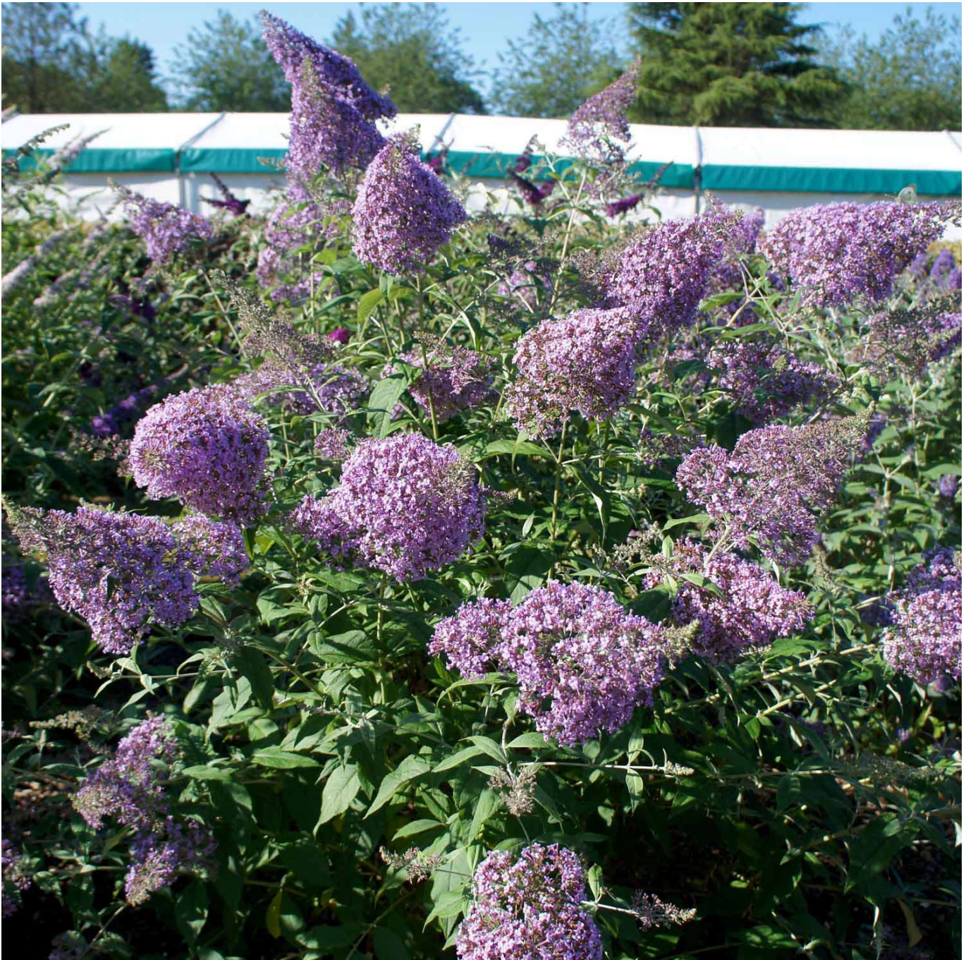
Riesenblütiger Sommerflieder 'Gulliver' Lieferform: Im 5 Liter Topf - Buddleja 'Gulliver'

Der Riese unter den Sommerfliedern! Riesenblütiger Sommerflieder 'Gulliver' stellt jeden herkömmlichen Sommerflieder in den Schatten! Die Blütenrispen sind tatsächlich riesig! Bis zu 30 cm lang und entsprechend dick können sie werden. Hunderte der vierzähligen Einzelblüten sind auf einer Rispe von 'Gulliver' vorzufinden! Und die sind in der wunderschönen, klassisch lila Farbe gehalten. Die Mitte ist von einem orangen Auge gekennzeichnet - ganz so wie man den Sommerflieder kennt! Die Blüten von 'Gulliver' sind auf die Bestäubung langrüsseliger Insekten angewiesen. Das bringt ihm auch die Alternativbezeichnung Schmetterlingsflieder ein. Denn diese lieben den zarten Duft und den süßen Nektar von 'Gulliver'! Riesenblütiger Sommerflieder zieht in der Zeit von Juli bis September aber auch Bienen, Hummeln und gefährdete Holzbienen magisch an! Buddleja 'Gulliver' ist trotz üppiger Blüte anspruchslos und robust wie die Wildform. Ein sonniger bis halbschattiger Standort und lockerer, tiefgründiger Boden ist bestens geeignet. Vermeiden Sie jedoch unbedingt Staunässe! 'Gulliver' ist zudem trockenheitsverträglich, sobald er gut angewachsen ist. Riesenblütiger Sommerflieder trägt längliches, dunkelgrünes Laub mit charakteristisch silbriger Unterseite. Der Wuchs ist buschig, aufrecht und trotz der großen Blütenstände kompakt. 'Gulliver' blüht am diesjährigen Holz und sollte daher jährlich zurückgeschnitten werden. Das fördert reichen Blütenansatz und kräftigen Wuchs! Riesenblütiger