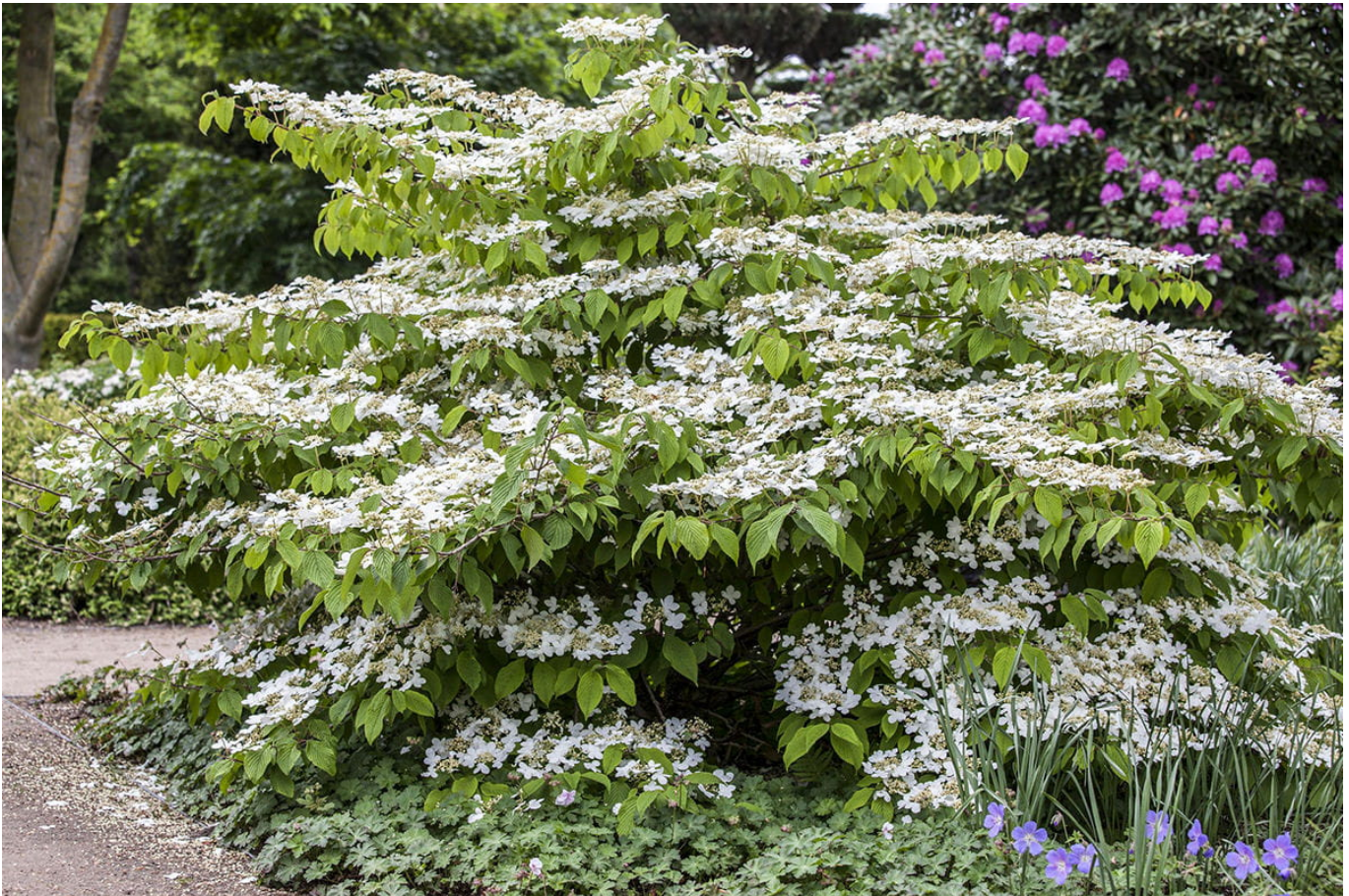
Japanischer Schneeball 'Mariesii' • Viburnum plicatum 'Mariesii'

Schneebälle lassen nicht immer an den Winter denken. Auch das Gärtnerherz schlägt höher, wenn vom Schneeball die Rede ist. Die winterharten Ziergehölze wachsen schnell und zeigen im Mai, warum sie den Namen Schneeball verdienen. Die Blüten erscheinen auffällig und beinahe kugelförmig. Neben dem klassisch weißen Schneeball sind auch Rosa- und Blautöne gefragt. Im Herbst zeigt die Pflanze eine hübsche Rotfärbung. Gießen Sie die Schneebälle reichlich und wählen einen halbschattigen Standort.