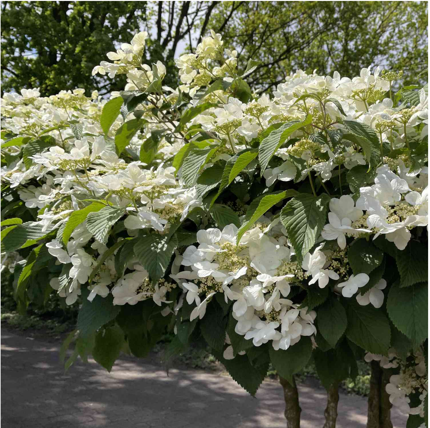
Japanischer Schneeball 'Mariesii' Container, 3 Liter, 40 - 60cm Liefergröße: 40-60cm - Viburnum plicatum mariesii

Japanischer Schneeball 'Mariesii': Ein Highlight für den FrühlingsgartenDer Japanische Schneeball 'Mariesii' beeindruckt im Mai und Juni mit cremeweißen, später zu Rosatönen verblühenden Blüten, die harmonisch auf waagerechten Trieben arrangiert sind. Sein elliptisch geformtes, dunkelgrünes Laub wandelt sich im Herbst zu einem eindrucksvollen Dunkelrot bis Braunviolett.Mit seinem lockeren, aufrechten und breit ausladenden Wuchs erreicht 'Mariesii' eine Höhe von etwa 2 Metern. Diese pflegeleichte und frostharte Sorte stellt kaum Ansprüche an Boden und Standort, verträgt jedoch keine Trockenheit und bildet kaum Früchte.Standort und Pflege'Mariesii' gedeiht am besten in sonnigen bis halbschattigen Lagen auf frischem, gut durchlässigem Boden. Ein regelmäßiges Gießen, besonders in trockenen Perioden, unterstützt die Gesundheit und Blütenpracht des Strauches. Er benötigt kaum spezielle Pflege und ist somit ideal für Gartenliebhaber, die Wert auf eine unkomplizierte Gartengestaltung legen.Standort: Sonnig bis halbschattig.Boden: Frisch, gut durchlässig.Blütezeit: Mai bis Juni.Verwendung: Zierstrauch, Solitärpflanze, breit ausladende Hecke.Warum den Japanischen Schneeball 'Mariesii' wählen?Wählen Sie den Japanischen Schneeball 'Mariesii' für seine eindrucksvolle Blütenpracht im Frühjahr und die farbenfrohe Laubfärbung im Herbst. Eine pflegeleichte, frostharte