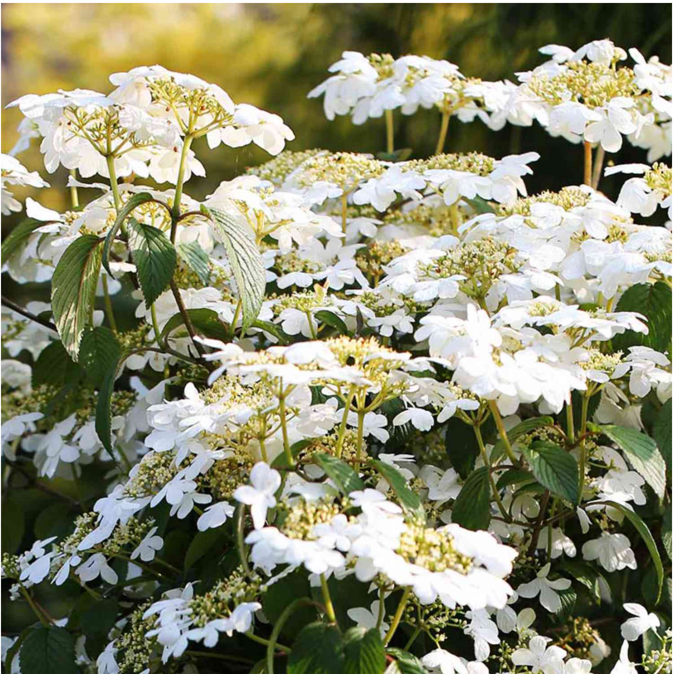
Japanischer Schneeball 'Watanabe', 5 Liter, 60 - 80 cm Liefergröße: 60 - 80 cm - Viburnum plicatum 'Watanabe'

Überprüfe deshalb die Eigenschaften und die tagesaktuellen Preise im Onlineshop unserer Partner.)