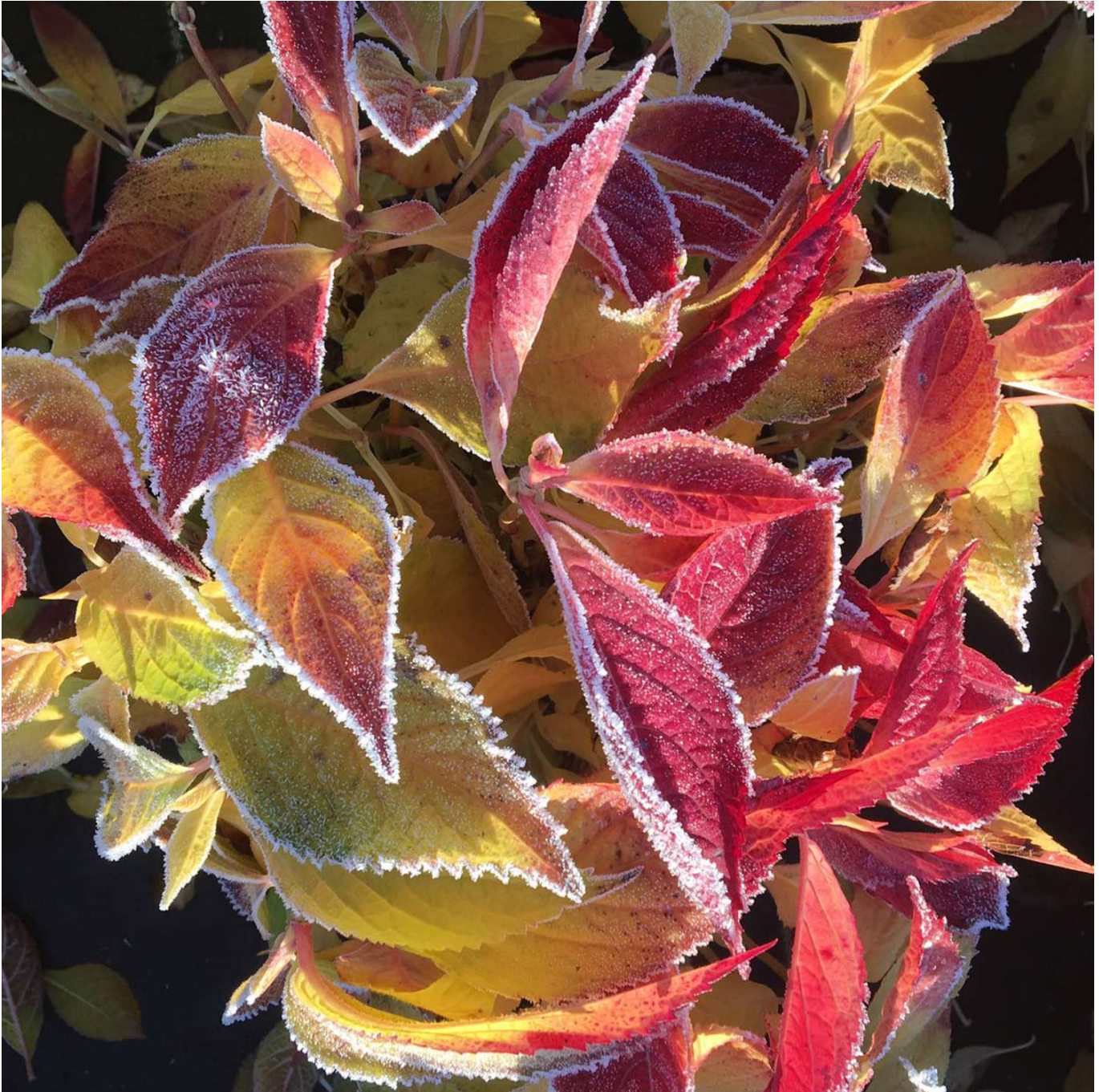
Kleinwüchsige Tellerhortensie 'Koreana', 3 Liter, 30 - 40 cm Liefergröße: 30 - 40 cm - Hydrangea serrata 'Koreana'

Kleinwüchsige Tellerhortensie 'Koreana' Die Kleinwüchsige Tellerhortensie 'Koreana', auch als Gesägte Hortensie bekannt, bereichert jeden Garten mit ihren prachtvollen blau und rosa schimmernden Blüten ab Juli. Ihre frischgrünen Blattknospen signalisieren schon im Frühjahr den baldigen Farbenrausch. Blütenpracht im Kompaktformat Mit ihrer kompakten Wuchshöhe von bis zu 50 cm ist 'Koreana' perfekt, um die prächtigen Blütenteller zur Schau zu stellen. Die Pflanze entwickelt sich zu einem breiten Busch und bietet eine kontinuierliche Blütenschau von den Frühlingsblüheren bis zum späten Herbst. Pflege und Standort Dieses robuste und winterharte Ziergehölz bevorzugt einen sonnigen