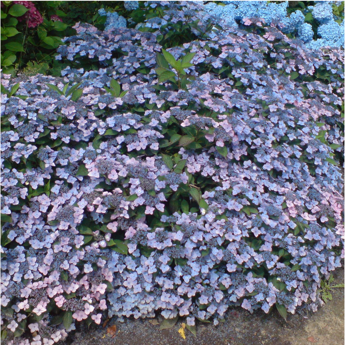
Kleinwüchsige Tellerhortensie 'Koreana', 3 Liter, 20 - 30 cm Liefergröße: 20 - 30 cm - Hydrangea serrata 'Koreana'

Kleinwüchsige Tellerhortensie 'Koreana' Die Kleinwüchsige Tellerhortensie 'Koreana', auch als Gesägte Hortensie bekannt, bereichert jeden Garten mit ihren prachtvollen blau und rosa schimmernden Blüten ab Juli. Ihre frischgrünen Blattknospen signalisieren schon im Frühjahr den baldigen Farbenrausch. Blütenpracht im Kompaktformat Mit ihrer kompakten Wuchshöhe von bis zu 50 cm ist 'Koreana' perfekt, um die prächtigen Blütenteller zur Schau zu stellen. Die Pflanze entwickelt sich zu einem breiten Busch und bietet eine kontinuierliche Blütenschau von den Frühlingsblüchern bis zum späten Herbst. Pflege und Standort Dieses robuste und winterharte Ziergehölz bevorzugt einen sonnigen bis halbschattigen Standort und einen humosen, sauren bis neutralen, gut durchlässigen Boden. Die Blütenfarbe variiert je nach Säuregrad des Bodens von bläulich bis rosa, was der Hortensie 'Koreana' eine faszinierende Vielseitigkeit verleiht. Vielfältige Verwendungsmöglichkeiten Ob als beeindruckende