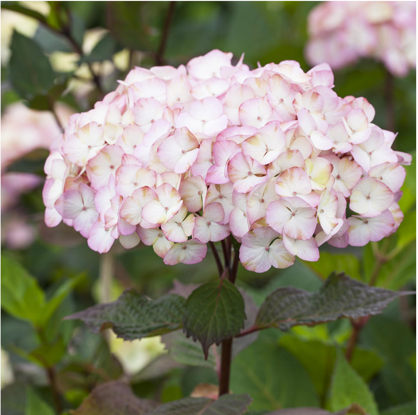
Gartenhortensie 'Preziosa' Liefergröße: 30 - 40 cm - Hydrangea serrata 'Preziosa'

Kleinwüchsige Hortensie 'Preziosa' Die Kleinwüchsige Hortensie 'Preziosa', bekannt für ihre Ausdauer und Schönheit, bereichert jeden kleinen Garten oder Balkon mit ihrem Blütenspektakel von Juli bis Oktober. Mit ihren zierlichen Blütenbällen in zartrosa bis kräftigem Rosarot setzt sie selbstbewusst farbenfrohe Akzente. Robust, Winterhart und Pflegeleicht Hydrangea serrata 'Preziosa' zeichnet sich durch eine außerordentliche Winterhärte und Robustheit aus. Ein moderater Schnitt unterstützt ihre natürliche Schönheit, ohne die Blütenpracht des folgenden Jahres zu gefährden. Dieser kleine Strauch gedeiht prächtig in Gesellschaft immergrüner Gräser und filigraner Farne, und bereichert den Garten mit seiner einzigartigen rotbraunen Laub- und Triebfärbung. Anspruchslos und Vielseitig 'Preziosa' ist anspruchslos hinsichtlich ihres Standortes und gedeiht auf nährstoffreichem, humosem Boden am besten. Sie bevorzugt ausreichende Feuchtigkeit, besonders in trockenen Perioden. Ihre Blütenpracht, die am alten Holz erscheint, und die unverkennbare Farbgebung machen sie zu einem unverzichtbaren Bestandteil jedes Gartens. Ein Hingucker im Garten Mit ihrer Wuchshöhe von 100 bis 150 cm fügt sich die Kleinwüchsige Hortensie 'Preziosa' harmonisch in jede Gartengestaltung ein. Ob als Solitärpflanze oder in Gruppen gepflanzt – sie sorgt für eine romantische Atmosphäre und zieht alle Blicke auf sich. Entdecken Sie die Kleinwüchsige Hortensie 'Preziosa' für Ihren Garten oder als prächtige