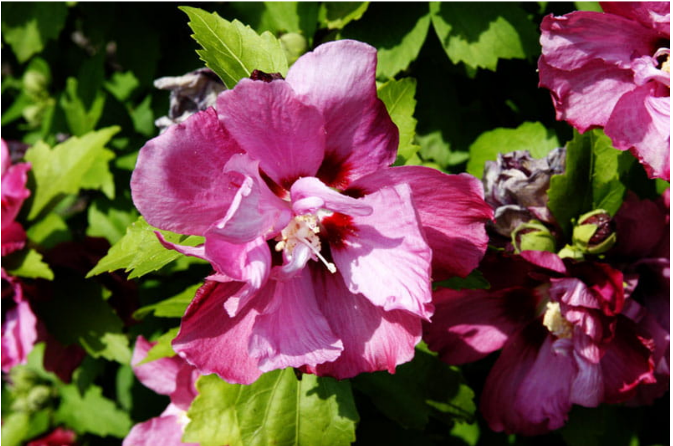
Hibiskus Eibisch 'Duc de Brabant' • Hibiscus syriacus 'Duc de Brabant'

Hibiscusblüten sind nicht nur wegen ihrer Größe, sondern auch aufgrund ihrer trichterförmig zusammenstehenden Kronblätter, sowie des langen charakteristischen Griffels von unverwechselbarem Charme. Besonders die Sorte 'Duc de Brabant' ist dank Ihrer rosa-rot gefüllte Blüte ein prächtiger Blickfang, welcher an jeden Ort begeistert!