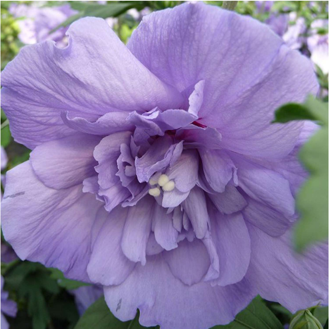
Garteneibisch 'Blue Chiffon' 3-5 Liter, 60 - 80 cm Liefergröße: 60 - 80 cm - Hibiscus syriacus 'Blue Chiffon'

Der Garteneibisch 'Blue Chiffon'®: Ein blaues BlütenwunderDer Garteneibisch 'Blue Chiffon'® (Hibiscus syriacus 'Blue Chiffon'®) ist eine Zierpflanze, die mit ihren zarten blauen Blüten jeden Garten in eine Oase der Ruhe und Schönheit verwandelt. Dieser Hibiskus zeichnet sich durch seine attraktive Blütenfarbe und eine Blütezeit von Juli bis September aus, die den Garten in der zweiten Jahreshälfte belebt. Attraktive Blütenfarbe und robuste EigenschaftenDie halbgefüllten, himmelblauen Blüten des 'Blue Chiffon'® werden von einem dunkleren Basalfleck geziert und bieten einen faszinierenden Anblick. Die Pflanze blüht am diesjährigen Holz, was eine zuverlässige und reiche Blütenpracht jedes Jahr garantiert. 'Blue Chiffon'® ist stadtklimafest und wärmeliebend, was ihn zu einem perfekten Kandidaten für urbane Gärten und geschützte Standorte macht. Pflegeleicht und vielseitig einsetzbarTrotz seiner exotischen Erscheinung ist der Garteneibisch 'Blue Chiffon'® pflegeleicht und stellt geringe Ansprüche an die Gartenpflege. Er bevorzugt sonnige bis halbschattige Standorte mit gut durchlässigem, nährstoffreichem Boden. Der Hibiskus ist winterhart, wobei junge Pflanzen in den ersten Wintern einen leichten Schutz benötigen könnten. Ideal für jeden GartenMit seinem aufrechten Wuchs und der Höhe von bis zu 2-3 Metern eignet sich der 'Blue Chiffon'® hervorragend als Solitärpflanze oder als Teil einer