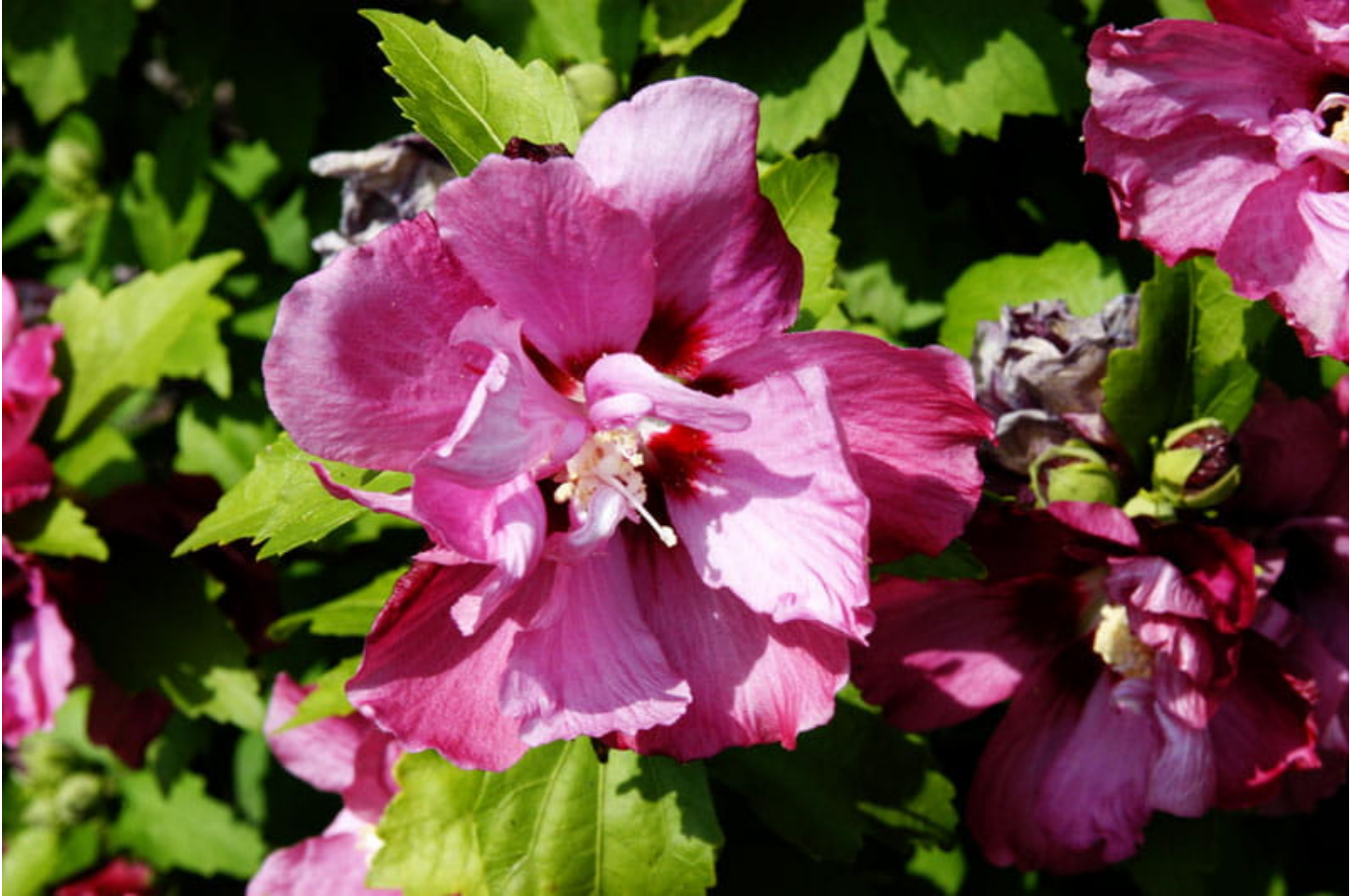
Hibiskus Eibisch 'Duc de Brabant' • Hibiscus syriacus 'Duc de Brabant'

Hibiscusblüten sind nicht nur wegen ihrer Größe, sondern auch aufgrund ihrer trichterförmig zusammenstehenden Kronblätter, sowie des langen charakteristischen Griffels von unverwechselbarem Charme. Besonders die Sorte 'Duc de Brabant' ist dank Ihrer rosa-rot gefüllte Blüte ein prächtiger Blickfang, welcher an jeden Ort begeistert!