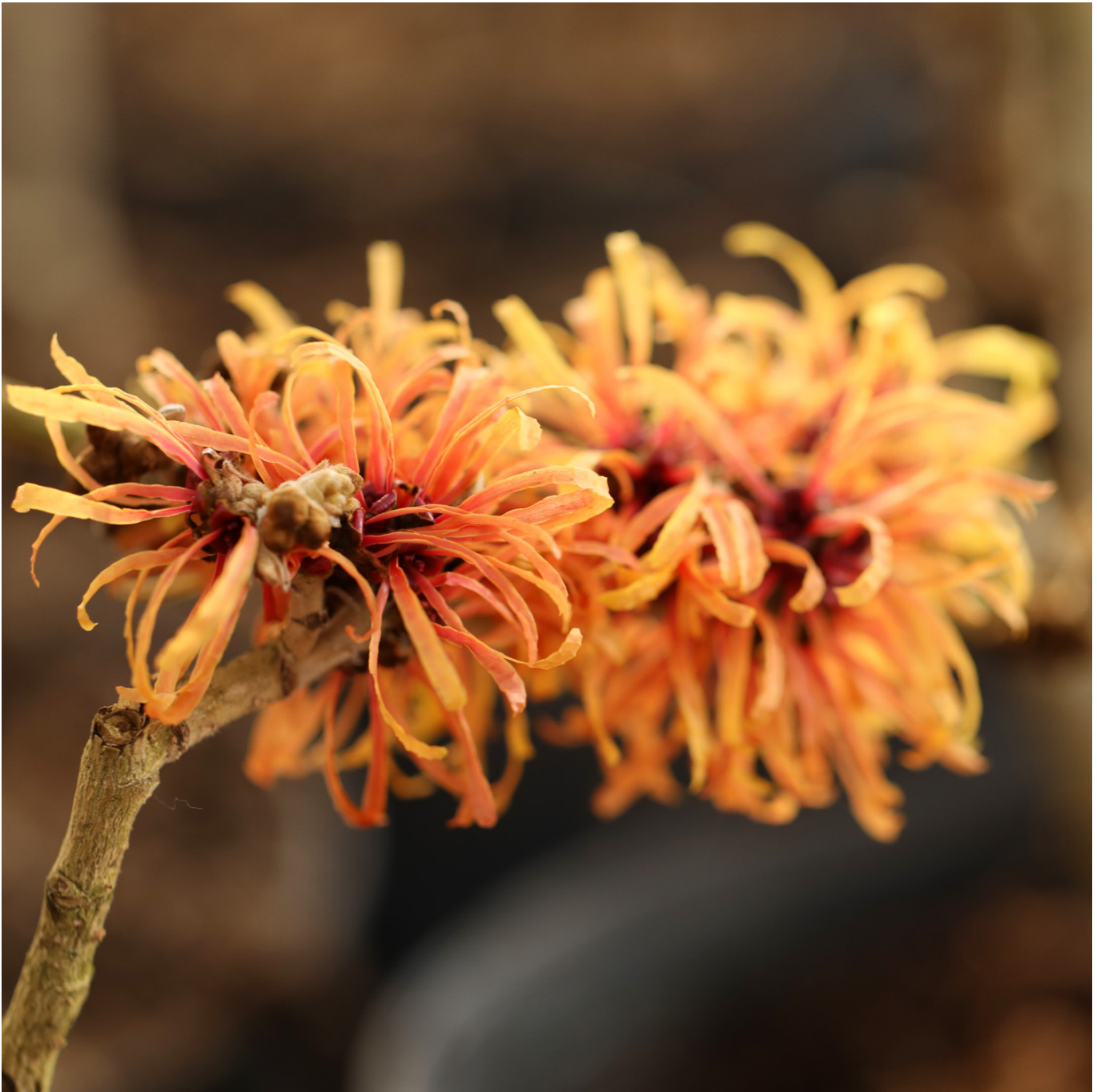
Zaubernuss 'Aphrodite' 3 - 5 Liter Topf, 60 - 80 cm Liefergröße: 60 - 80 cm - Hamamelis intermedia 'Aphrodite'

Die Zaubernuss 'Aphrodite': Ein Farb- und Dufterlebnis im WintergartenDie Zaubernuss 'Aphrodite', botanisch als Hamamelis intermedia 'Aphrodite' bekannt, läuft im Winter zur Hochform auf und bereichert den Garten mit ihrer leuchtenden Blütenpracht. Von Februar bis März zeigt sich dieses schöne Ziergehölz in einem intensiven Orangerot, das den winterlichen Garten in eine farbenfrohe Landschaft verwandelt. Die Blüten dieser Pflanze sind nicht nur ein visuelles Highlight, sondern verströmen auch einen angenehmen, süßlichen Duft, der 'Aphrodite' zu einer besonderen Bereicherung für jeden Garten macht. Dieser mittelhohe, trichterförmig wachsende Strauch erreicht Wuchshöhen zwischen 300 und 400 Zentimetern und zeichnet sich durch seine Winterhärte sowie sein langsames Wachstum aus. Die Zaubernuss 'Aphrodite' ist eine holländische Zuchtsorte, die aus der Kreuzung von Hamamelis mollis und Hamamelis japonica hervorgegangen ist und sich durch ihre fadenförmigen, gekräuselten Blütenblätter und ihre schöne Herbstfärbung auszeichnet. Im Herbst nimmt das dunkelgrüne Laub eine gelbe bis orange Farbe an, die den Garten in einen goldenen Oktober taucht. Pflege und StandortDie Zaubernuss 'Aphrodite' bevorzugt einen geschützten und sonnigen bis halbschattigen Standort. Der Boden sollte idealerweise durchlässig, nährstoffreich und mäßig feucht sein. Eine leichte Säure des