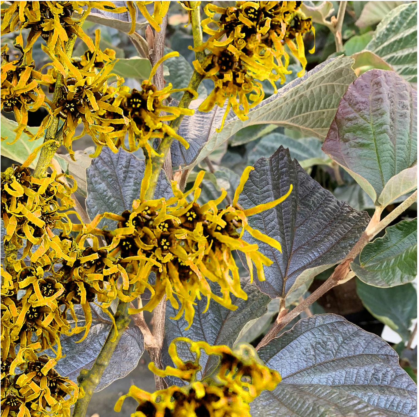
Rotblättrige Zaubernuss 'Yamina' C3 40-60 Liefergröße: 40 - 60 cm - Hamamelis intermedia 'Yamina'

Die magische Anziehungskraft der Zaubernuss 'Yamina' Die Zaubernuss 'Yamina' (bot. Hamamelis intermedia 'Yamina') ist ein Juwel unter den Gartenpflanzen, das die Herzen von Gartenliebhabern höherschlagen lässt. Mitten im Winter, wenn die meisten Gärten noch in ihrem ruhenden Zustand verharren, entfaltet 'Yamina' ihre volle Pracht mit kleinen, gelben Blüten, die den Garten in ein Farbenmeer tauchen und einen zarten Duft verströmen. Ein Farbspektakel im Winter Die Zaubernuss 'Yamina' ist bekannt für ihre einzigartige Fähigkeit, in der kalten Jahreszeit zu blühen. Von Januar bis März sorgen die orangegelben Blüten für spektakuläre Akzente in einem sonst eher farblosen Garten. Doch nicht nur im Winter ist 'Yamina' ein Blickfang: Im Herbst verzaubert sie zusätzlich durch ihre leuchtend rotbraune Laubfärbung und sorgt so für ein durchgängiges Farbspektakel. Pflanz- und Pflegehinweise Die Zaubernuss 'Yamina' ist eine pflegeleichte und robuste Pflanze, die den Gartenjahren Freude bereitet. Für optimales Wachstum und Blütenpracht beachten Sie folgende Hinweise: Standort: 'Yamina' bevorzugt einen sonnigen bis halbschattigen, geschützten Standort. Boden: Gedeiht am besten in nährstoffreichen, leicht sauren Böden, die gut durchlässig sind. Wasser: Regelmäßige, aber mäßige Bewässerung unterstützt die Pflanze, besonders in Trockenperioden. Pflege: Ein Rückschnitt ist in der Regel nicht notwendig, kann aber zur Formgebung oder zur Entfernung abgestorbener Zweige