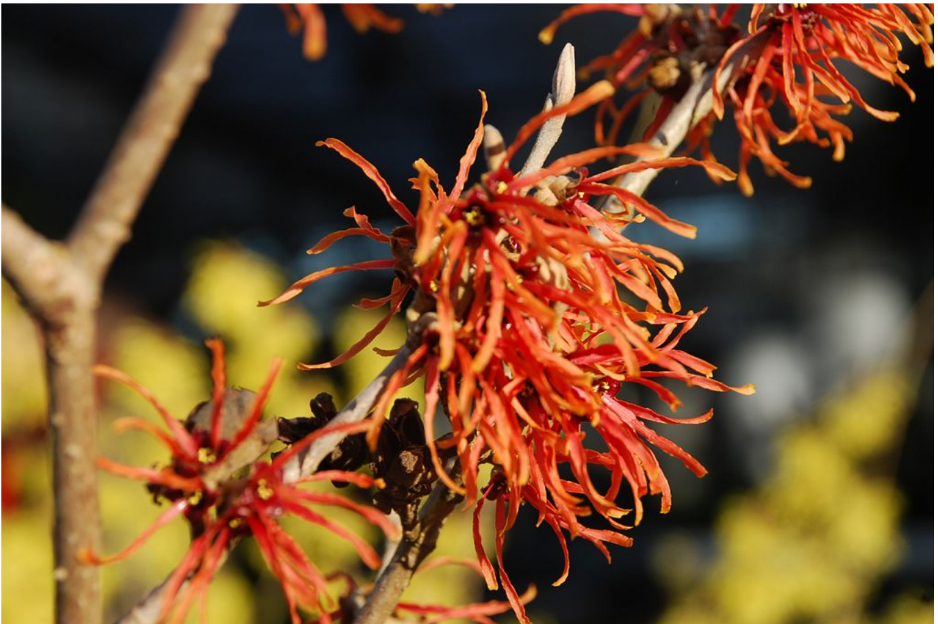
Zaubernuss 'Jelena' • Hamamelis intermedialis 'Jelena'

Überprüfe deshalb die Eigenschaften und die tagesaktuellen Preise im Onlineshop unserer Partner.)