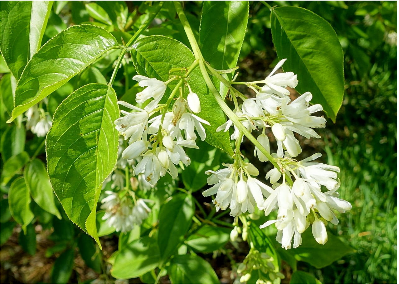
Kolchische Pimpernuss • Staphylea colchica

Die Kolchische Pimpernuss ist eine wunderschöne und robuste Pflanze, die in jedem Garten einen Blickfang darstellt. Die mehrjährige Pflanze ist einfach zu pflegen und wächst sowohl in der Sonne als auch im Halbschatten. Ihre großen, dunkelgrünen Blätter bilden einen dichten Busch, der im Sommer von vielen kleinen, weißen Blüten überragt wird. Im Herbst zieren dann rote Beeren die Pflanze, die nicht nur schön anzusehen sind, sondern auch ein tolles Futter für Vögel darstellen. Besonders hervorzuheben ist die Winterhärte der Kolchischen Pimpernuss, die auch bei frostigen Temperaturen nicht ihre Robustheit und Schönheit verliert. Sie eignet sich gut als Solitärpflanze oder auch als attraktive Heckenpflanze. Wer sich für diese Pflanze entscheidet, erhält einen pflegeleichten, immergrünen Blickfang für seinen Garten.