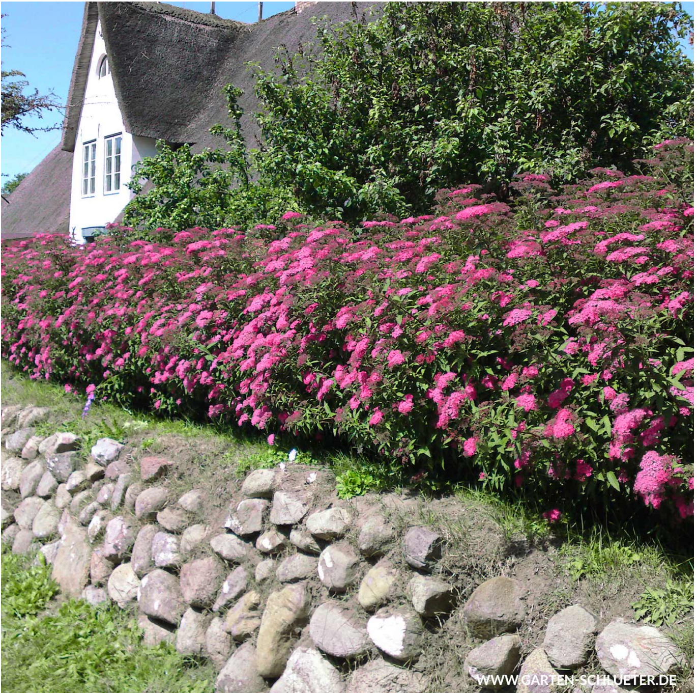
Sommerspiere 'Neon Flash' 3 Liter Container, 30 - 40 cm Liefergröße: 30 - 40 cm - Spiraea japonica 'Neon Flash'

Diese strahlende Schönheit (Spiraea japonica 'Neon Flash') verzückt uns gleich mit mehreren positiven Eigenschaften. Während das Laub sehr gesund, frisch grün und im Austrieb leicht burgunderrot behaucht ist, leuchten die großen Tellerblüten pink und sind in großer Anzahl vorzufinden. Desweiteren ist die Pflanze winterhart, mit einem gleichmäßigen Wuchs und wunderbar schnittverträglich. Da sie auch buschig wächst und bis zu 1 Meter hoch wird, kann man diese Pflanze gut als Heckenpflanze verwenden. Die Sommerspiere verträgt Standorte von sonnig bis halbschattig und benötigt einen lockeren, durchlässigen Boden.