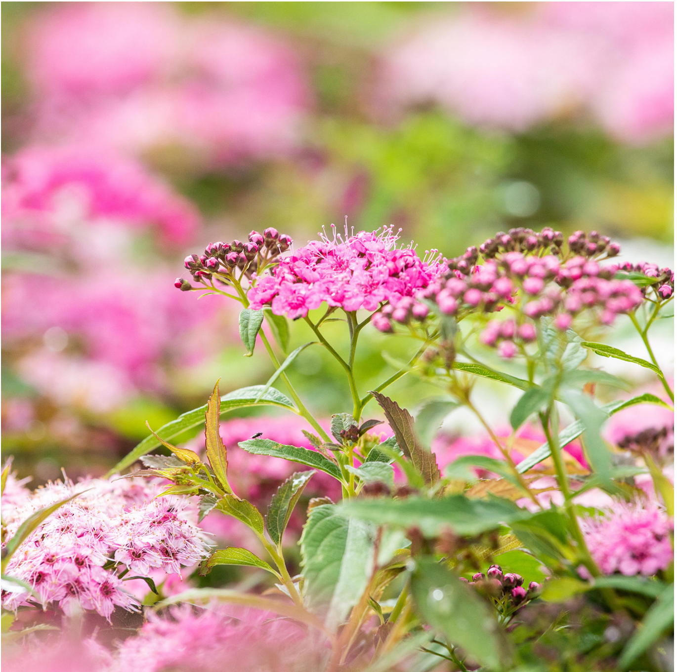
Zwerg-Spiere 'Little Princess', 0,5 Liter, 10 - 15 cm Liefergröße: 10 - 15 cm - Spiraea japonica 'Little Princess'

Lebendige Farbenpracht: Zwergspiere 'Little Princess' Entdecken Sie die charmante Zwergspiere 'Little Princess', eine pflegeleichte und attraktive Pflanze, perfekt für die Gestaltung von Beeten, Rabatten und als niedrige Zierpflanze. Mit ihren strahlenden rosa Blüten bringt sie lebendige Farbe und Freude in jeden Garten. Anmutige rosa Blüten und kompakte Form Die 'Little Princess' ist bekannt für ihre üppigen, rosa Blüten, die im Frühling und Sommer erscheinen und einen wunderbaren Farbakzent setzen. Ihre kompakte und buschige Wuchsform macht sie zu einer idealen Wahl für kleinere Gärten oder als Teil einer gemischten Rabatte. Pflege und Standort Diese Zwergspiere bevorzugt sonnige bis halbschattige Standorte und kommt mit den meisten Bodentypen gut zurecht. Sie ist pflegeleicht und benötigt nur wenig Aufwand, um ihre volle Schönheit zu entfalten. Standort: Sonnig bis halbschattig, anpassungsfähig an verschiedene Bodenarten. Wasser: Mäßiges Gießen, verträgt Trockenheit gut. Pflege: Geringer Pflegeaufwand, ideal für pflegeleichte Gärten. Vielseitige Einsatzmöglichkeiten Die Zwergspiere 'Little Princess' bietet vielfältige Einsatzmöglichkeiten im Garten: Ideal für die Gestaltung von farnefrohen Beeten und Rabatten. Perfekt als niedrige Zierpflanze in Steingärten oder entlang von Gartenwegen. Eine hervorragende Wahl für die Schaffung von lebendigen und charmanten Gartenbereichen. Fazit Die