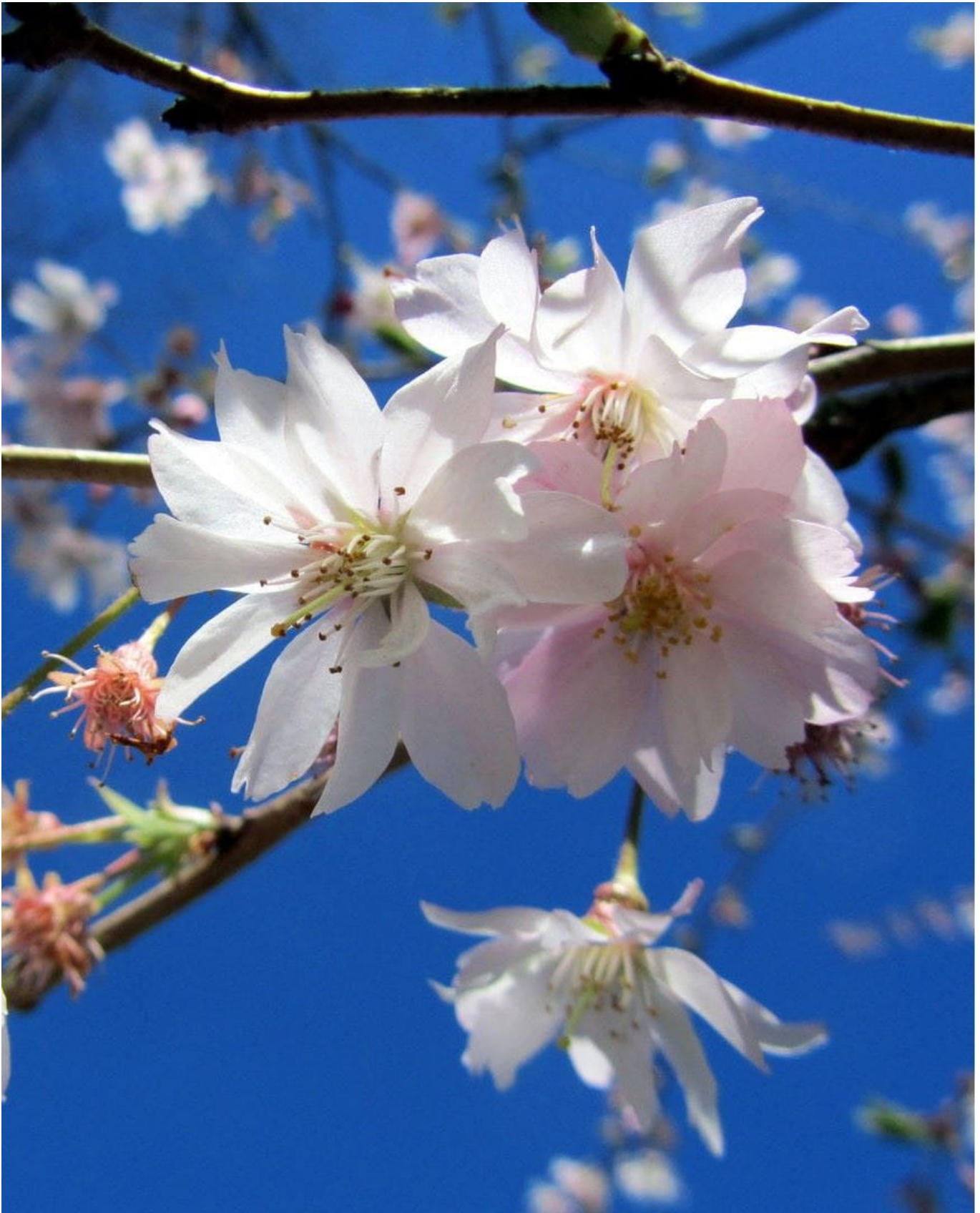
Rosa Winterkirsche 'Autumnalis Rosea' • Prunus subhirtella 'Autumnalis Rosea'