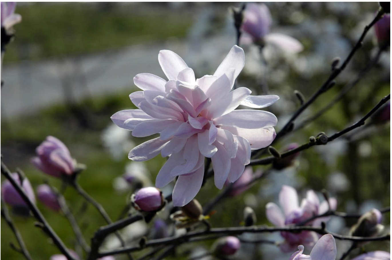
Rosa Sternmagnolie • Magnolia stellata 'Rosea'

Der Wuchs dieses reich blühenden Gehölzes ist eher einförmig und stark verästelt. Die Sternmagnolie wächst sehr langsam und wird nur 2-3 Meter hoch und eignet sich daher auch für kleine Gärten. Mit zunehmendem Alter wird die Sternmagnolie immer schöner und entwickelt ihre charakteristische Form. Ihre pelzigen Knospen öffnen sich im April und entfalten dann einen richtigen Sternenzauber. Die Sternmagnolie braucht einen sonnigen bis halbschattigen Standort, denn sonst bildet sie nur sehr spärlich Blüten aus.