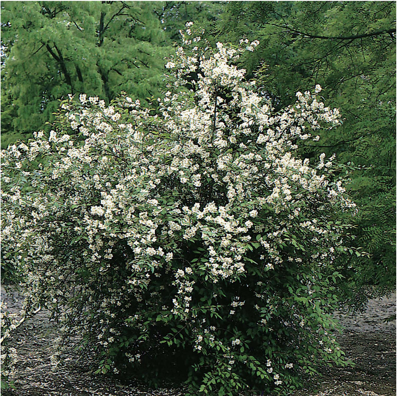
Duftender Bauernjasmin - Pfeifenstrauch, 3 - 5 Liter, 60 - 80 cm Liefergröße: 60 - 80 cm - Philadelphus coronarius

Eine Wohltat für Augen und Nase! Unser Duftender Bauernjasmin, auch als Pfeifenstrauch, Falscher Jasmin, Sommerjasmin oder Duftjasmin bezeichnet, ist eine einzige Augenweide. Der Name leitet sich übrigens vom persischen Wort Yasaman ab und bedeutet "die Blume". Und die Blüten verkörpern auch wirklich das klassische Bild einer Blume. Ganz einfach gehalten mit vier reinweißen Blütenblättern und kleinen, gelben Staubgefäßen in der Mitte. Fertig ist das kleine Wunder, das aufgrund seiner Schlichtheit jedoch nichts an Reiz einbüßt! Das markanteste Merkmal ist jedoch der starke unwiderstehlich süße Duft, der dank dem Pfeifenstrauch von Mai bis Juni durch den Garten zieht. Philadelphus coronarius gedeiht auf sonnigen bis halbschattigen Standorten mit normalem Gartenboden. Dankbar ist der ansonsten anspruchslose Strauch für eine gute Wasserversorgung. Das dunkelgrüne Laub ist oval-lanzettlich und matt. Duftender Bauernjasmin ist sehr schnittverträglich. Einzelne Triebe werden am besten direkt nach dem Verblühen bis zur nächsten starken Verzweigung rückgeschnitten. Unten kahle Äste werden bodennah entfernt. Ohne Schnitt erreicht er Höhen bis 3 m. Er wächst locker aufrecht und buschig. Längere Zweige sind leicht überhängend. Der Pfeifenstrauch ist ein wunderschöner Zierstrauch und zählt nicht umsonst zu den beliebtesten Gartengehölzen. Er schmeichelt Augen und Nase und kann