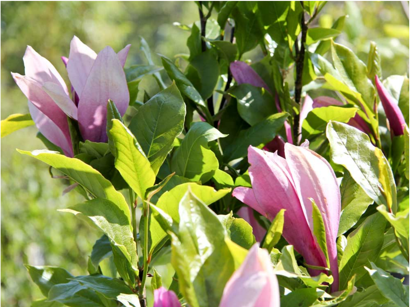
Purpur-Magnolie 'Susan' • Magnolia liliiflora 'Susan'