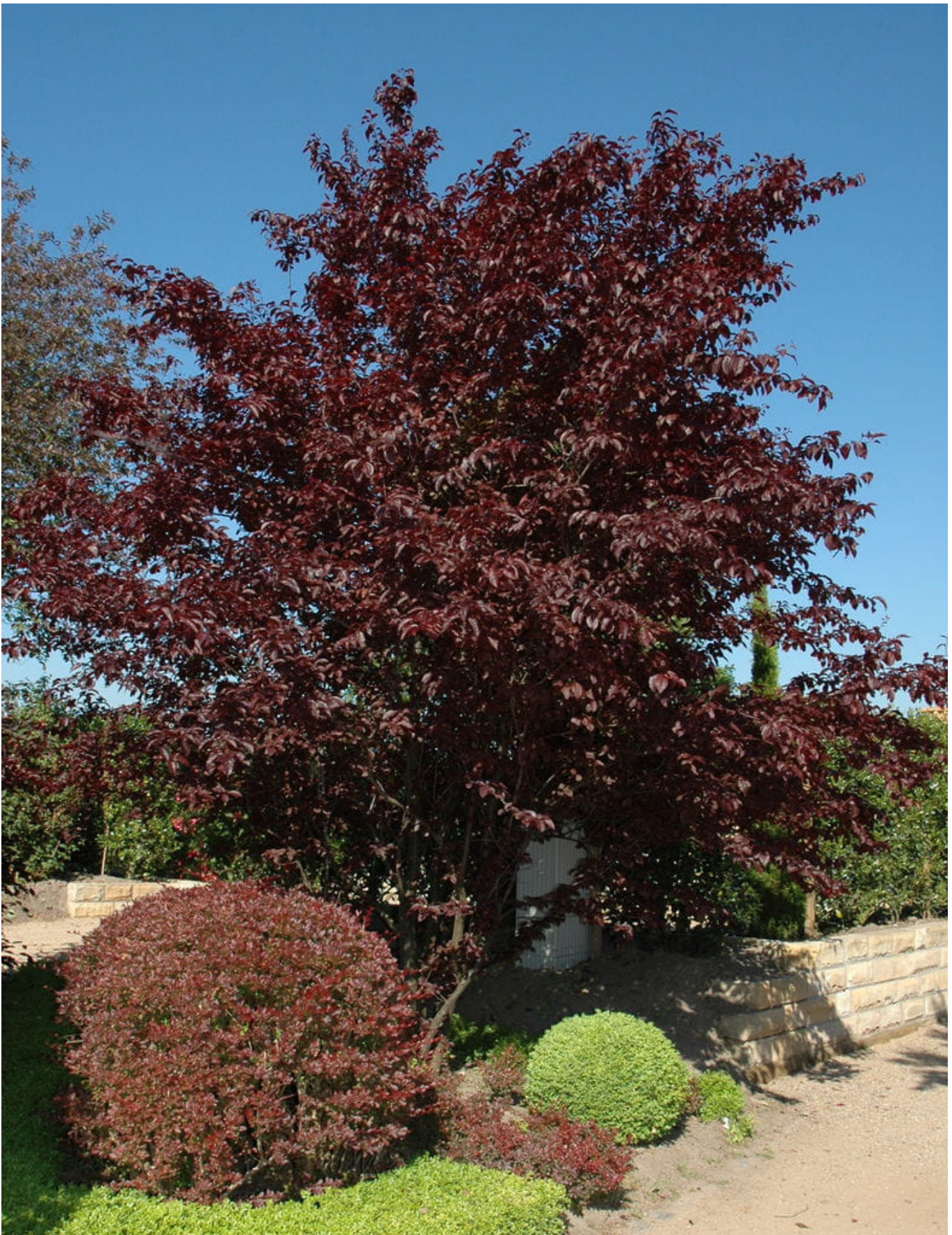
Blutpflaume • Prunus cerasifera Nigra