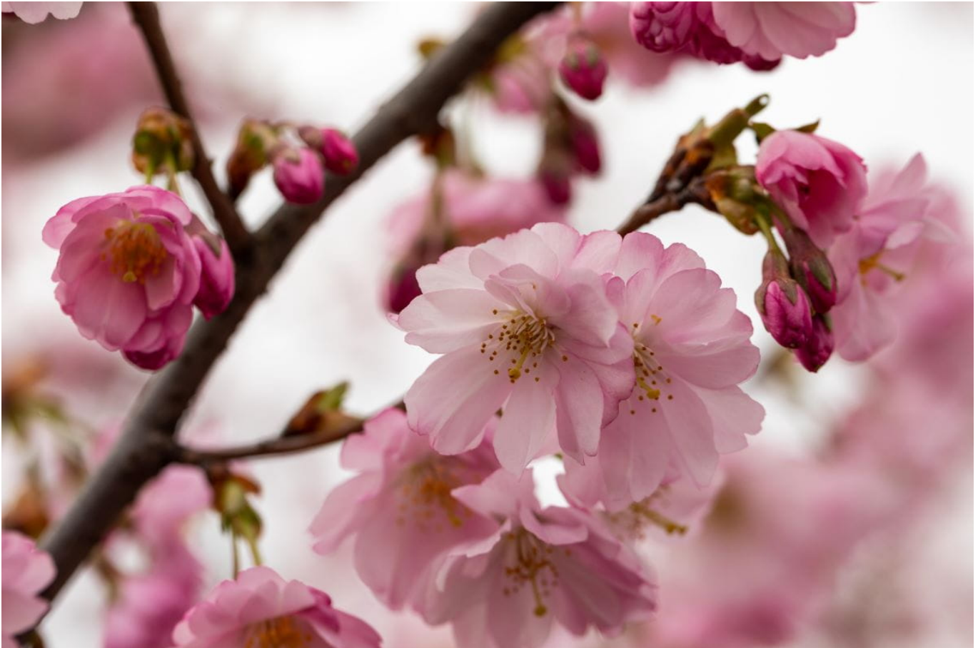
Frühe Zierkirsche 'Accolade' • Prunus subhirtella 'Accolade'

Mit einem Prunus holt man sich immer viel Freude in den Garten. Die genaue Übersetzung des lateinischen Namens bedeutet Pflaumenbaum. Doch zu dem Rosengewächs zählen dutzende von Bäumen und Sträuchern, von denen viele in Weiß oder zartem Rosa erblühen. Vor allem Steinobstsorten gehören dazu, neben den Pflaumen z. B. Kirschen und Pfirsiche. Auch die beliebten Schmuckpflanzen wie Zierkirschen und Mandelbäumchen sind hier zu finden. Schlehen und Kirschlorbeer nicht zu vergessen.