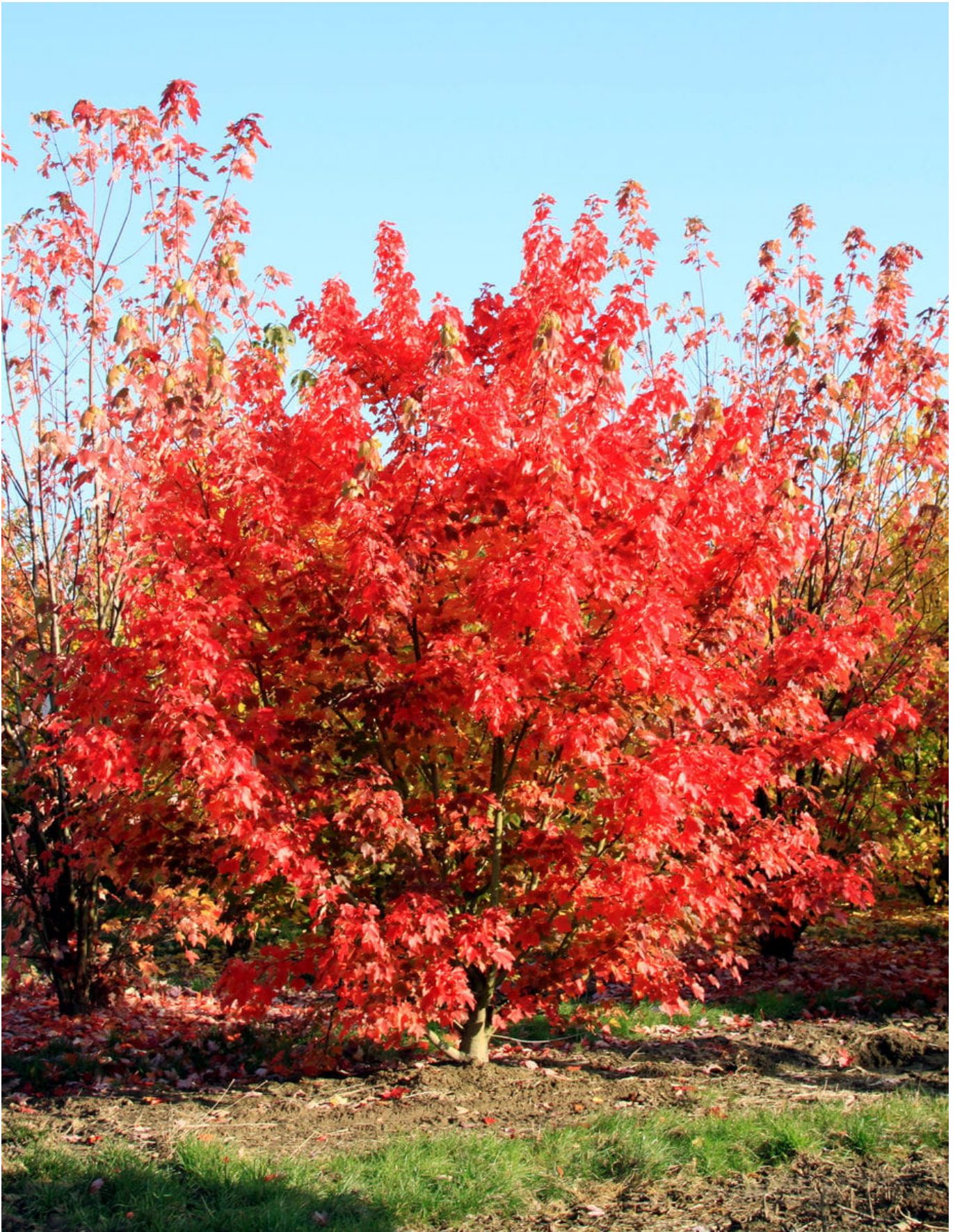
Rotahorn 'October Glory' • Acer rubrum 'October Glory'