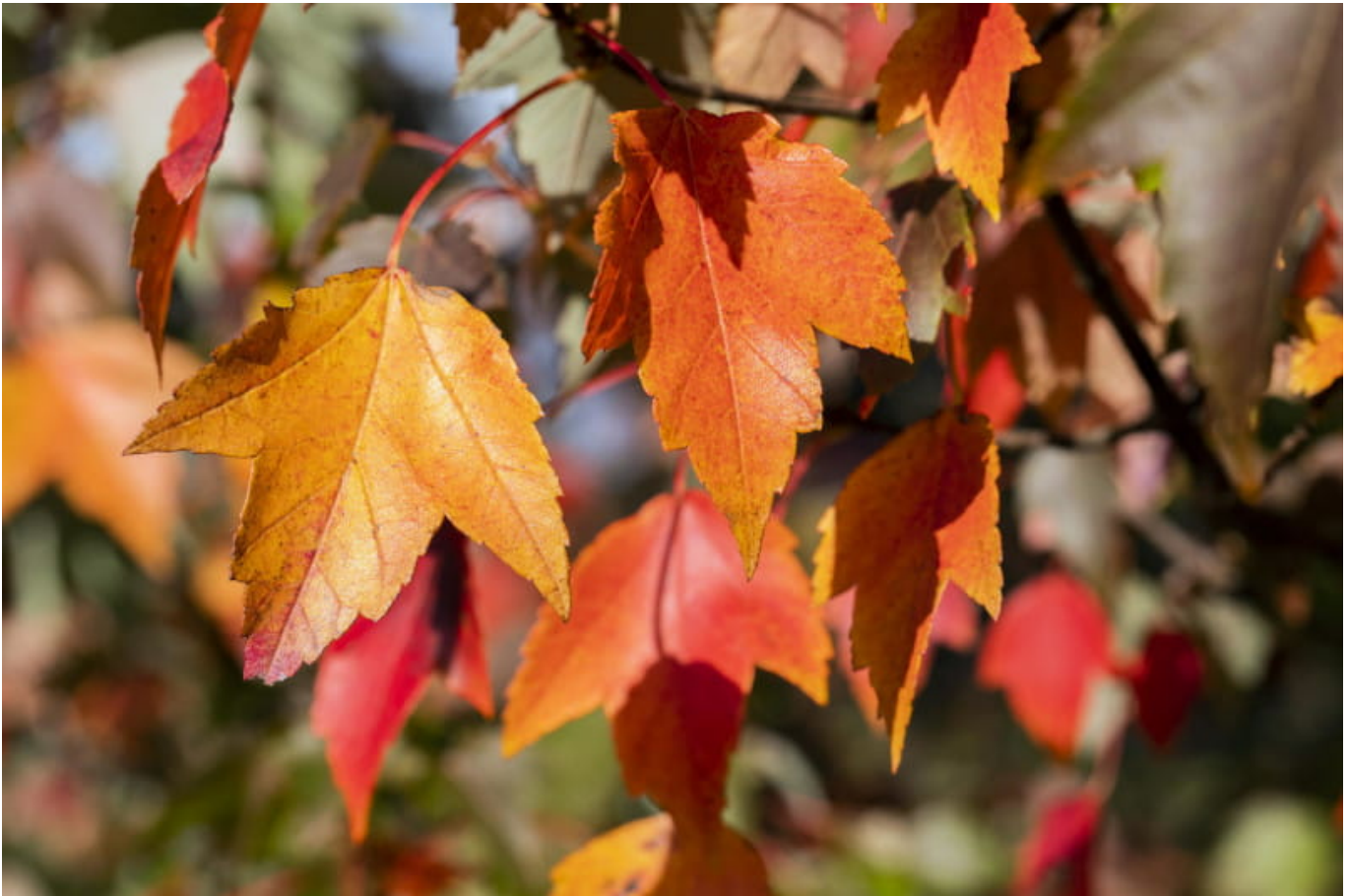
Rotahorn 'Sun Valley' • Acer rubrum 'Sun Valley'

Die Rotahorn 'Sun Valley' ist eine wunderschöne Zierpflanze mit einem kompakten, rundlichen Wuchs. Die Blätter dieser Pflanze leuchten in einem satten Rot und sind fein gelappt, was der Pflanze ein elegantes und strukturiertes Aussehen verleiht. Im Herbst färben sich die Blätter noch intensiver und werden zu einem leuchtenden Orange. Die Rotahorn 'Sun Valley' kann in jedem Garten angepflanzt werden und eignet sich besonders gut als Solitärpflanze oder als Teil eines Blumenbeets. Diese Pflanze ist sehr robust und benötigt nur wenig Pflege. Sie ist tolerant gegenüber verschiedenen Bodentypen und hat eine hohe Widerstandskraft gegen Krankheiten. Wenn Sie nach einem auffälligen und einfach zu pflegenden Ziergehölz suchen, dann ist die Rotahorn 'Sun Valley' die perfekte Wahl.