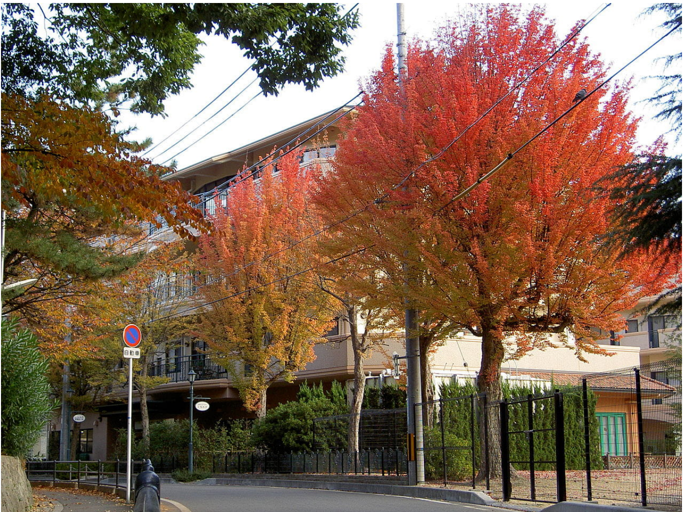
Dreispitz-Ahorn • Acer buergerianum

Seinen Ursprung hat der Dreispitz-Ahorn in Ostasien. In China und Japan ist er beheimatet. Die charakteristische, dreigeklappte Blattform des Dreispitz-Ahorn verleiht jedem Garten einen Hauch von Extravaganz. Indian Summer im Garten zaubert der Dreispitz-Ahorn durch seine intensiv leuchtende Herbstfärbung aus gelborange bis zu feuerroten Farbtönen.