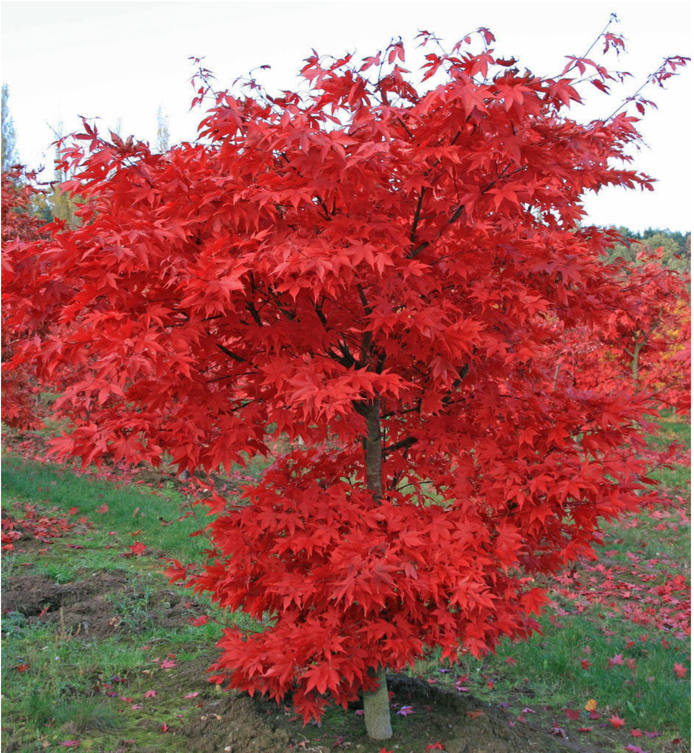
Fächerahorn 'Osakazuki' • Acer palmatum 'Osakazuki'

Die charakteristische, tiefgelappte Blattform von Ahornbäumen verleiht jedem Garten einen Hauch von Extravaganz. In die Art Acer palmatum reihen sich zahlreiche Sorten, die mit strauchartigen Wuchshöhen oder ungewöhnlichen Blattfärbungen locken. Eine Bereicherung für jeden Garten, der zum Träumen und Verweilen einladen will!