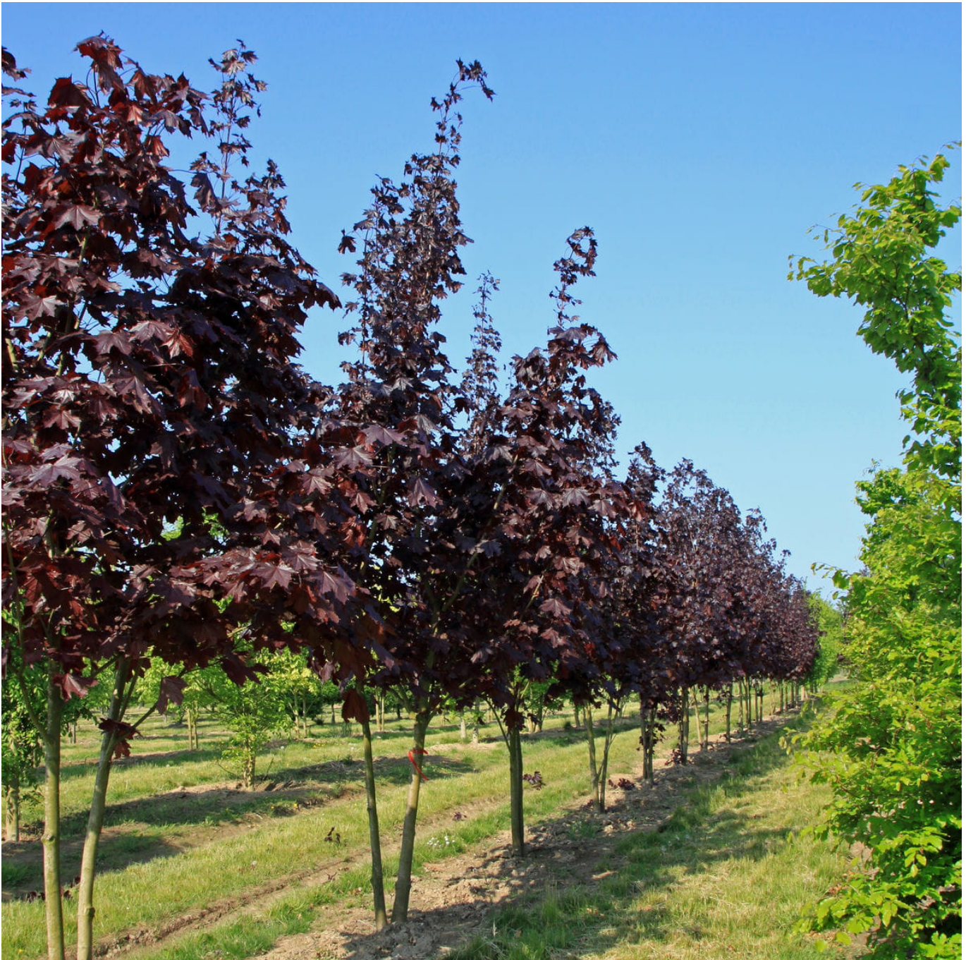
Blutahorn 'Royal Red' • Acer platanoides 'Royal Red'

Der Spitzahorn wächst in rundlicher Form und besticht schon durch sein farbintensives Grün. Sein Blütenstand ist weithin sichtbar, denn er strahlt in zitronengelber Farbenpracht. Da er über 20 Meter hoch wird, entwickelt er sich im Laufe der Zeit immer mehr zu einem Highlight mit einem Hauch von fernöstlichem Flair. Als alleinstehendes Gehölz, das sowohl die Sonne wie den Halbschatten mag, zieht er alle Blicke auf sich.