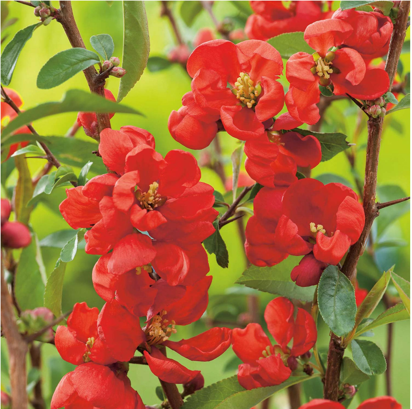
Zierquitte 'Andenken an Carl Ramcke' Liefergröße: 40 - 60 cm - Chaenomeles 'Andenken an Carl Ramcke'

Zierquitte 'Andenken an Carl Ramcke': Ein lebendiges Denkmal der Natur Die Zierquitte 'Andenken an Carl Ramcke' ehrt mit ihrer Pracht und Robustheit das Andenken an eine bedeutende Persönlichkeit. Mit