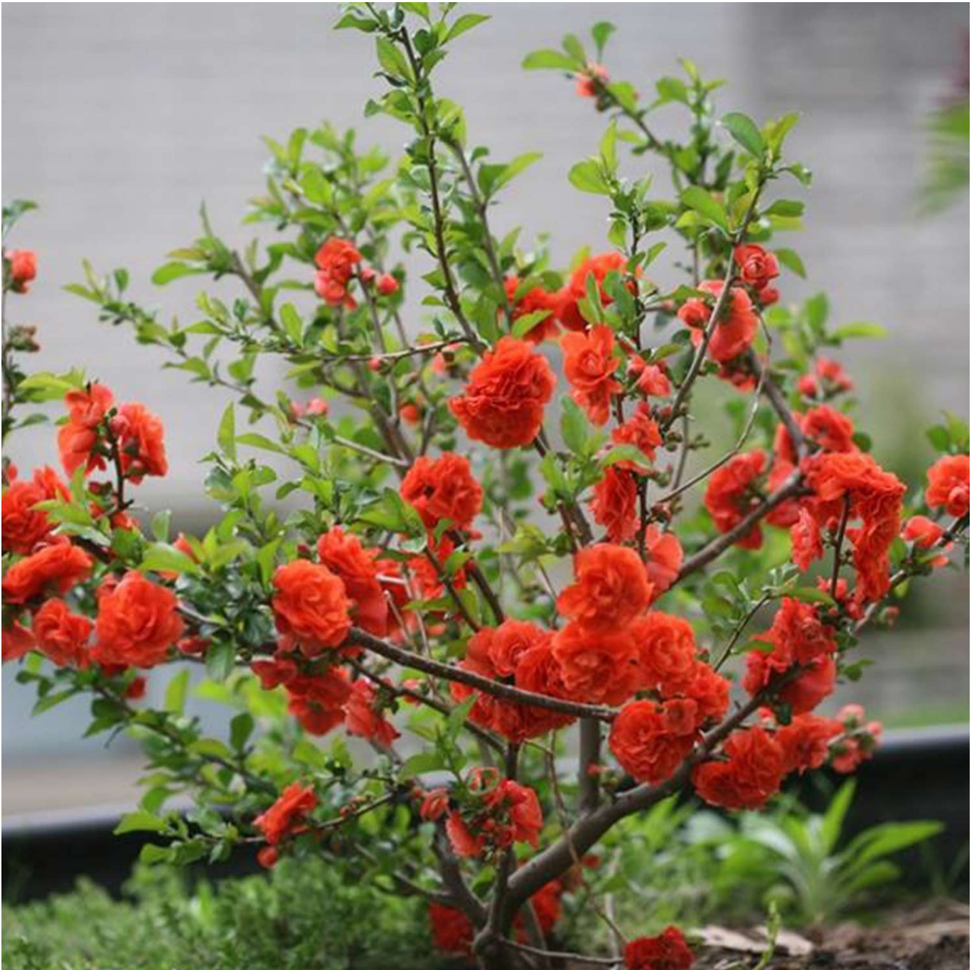
Gefüllte Zierquitten 'Orange Storm' 3 Liter Container, 40 - 60 cm Liefergröße: 40 - 60 cm - Chaenomeles speciosa 'Orange Storm®'

Zierquitten 'Orange Storm': Ein Frühlingshighlight in leuchtendem Orange Die Zierquitten 'Orange Storm' erfreut Gartenliebhaber mit ihrer frühen Blütezeit und den auffälligen, gefüllten Blüten in einem kräftigen Orange. Diese Sorte vereint Schönheit mit Robustheit und ist dabei ausgesprochen anspruchslos und pflegeleicht. Ideal für jeden, der seinen Garten mit wenig Aufwand in ein farbenfrohes Blütenmeer verwandeln möchte. Eigenschaften der Zierquitten 'Orange Storm' Frühe Blütezeit: Schon im Frühjahr verwandelt die 'Orange Storm' Gärten und Terrassen in ein leuchtendes Orange. Kräftig orange, gefüllte Blüten: Die Blüten dieser Sorte sind nicht nur farbtintensiv, sondern auch gefüllt, was ihnen ein besonders üppiges Erscheinungsbild verleiht. Anspruchslos und pflegeleicht: Die Zierquitten 'Orange Storm' stellt geringe Ansprüche an ihren Standort und ist leicht zu pflegen. Perfekt für den Vasenschnitt: Die stabilen Zweige und die haltbaren Blüten eignen sich hervorragend für frühlingshafte Arrangements in der Vase. Pflegethinweise für die Zierquitten 'Orange Storm' Trotz ihrer Anspruchslosigkeit freut sich die 'Orange Storm' über einen sonnigen bis halbschattigen Standort und einen gut durchlässigen, nährstoffreichen Boden. Staunässe sollte vermieden werden, um das Wohlergehen der Pflanze zu sichern. Ein leichter Rückschnitt nach der Blüte fördert einen kompakten Wuchs und eine reiche