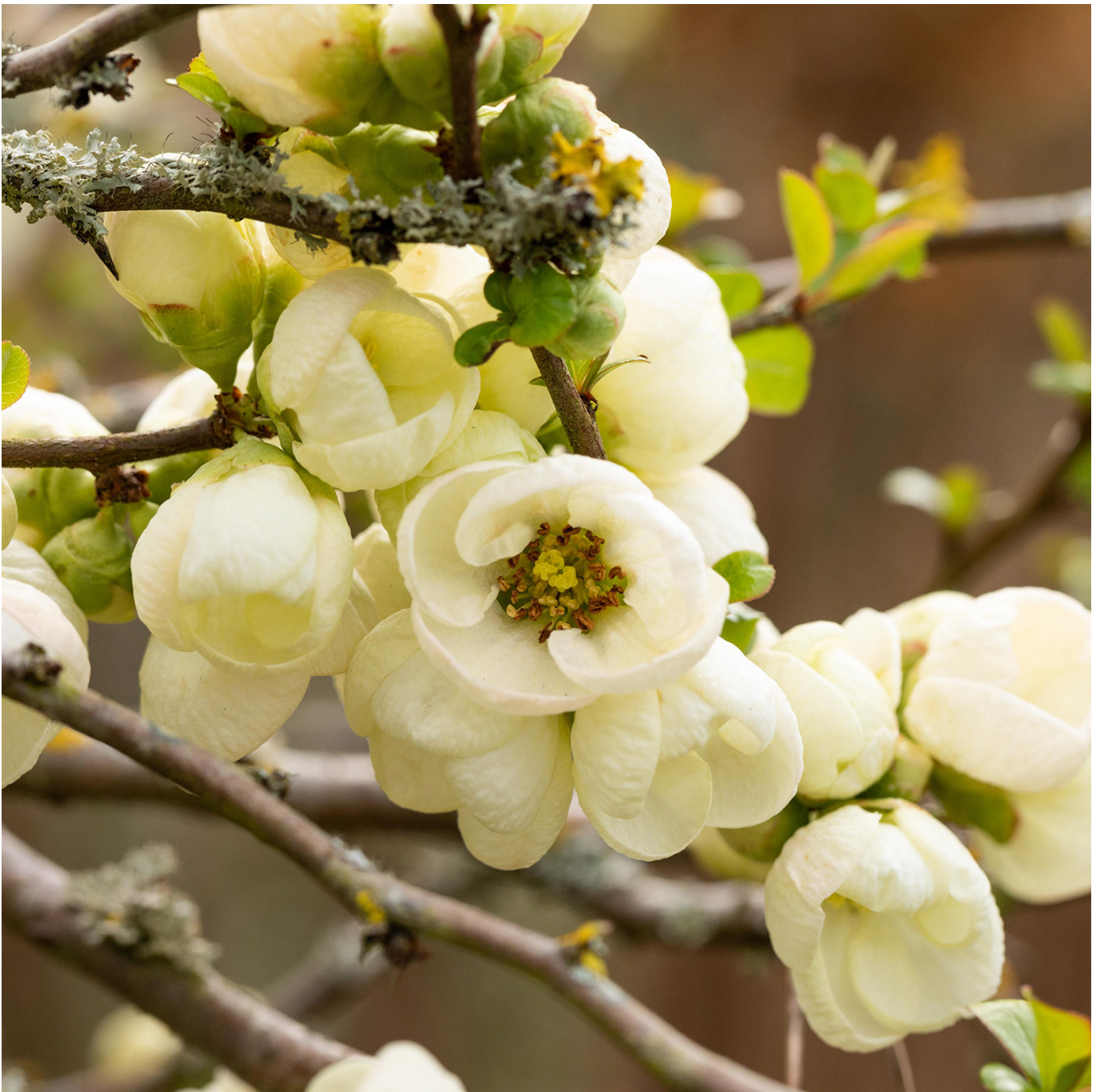
Zierquitte 'Jet Trail' Liefergröße: 30 - 40 cm - Chaenomeles 'Jet Trail'

Strahlende Eleganz: Zierquitte 'Jet Trail' Die Zierquitte 'Jet Trail' ( Chaenomeles x superba 'Jet Trail') ist eine herausragende Zierpflanze, die mit ihren reinweißen Blüten jeden Garten im Frühjahr in ein Blütenmeer verwandelt. Im Gegensatz zu ihren farbenprächtigen Verwandten besticht 'Jet Trail' durch ihre schlichte Eleganz und ihre leuchtenden weißen Blüten, die an den noch kahlen Zweigen erscheinen und somit einen spektakulären Anblick bieten. Diese Sorte ist nicht nur wegen ihrer Schönheit geschätzt, sondern auch für ihre Robustheit und Pflegeleichtigkeit, was sie zu einer idealen Wahl für Gartenbesitzer macht, die Wert auf unkomplizierte und dennoch eindrucksvolle Gartenpflanzen legen. Ein Frühlingshighlight mit weißer Blütenpracht! 'Jet Trail' blüht üppig in den frühen Frühlingsmonaten und bietet einen herrlichen Kontrast zu den grünen Blättern, die kurz nach der Blütezeit erscheinen. Die