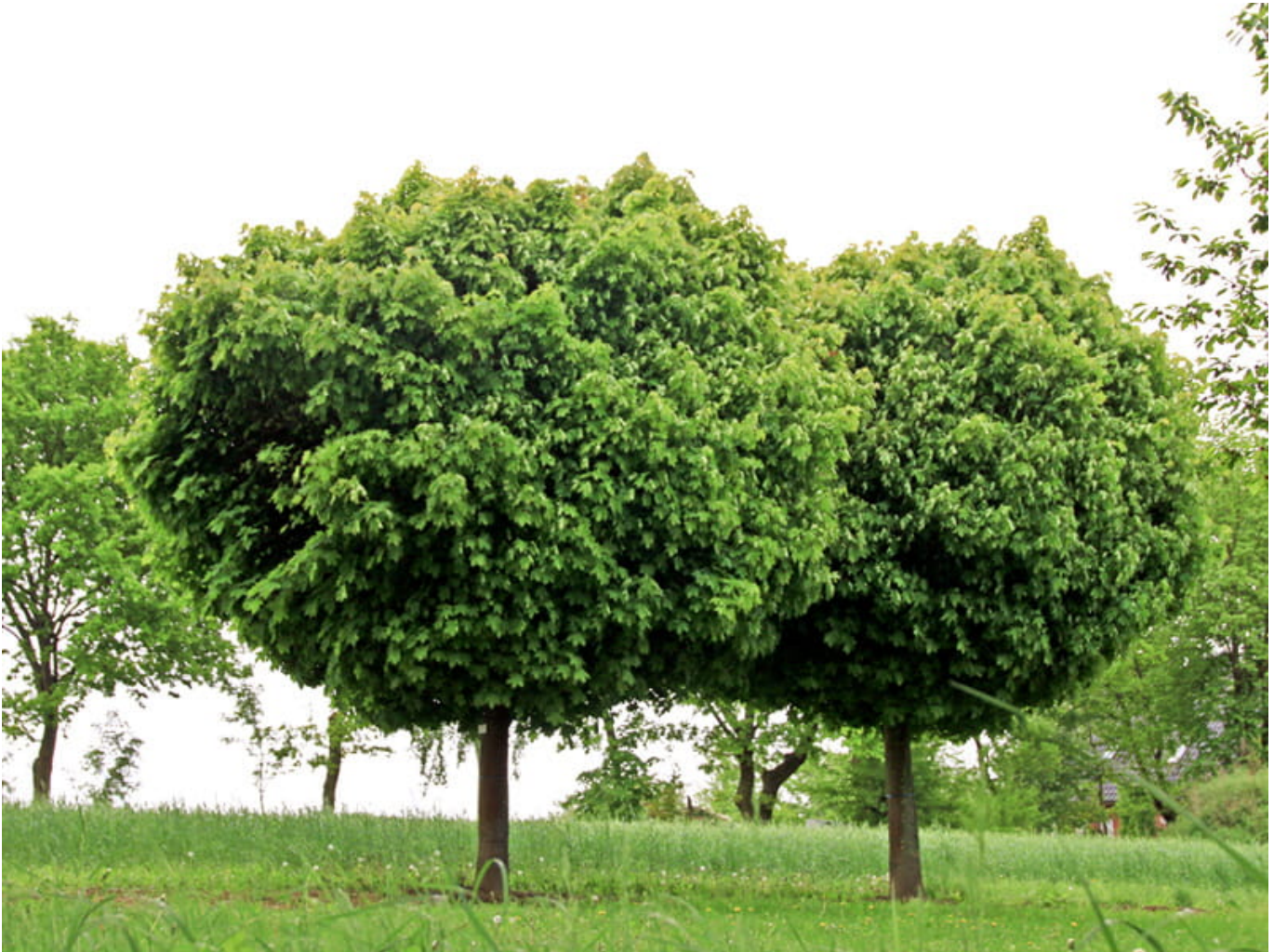
Kugelhorn 'Globosum' • Acer platanoides 'Globosum'