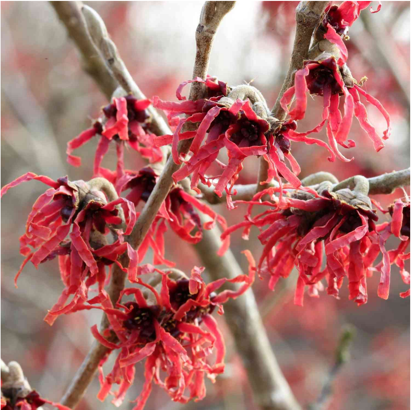
Zaubernuss 'Feuerzauber' C3-5 60 - 80 cm Liefergröße: 60 - 80 cm - Hamamelis intermedia 'Feuerzauber'

Die Zaubernuss 'Feuerzauber': Ein Winterhighlight mit betörendem DuftDie Zaubernuss 'Feuerzauber' bringt Farbe und Duft in die kalten Wintermonate. Von Januar bis März öffnen sich ihre farbenprächtigen Blüten und verströmen einen starken, süßlich angenehmen Duft, der intensiver ist als bei der Sorte 'Ruby Glow'. Die Blütenkelche zeigen sich in einem tiefen Granatrot bis Violettbraun, während die Blütenblätter in einem leuchtenden Weinrot erstrahlen, das zur Spitze hin aufhellt. Dieser außergewöhnliche Strauch wächst breit aufrecht und dichttrieblich, erreicht eine Höhe von 3 bis 4 Metern und beeindruckt durch seine starke Wuchsleistung. In den ersten 3 bis 4 Jahren zeigt 'Feuerzauber' kaum Zuwachs, doch mit Geduld wird dieser Zaubernussstrauch zu einem majestätischen Blickfang in jedem Garten. Ein Schnitt sollte vermieden oder nur selten durchgeführt werden, um die natürliche Schönheit und Wuchsform der Pflanze zu erhalten. Pflege und Standort'Feuerzauber' ist winterhart und übersteht auch kalte Winter problemlos. Für eine optimale Entwicklung bevorzugt diese Zaubernuss einen sonnigen bis halbschattigen Standort. Der Boden sollte gut durchlässig und humos sein, um Staunässe zu vermeiden und die Gesundheit der Pflanze zu fördern. BesonderheitenNeben ihrem intensiven Blütenduft und der spektakulären Farbgebung ist die Zaubernuss 'Feuerzauber' auch für ihre gelegentliche zweite Blüte im Herbst bekannt. Während dieser Zeit können gelbe Blüten an den Zweigen erscheinen und den