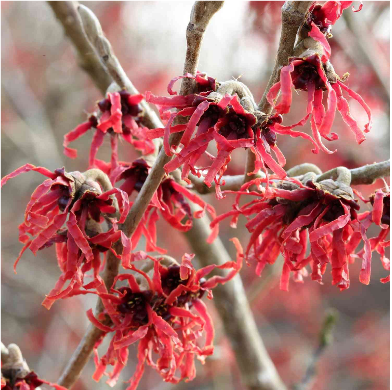
Zaubernuss 'Feuerzauber' C3-5 80 - 100 cm Liefergröße: 80 - 100 cm - Hamamelis intermedia 'Feuerzauber'

Die Zaubernuss 'Feuerzauber': Ein Winterhighlight mit betörendem Duft Die Zaubernuss 'Feuerzauber'