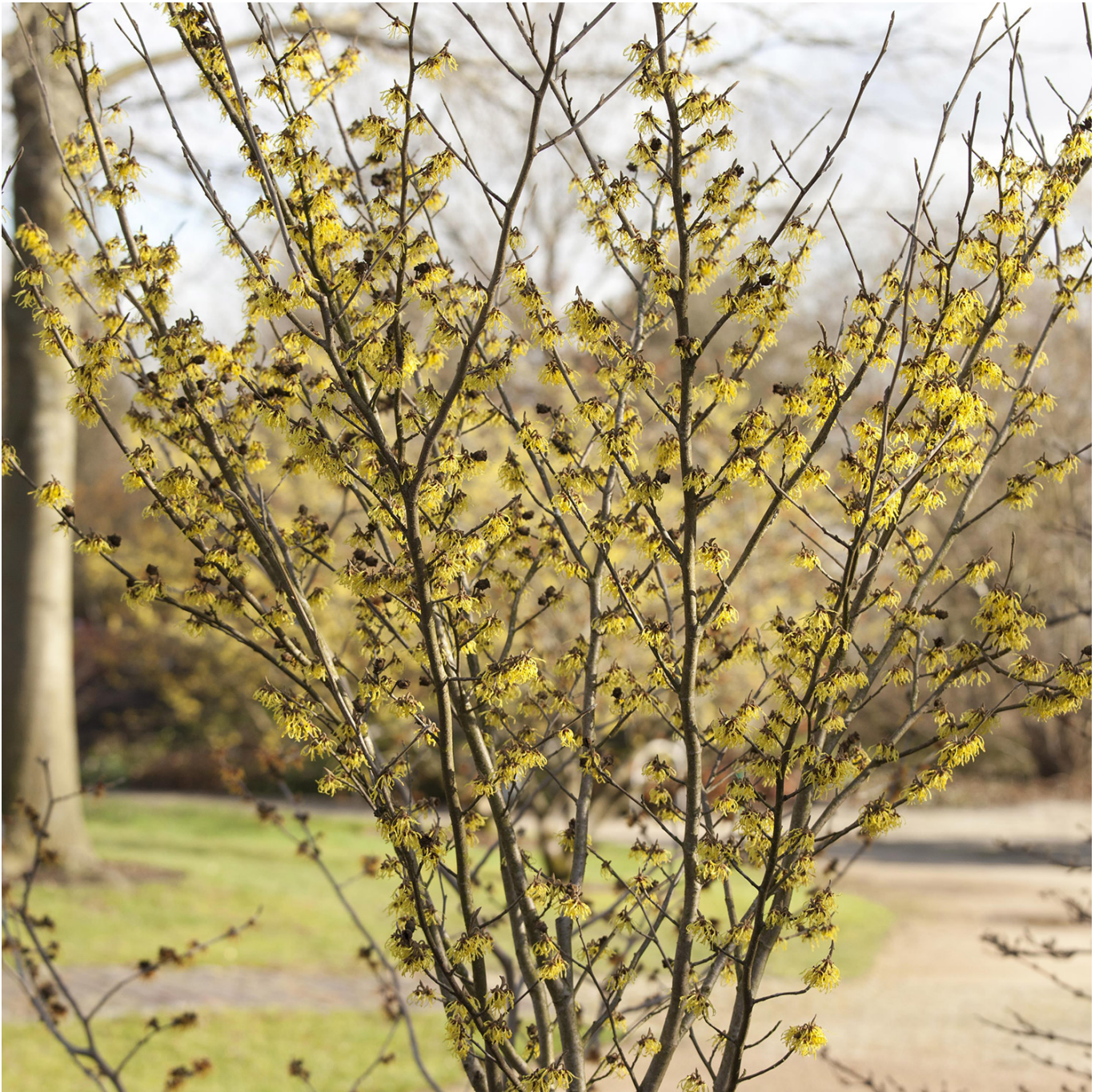
Zaubernuss 'Arnold Promise' 3 - 5 Liter, 60 - 80 cm Liefergröße: 60 - 80 cm - Hamamelis intermedia 'Arnold Promise'

Die Zaubernuss 'Arnold Promise': Farbenpracht in der kalten Jahreszeit Die Zaubernuss 'Arnold Promise' gehört zu den Highlights im winterlichen Garten. Als spät blühende Sorte der Hamamelis-Familie bringt 'Arnold Promise' ab Februar Farbe und Duft in die sonst ruhige Gartenlandschaft. Die leuchtend gelben, gekräuselten Petalen dieser ungewöhnlichen Blüten sind ein echter Blickfang und verbreiten einen leichten Duft, der bis in den März hinein anhält. Mit ihrer robusten Natur und der Fähigkeit, Schnee und Winterfrost zu trotzen, ist 'Arnold Promise' ein Muss für jeden Gartenliebhaber. Dieser gut verzweigte, eher gedrunken wirkende Strauch zeichnet sich durch sein langsames Wachstum und eine der schönsten Herbstfärbungen unter den Zaubernüssen aus. Die Blätter wandeln sich von einem kräftigen Grün in ein attraktives Gelb bis hin zu kräftigem Rot, bevor sie zum Winter hin abfallen. 'Arnold Promise' gedeiht am besten auf nährstoffreichen, lockeren und leicht sauren Böden und bevorzugt einen sonnigen bis halbschattigen, windgeschützten Standort. Pflege und Standort 'Arnold Promise' ist anspruchslos und bevorzugt nährstoffreiche, frische bis feuchte, sandig-humose bis sandig-lehmige Böden. Ein sonniger bis halbschattiger Standort unterstützt das optimale Wachstum dieser Pflanze. Um Staunässe zu vermeiden und die Pflanze in extrem trockenen Tagen zu unterstützen, ist eine angemessene