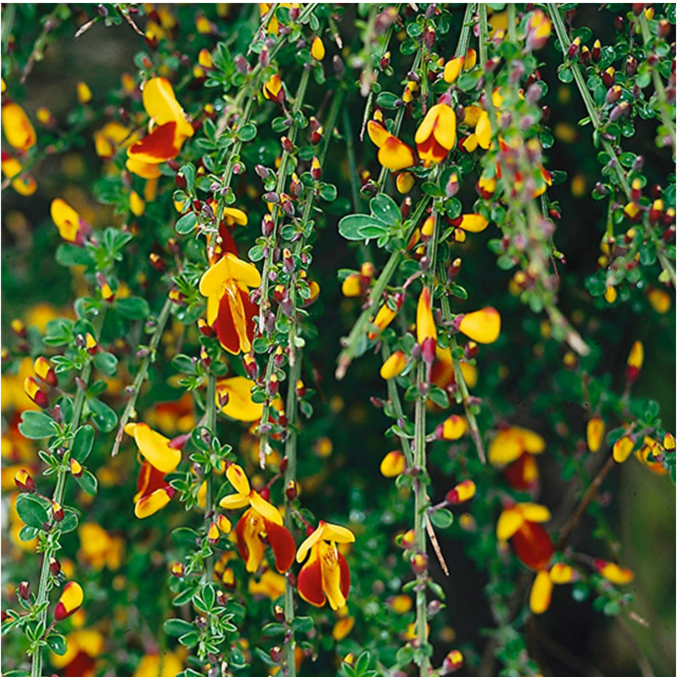
Edelginster 'Andreas Splendens' Liefergröße: 40-60 cm - Cytisus scoparius 'Andreas Splendens'

Überprüfe deshalb die Eigenschaften und die tagesaktuellen Preise im Onlineshop unserer Partner.)