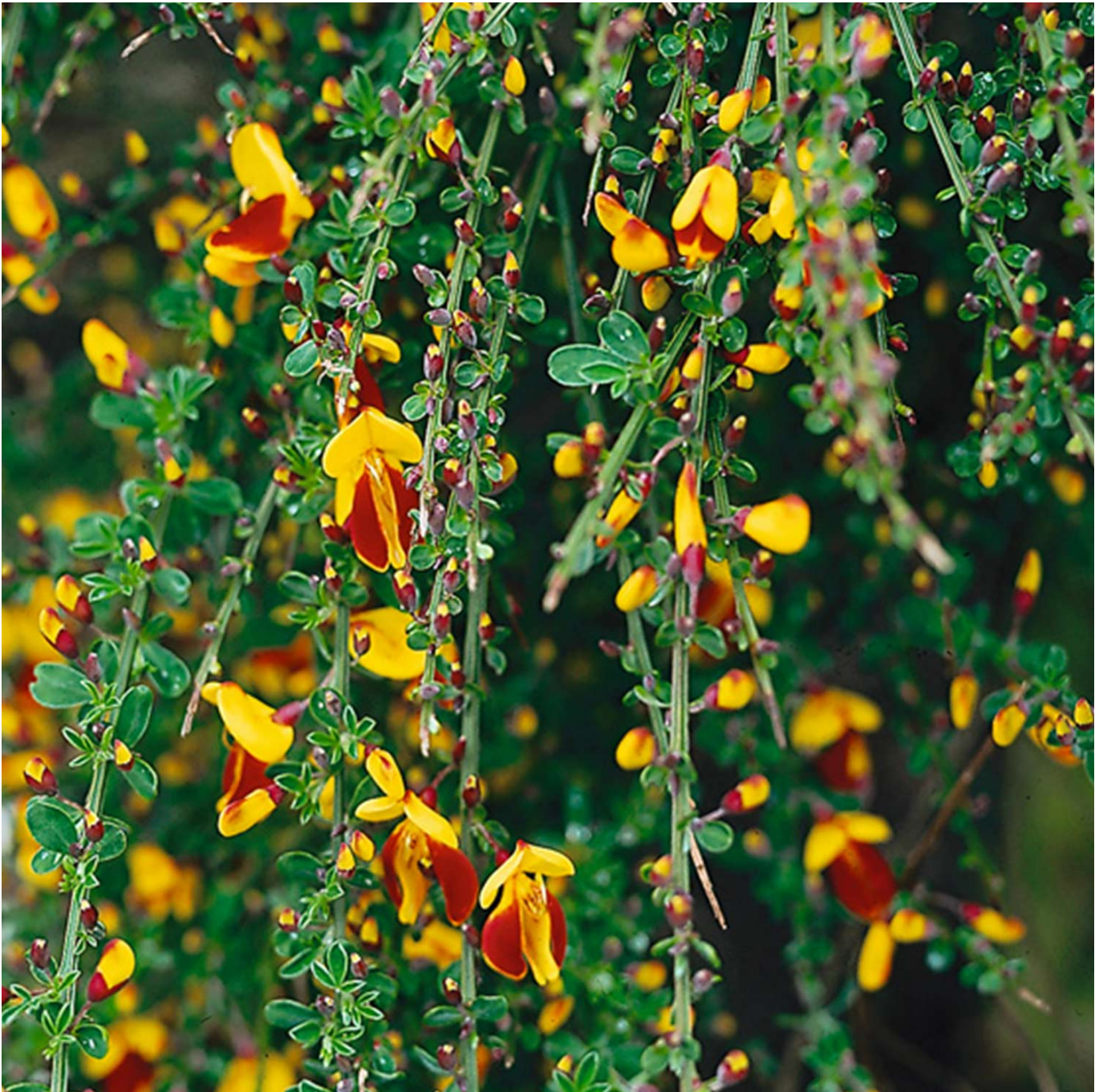
Edelginster 'Andreas Splendens' Liefergröße: 40-60 cm - Cytisus scoparius 'Andreas Splendens'

Der Edelginster "Andreas Splendens" ist eine der schönsten Ginstersorten und sehr beliebt. Die Blüten haben eine signalgelbe Fahne, umgeben von rotbraunen Flügeln, an dessen Rahmen man die gelbe Farbe aus der Fahne wiederentdeckt. Das Farbspiel, das sich durch diese Kombination ergibt, ist sehr sehenswert und zeigt sich von Mai bis Juni. Der Wuchs des Edelginsters "Andreas Splendens" ist breitbuschig und aufrecht, er wächst ca. 1,5 Meter in die Höhe und Breite.