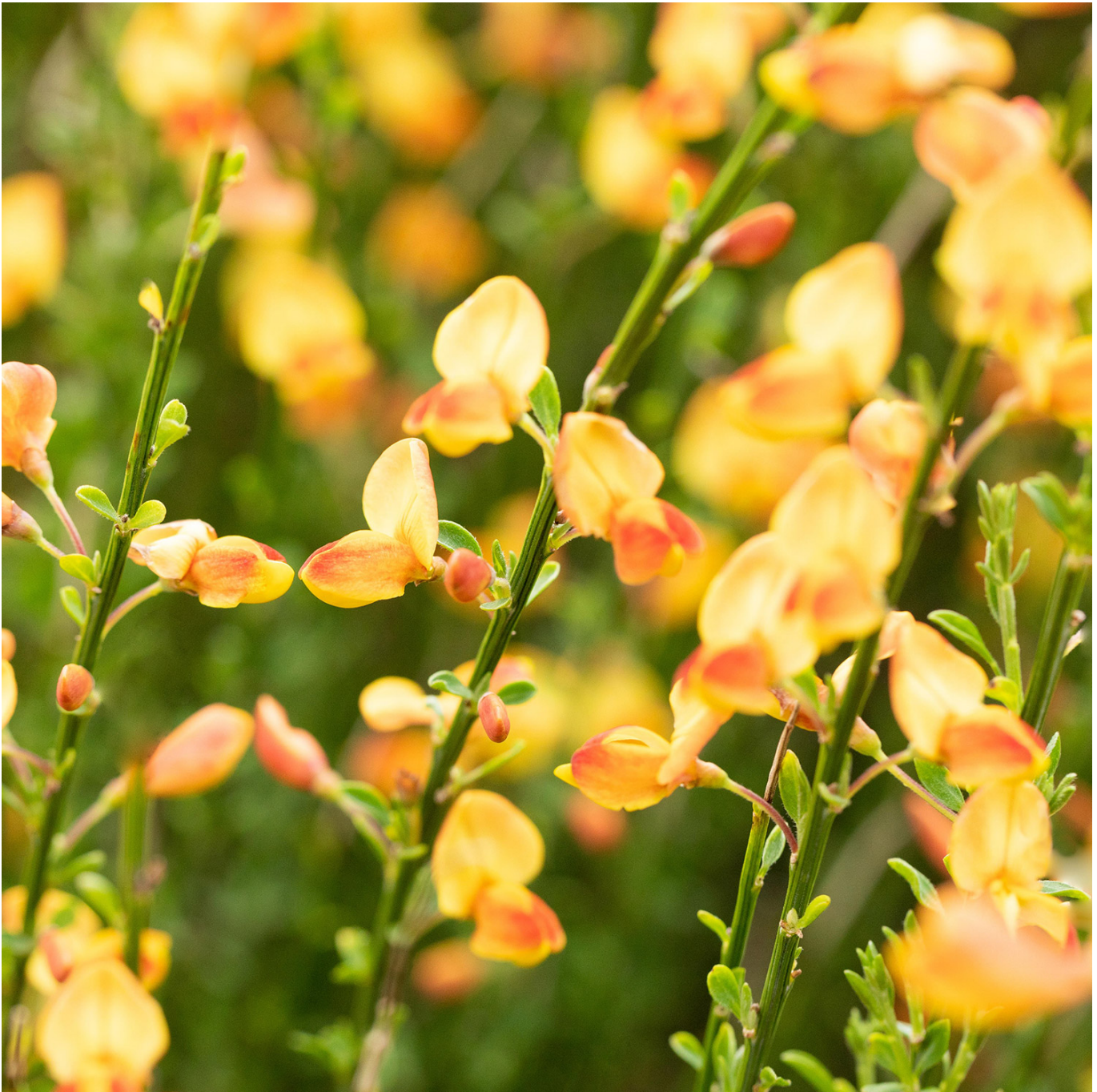
Elfenbeinginster 'Apricot Gem' Liefergröße: 40-60cm - Cytisus 'Apricot Gem'

Leuchtende Farbenpracht: Elfenbeinginster 'Apricot Gem' Der Elfenbeinginster 'Apricot Gem' ist ein wahres Juwel für jeden Garten. Mit seinen gelb-orangen, fast apricotfarbenen Blüten, die im Juni den Garten in ein warmes Licht tauchen, zieht er alle Blicke auf sich. Das dunkelgrüne Laub bildet einen wunderschönen Kontrast zu den leuchtenden Blüten und unterstreicht die Einzigartigkeit dieser Pflanze. Standort und Pflege Der Elfenbeinginster 'Apricot Gem' bevorzugt einen warmen, geschützten und sonnigen Standort. Er gedeiht am besten in trockenem, nährstoffarmem und humosem Boden, was ihn zu einer pflegeleichten Ergänzung für Beete und Rabatten macht. Obwohl der Ginster Schnittmaßnahmen schlecht verträgt und möglichst nicht geschnitten werden sollte, überzeugt er durch seine sehr gute Winterhärte und seine Beliebtheit bei Insekten. Standort: Sonnig und geschützt Boden: Trocken, nährstoffarm, humos Blütezeit: Juni, mit gelb-orangen bis apricotfarbenen Blüten Laub: Dunkelgrün, bietet einen starken Kontrast zu den Blüten Pflege: Schnitt schlecht verträglich, sehr gute Winterhärte Verwendung im Garten Als Blüthengehölz in Beeten und Rabatten bietet der Elfenbeinginster 'Apricot Gem' eine spektakuläre Farbgebung und zieht dank seiner Insektenfreundlichkeit eine Vielzahl von Nützlingen an. Seine anspruchslose Natur und sein geringer Pflegebedarf machen ihn zu einer idealen Wahl für Gartenliebhaber, die einzigartige Akzente setzen möchten. Fazit Der Elfenbeinginster