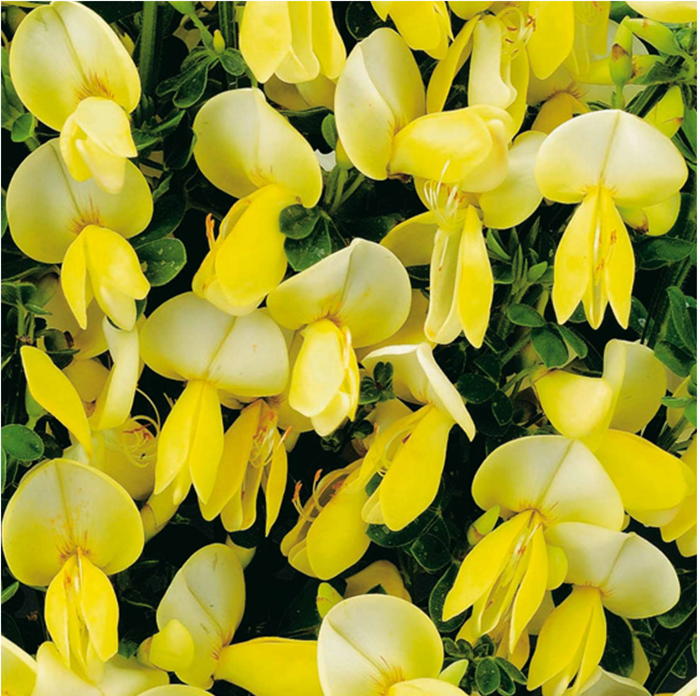
Edelginster 'Luna' Liefergröße: 40-60 cm - Cytisus scoparius 'Luna'

Der Edelginster 'Luna' – Ein leuchtendes Highlight im Garten Der Edelginster 'Luna' ist ein Blickfang in jedem Garten. Mit seinem aufrechten Wuchs und den vielen goldgelben Blüten, die von Mai bis Juni erscheinen, bringt er einen Hauch von Eleganz und Farbe in Ihre Außenbereiche. Der feine Duft der Blüten bereichert die Luft und macht die 'Luna' zu einem unverzichtbaren Bestandteil der Frühlings- und