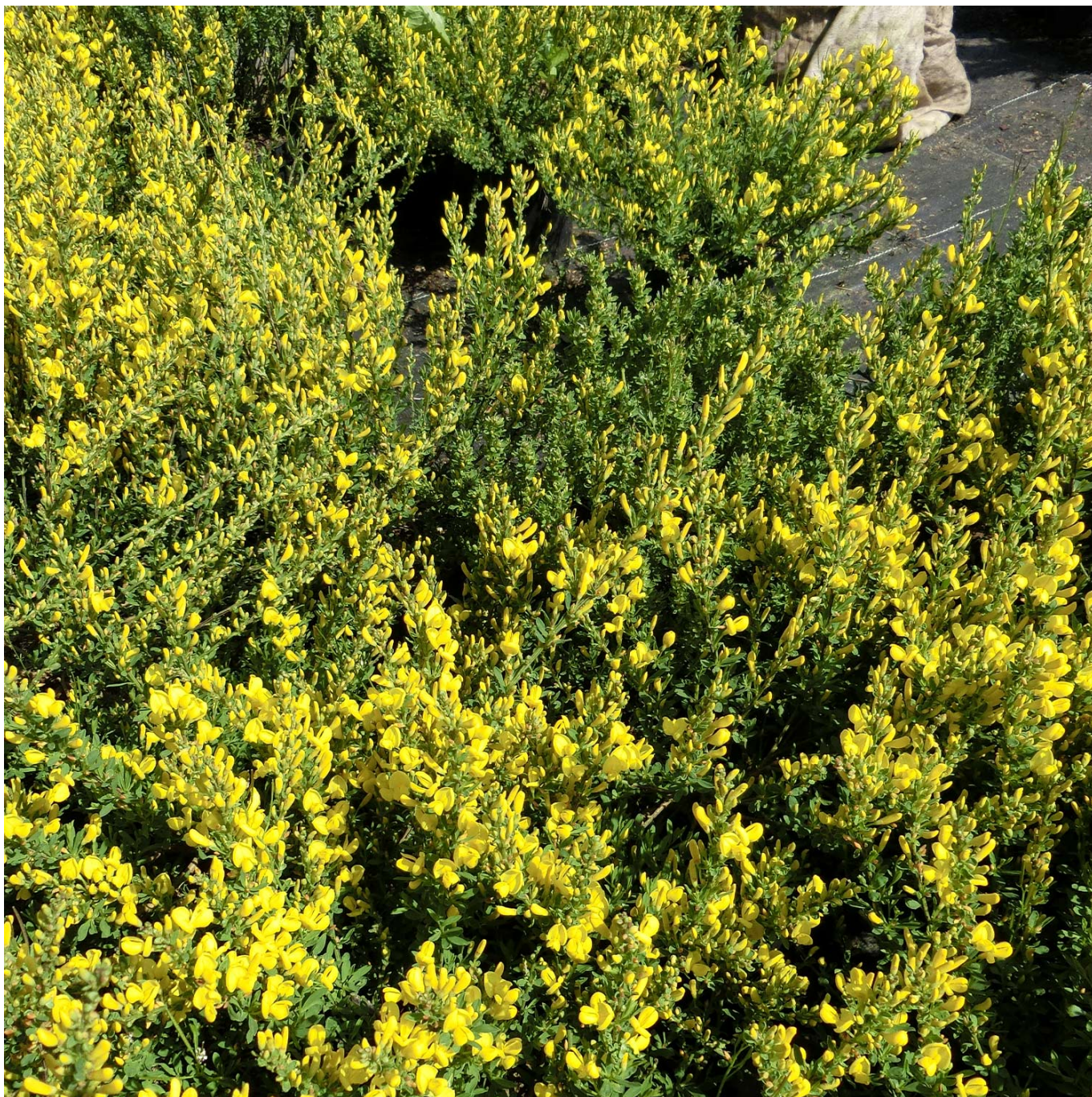
Edelginster 'Allgold' Liefergröße: 40-60 cm - Cytisus praecox 'Allgold'

Der Edelginster 'Allgold' - Ein goldener Frühlingsbote Der Edelginster 'Allgold' (botanisch: Cytisus praecox 'Allgold') ist eine spektakuläre Bereicherung für jeden Garten, die mit ihren intensiv gelben Blüten von Mai bis Juni nicht nur eine optische Augenweide bietet, sondern auch einen angenehmen, zarten Duft verströmt. Dieser Kleinstrauch, eine Kreuzung aus zwei Wildarten, ist in Mitteleuropa heimisch und gilt als der bekannteste und beliebteste Vertreter seiner Art. Blütenpracht und Dufterlebnis Die reiche gelbe Blüte und der teils starke, angenehme Duft des 'Allgold' sind charakteristisch für diesen Ginster. Er findet optimalen Einsatz in Heide-, Bauern- und Steingärten und setzt neben Pflanzpartnern wie Schleifenblume, Blaukissen oder Sommer- und Winterheide wunderschöne Akzente. Pflege und Standort Der Edelginster 'Allgold' bevorzugt einen warmen,