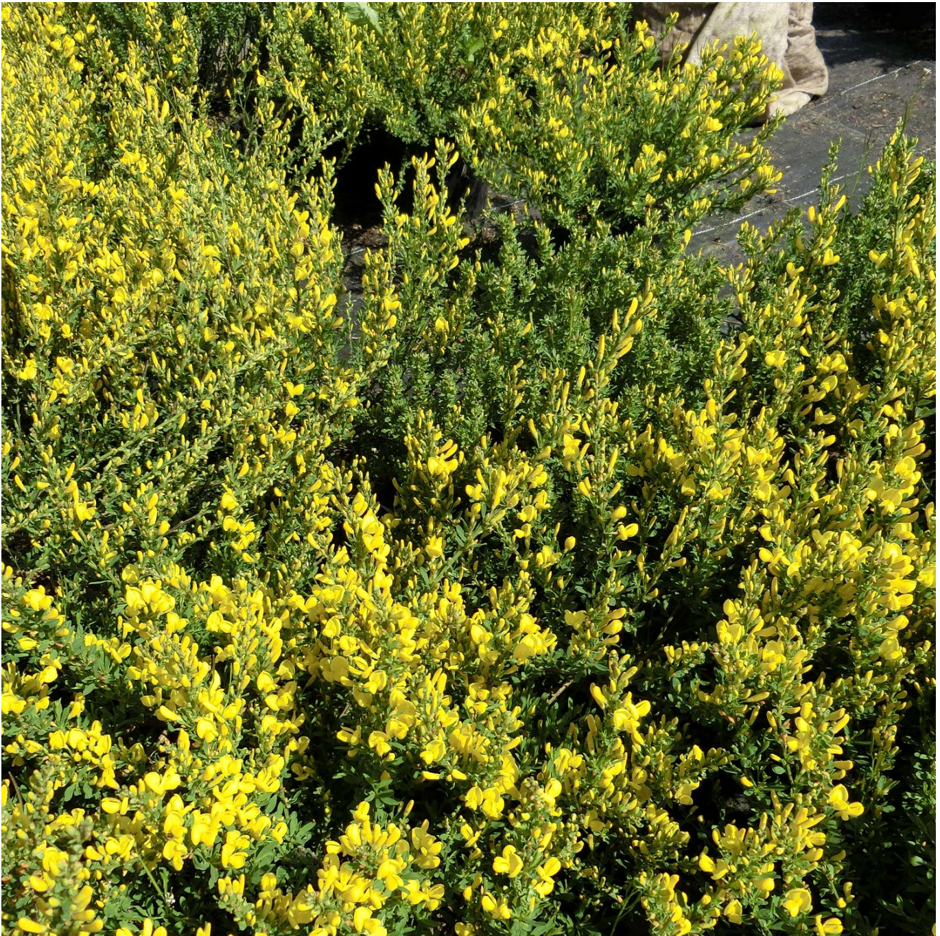
Edelginster 'Allgold' Liefergröße: 40-60 cm - Cytisus praecox 'Allgold'

Der Edelginster 'Allgold' - Ein goldener Frühlingsbote Der Edelginster 'Allgold' (botanisch: Cytisus praecox 'Allgold') ist eine spektakuläre Bereicherung für jeden Garten, die mit ihren intensiv gelben Blüten von Mai bis Juni nicht nur eine optische Augenweide bietet, sondern auch einen angenehmen, zarten Duft verströmt. Dieser Kleinstrauch, eine Kreuzung aus zwei Wildarten, ist in Mitteleuropa heimisch und gilt als der bekannteste und beliebteste Vertreter seiner Art. Blütenpracht und Dufterlebnis Die reiche gelbe Blüte und der teils starke, angenehme Duft des 'Allgold' sind charakteristisch für diesen Ginster. Er findet optimalen Einsatz in Heide-, Bauern- und Steingärten und setzt neben Pflanzpartnern wie Schleifenblume, Blaukissen oder Sommer- und Winterheide wunderschöne Akzente. Pflege und Standort Der Edelginster 'Allgold' bevorzugt einen warmen, geschützten und sonnigen Standort, um seine volle Blütenpracht zu entfalten. Er reagiert empfindlich auf Kalk und bevorzugt daher einen leicht sauren Boden. Trotz seiner Vorliebe für sonnige Plätze ist er winterhart und verträgt Rückschnitte gut, was ihn zu einer pflegeleichten Wahl für jeden Garten macht. Standort: Vollsonnig für beste Blütenpracht. Boden: Leicht sauer, gut durchlässig. Pflege: Verträgt Rückschnitte, winterhart. Gestaltungstipps Als Hangpflanze, im Vorgarten oder in dekorativen Pflanzgefäßen auf Balkon und Terrasse – der Edelginster 'Allgold' macht überall eine gute Figur. Er ist