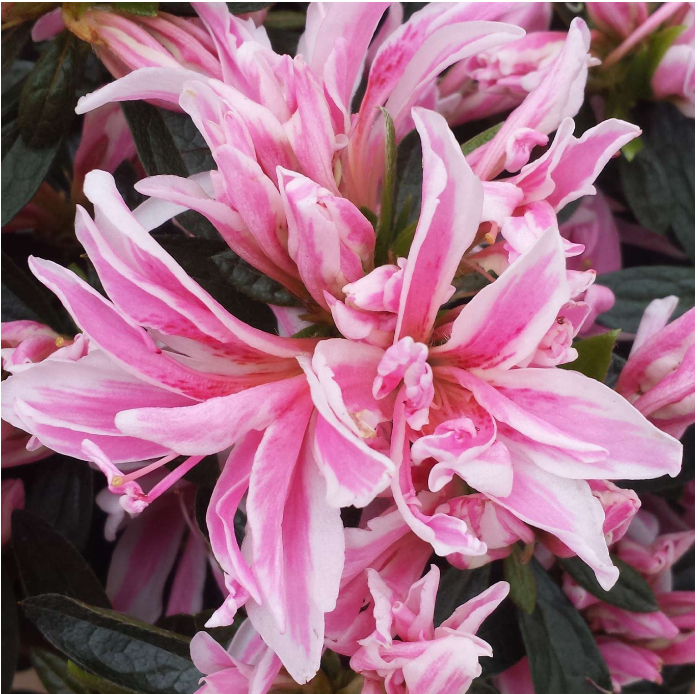
Japanische Azalee 'Pink Spider®' C3 30 - 40 cm Liefergröße: 30 - 40 cm - Rhododendron obtusum (Azalea japonica)