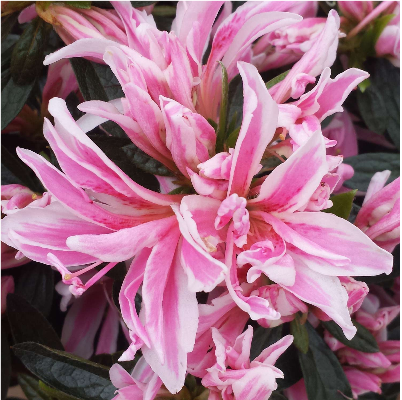
Japanische Azalee 'Pink Spider®' C3 20 - 30 cm Liefergröße: 20 - 30 cm - Rhododendron obtusum (Azalea japonica)

Selbst Spinnenfeinde werden 'Pink Spider®' lieben! Treffender könnte der Sortenname 'Pink Spider®' nicht sein! Denn diese Japanische Azalee hat ganz besondere Blüten, die sich deutlich vom herkömmlichen Flor bei Azaleen unterscheiden. Die Blütenblätter sind länglich, spitz geformt und locker fransig angeordnet. Zuweilen sind die oberen Enden leicht gekräuselt. Beeindruckend ist auch die Farbe.