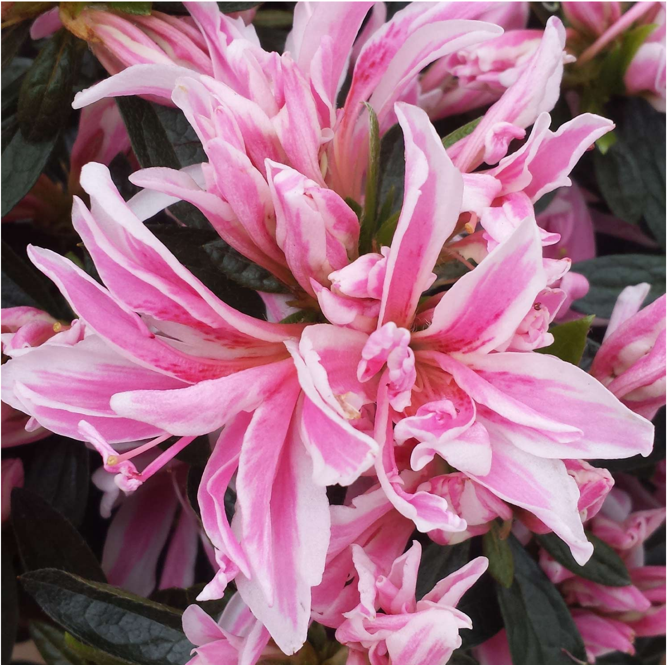
Japanische Azalee 'Pink Spider®' C3 30 - 40 cm Liefergröße: 30 - 40 cm - Rhododendron obtusum (Azalea japonica)

Selbst Spinnenfeinde werden 'Pink Spider®' lieben! Treffender könnte der Sortenname 'Pink Spider®' nicht sein! Denn diese Japanische Azalee hat ganz besondere Blüten, die sich deutlich vom herkömmlichen Flor bei Azaleen unterscheiden. Die Blütenblätter sind länglich, spitz geformt und locker fransig angeordnet. Zuweilen sind die oberen Enden leicht gekräuselt. Beeindruckend ist auch die Farbe. Die Mitte ist leuchtend rosarot und teils mit deutlich dunkelrosa Sprenkeln versehen. Rundum befindet sich ein hübscher, schneeweißer Rahmen. Die Blüten sind recht groß und zeigen sich von Mai bis Juni. Das Laub ist glänzend, oval und im Austrieb frischgrün. Danach verfärbt es sich zu einem satten Dunkelgrün, das fast schon in ein Schwarz-Rot übergeht. Die zwei gegensätzlichen Farben von Blüte und Blatt ergänzen sich ausgezeichnet! Rhododendron obtusum (Azalea japonica) 'Pink Spider®' kann