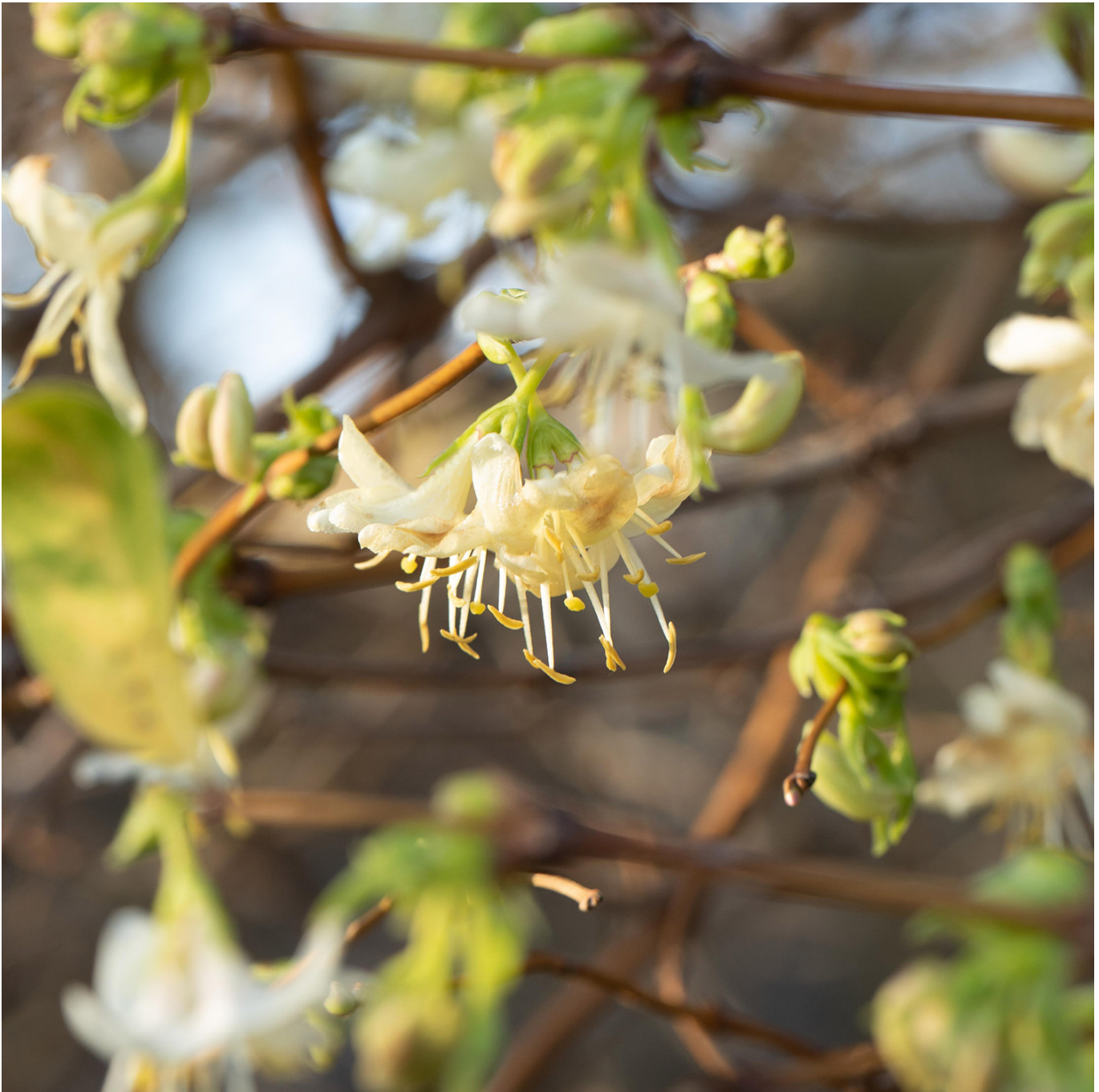
Duftende Winter-Heckenkirsche 3 Liter, 40 - 60 cm Liefergröße: 40 - 60 cm - Lonicera purpusii

Ein Dufterlebnis für die kalte JahreszeitDie Duftende Winter-Heckenkirsche ( Lonicera purpusii ), auch bekannt als Frühlingsgeißblatt, ist ein Highlight in jedem Wintergarten. Ihre trichterförmigen, reinweißen Blüten erscheinen in Büscheln und verströmen einen intensiven, honigähnlichen Duft. Dieses Dufterlebnis macht die Heckenkirsche zu einer idealen Pflanze für Standorte, an denen man täglich ihre Schönheit und ihren Duft genießen kann, wie am Rande eines Weges oder unmittelbar neben der Terrasse. Die Hauptblütezeit ist im Februar und März, doch je nach Witterung beginnt sie mitunter schon im Dezember und erstreckt sich bis in den April. Dieser frühe Blüher ist nicht nur ein visueller Hingucker, sondern auch ein wichtiger Nahrungsspender für heimische Singvögel mit ihren roten, herzförmigen Früchten im Mai. Die Duftende Winter-Heckenkirsche gedeiht in sonnigen bis halbschattigen Lagen mit normalem Gartenboden und ist ideal für die Gestaltung von Rabatten, Blühhecken, Knicks und Böschungen, besonders in Kombination mit Frühblühern wie Schneeglöckchen und Winterlingen. Anspruchslos und bezaubernd: Duftende Winter-HeckenkirscheDie Duftende Winter-Heckenkirsche ist bekannt für ihre Anspruchslosigkeit und ihre bezaubernden, duftenden Blüten. Sie bevorzugt sonnige bis halbschattige Standorte und normalen Gartenboden. Standort: Ideal für sonnige bis halbschattige Plätze. Boden: Gedeiht auf normalem, gut durchlässigem Gartenboden. Wachstum: Zeigt