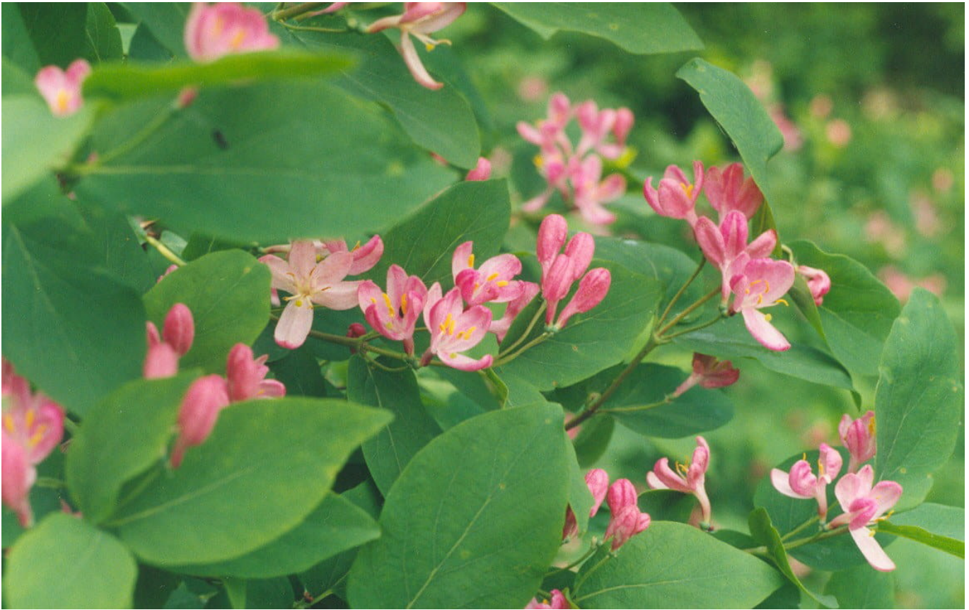
Tatarische Heckenkirsche • Lonicera tatarica

Die Tatarische Heckenkirsche ( Lonicera tatarica ) ist eine winterharte, immergrüne Pflanze, die leicht zu züchten ist und eine ideale Wahl für den Anbau als Hecken oder Grenzbepflanzung darstellt. Sie kann eine Höhe von bis zu 4 Metern erreichen und hat ein dichtes Laubwerk aus ovalen, dunkelgrünen Blättern, die das ganze Jahr über grünen. Im Frühling präsentiert sie zarte rosa bis lila Blüten, die in Büscheln zusammengefasst sind und einen angenehmen Duft verbreiten. Diese Pflanze ist relativ pflegeleicht und verträgt Sonne, Schatten und feuchte Böden, solange genügend Wasser vorhanden ist. Zusätzlich zur ästhetischen Wirkung ist die Tatarische Heckenkirsche auch eine wichtige Nahrungsquelle für zahlreiche Schmetterlingsarten und Vögel, die ihre Früchte lieben.