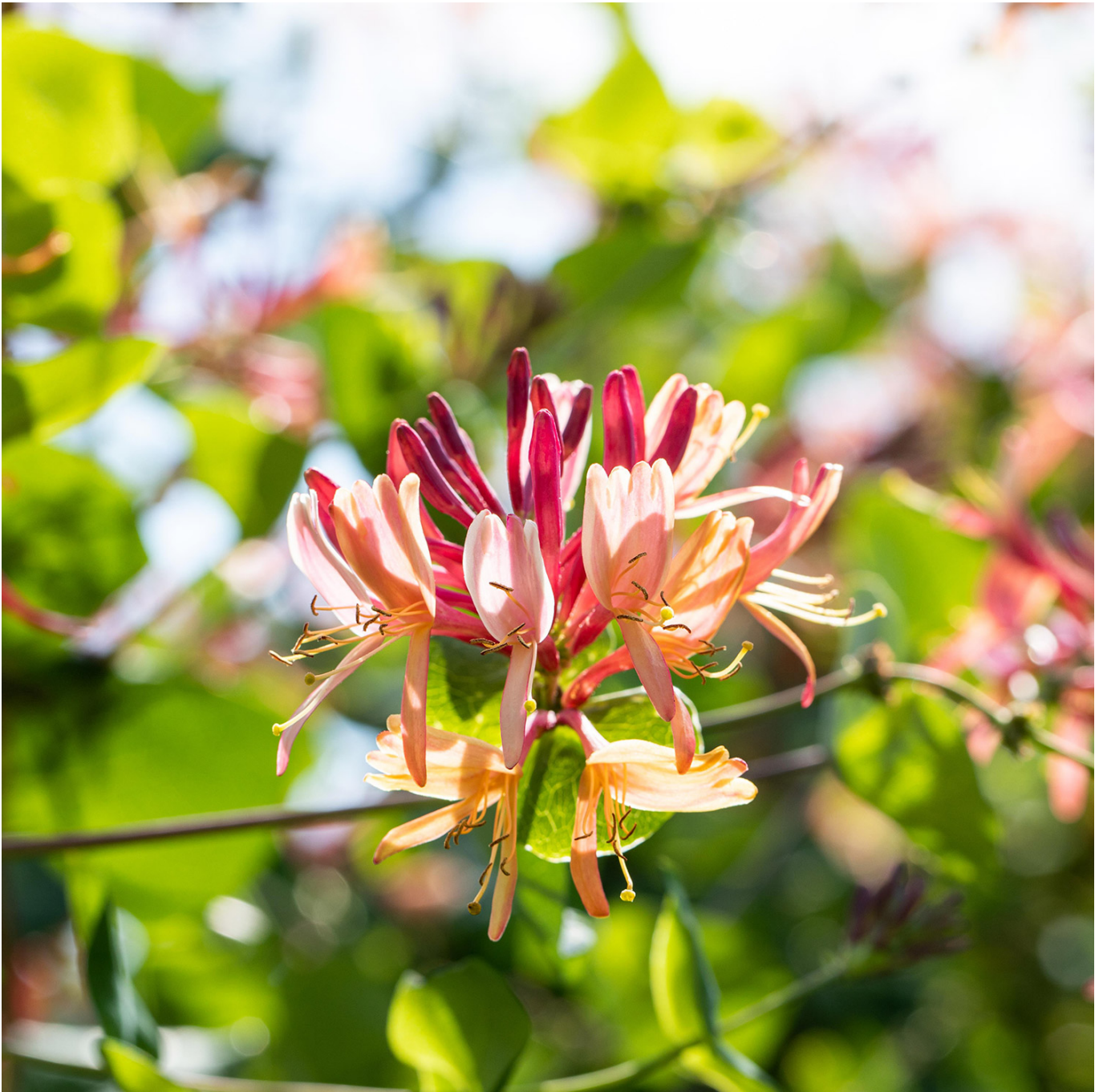
Geißblatt 'Goldflame' Liefergröße: 40 - 60 cm - Lonicera heckrottii 'Goldflame'

Was für eine Schönheit die 'Goldflame' doch ist. Und Sie macht ihrem Namen durch ihre mehrfarbige Blüte alle Ehre. Das Farbspiel reicht von gelb, über orange hin zu purpur-rot. Außerdem sind die Blüten besonders groß und verströmen teilweise einen lieblichen Duft. Wie alle Schlingpflanze braucht auch dieses Geißblatt etwa, woran es emporschlingen kann, eine sogenannte Rankhilfe. An den Boden stellt die Geißschlinge keine besonderen Ansprüche. Goldflame ist schnittverträglich, benötigt diesen aber kaum. Eine wunderschöne Kletterpflanze die, obwohl das Geißblatt bei uns ja heimisch ist, einen exotischen Touch hat und Abwechslung in unseren Garten bringt.