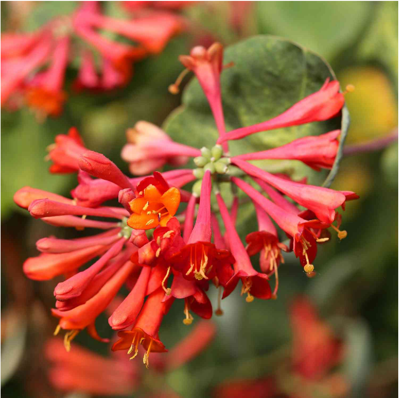
Fuchsienblütige Geißschlinge 'Dropmore Scarlet' Liefergröße: 40 - 60 cm - Lonicera brownii fuchsioides

Das Fuchsien-Geißblatt ist eine sehr wertvolle Pflanze. Ihre wunderschönen, an Trompeten erinnernden Blüten erscheinen von Juni bis August und stehen in kleinen Grüppchen zusammen. Sie haben eine orangerote Farbe. Das Geißblatt gehört zu den beliebtesten Kletterpflanzen, weil es unkompliziert, robust und pflegeleicht ist. Dieser Schlinger benötigt eine Kletterhilfe wie zum Beispiel ein Rankgerüst.