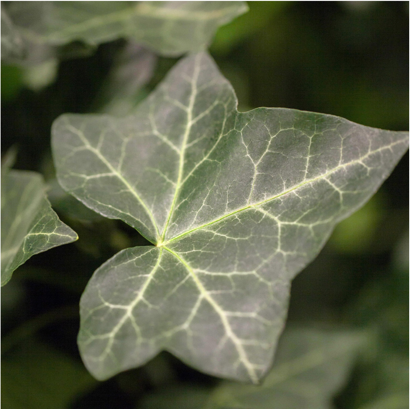
Großblättriger Irischer Efeu, 0,5 Liter, 15 - 20 cm Liefergröße: 15 - 20 cm - Hedera helix hibernica

Der Großblättrige Irische Efeu: Ein vielseitiger Gartenbewohner Der Großblättrige Irische Efeu, entdeckt um 1838 in Irland, hat sich zu einem der beliebtesten und vielseitigsten Efeusorten entwickelt. Mit seinem starken Wuchs und den großen, dekorativen Blättern verleiht er dunklen Ecken, Hauswänden und Gärten ein malerisches und verwünschtes Aussehen. Wachstum und Erscheinungsbild Dieser Efeu zeichnet sich durch seine starken und dicht bewachsenen Triebe aus, die mit großen, herzförmigen Blättern besetzt sind. Die graublauen, schuppenförmigen Blätter und die eiförmigen, rotbraunen Zapfen machen ihn zu einem auffälligen Solitär in jedem Garten. Der Efeu kann eine Höhe von 20 m erreichen und eignet sich sowohl als Bodendecker als auch als Kletterpflanze. Pflegeleichtigkeit und Robustheit Seine Frosthärte und die Anspruchslosigkeit in Bezug auf Pflege machen den Großblättrigen Irischen Efeu zu einer idealen Wahl für Gartenbesitzer, die eine pflegeleichte und zugleich attraktive Pflanze suchen. Er gedeiht sowohl in sonnigen als auch in halbschattigen Lagen und bevorzugt einen frischen bis feuchten, nährstoffreichen Boden. Standort: Sonnig bis halbschattig Boden: Frisch bis feucht, nährstoffreich Winterhärte: Bis -17,7 Grad Celsius Verwendung: Solitär, Fassadenbegrünung, Bodendecker Ein vielseitiger Gartenbegleiter Ob als eindrucksvolle Begrünung von Hausfassaden oder als dichter Bodendecker, der Großblättrige Irische Efeu überzeugt in jeder Hinsicht. Seine Wuchskraft und