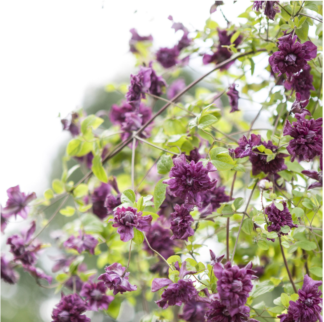
Clematis 'Purpurea Plena Elegans' Liefergröße: 40 - 60 cm - Clematis viticella 'Purpurea Plena Elegans'

Clematis 'Purpurea Plena Elegans': Ein purpurrotes Blütenwunder Die Clematis 'Purpurea Plena Elegans' verzaubert mit ihrer opulenten, gefüllten Blütenpracht in einem intensiven Purpurrot. Diese Sorte ist bekannt für ihre Robustheit gegenüber der Clematiswelke und ihre Flexibilität in der Garten- und Kübelgestaltung. Robuste Schönheit mit langer Blütezeit Von Juli bis Oktober bietet die 'Purpurea Plena Elegans' einen außergewöhnlichen Anblick mit ihren zahlreichen, tief purpurroten Blüten. Diese Sorte ist besonders widerstandsfähig gegen Clematiswelke, was sie zu einem pflegeleichten Highlight in jedem Garten macht. Ideal für vielseitige Gartengestaltungen Kübelhaltung: Dank ihrer Anpassungsfähigkeit eignet sich die 'Purpurea Plena Elegans' hervorragend für die Kultivierung in Kübeln und bietet somit auch auf Balkonen und Terrassen ein prächtiges Blütenschauspiel. Kletterhilfe: Als Kletterpflanze benötigt sie eine Struktur zum Emporwachsen und kann somit Fassaden, Pergolen oder andere Gestaltungselemente im Garten verschönern. Pflegeleicht und anpassungsfähig Mit minimalen Pflegeanforderungen und ihrer Toleranz gegenüber verschiedenen Bodentypen ist die 'Purpurea Plena Elegans' eine Bereicherung für jeden Garten. Ihr purpurrotes Blütenmeer bietet eine beeindruckende Kulisse und zieht Blicke magisch an. Verleihen Sie Ihrem Garten mit der Clematis 'Purpurea Plena Elegans' einen Hauch von Eleganz und Farbenpracht. Ein Muss für jeden Clematis-Liebhaber und die