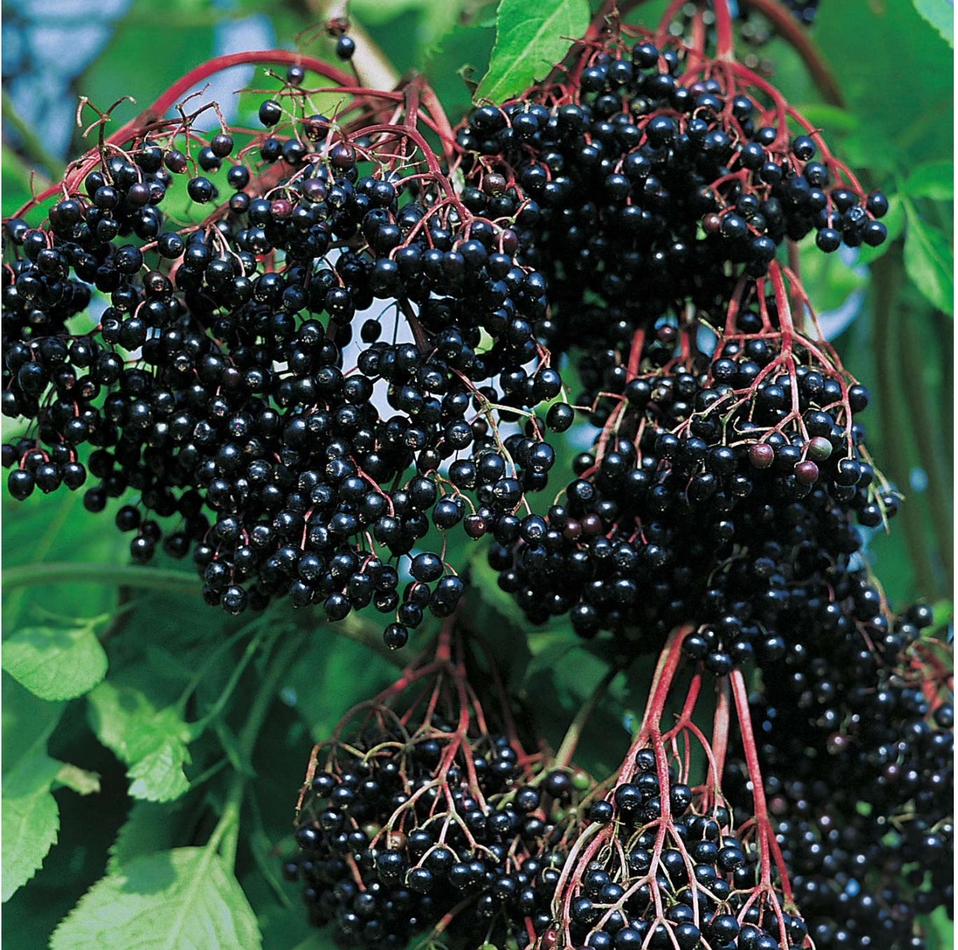
Fliederbeere 'Holderbusch' - Kleine Gartenforscher Liefergröße: ca. 60 - 80 cm - Sambucus nigra 'Holderbusch'

"Es war einmal" ... im Märchenland mit Fliederbeere 'Holderbusch'! Wer Märchen, Sagen und geheimnisvolle Geschichten liebt, der ist bei der Fliederbeere, auch Schwarzer Holunder genannt, genau richtig. Nicht nur Frau Holle hat ihren Sitz im Fliederbaum und lässt goldene, lieblich duftende Blütensternchen auf Goldmarie und pechschwarze Beeren auf Pechmarie herab. Das gewöhnliche und unspektakuläre großstrauchartige Gehölz ist auch Sitz vieler Göttinnen und ehemals wichtiger Schutzbaum für Haus und Hof. Einen Fliederbusch sollte man also auf jeden Fall immer im Garten