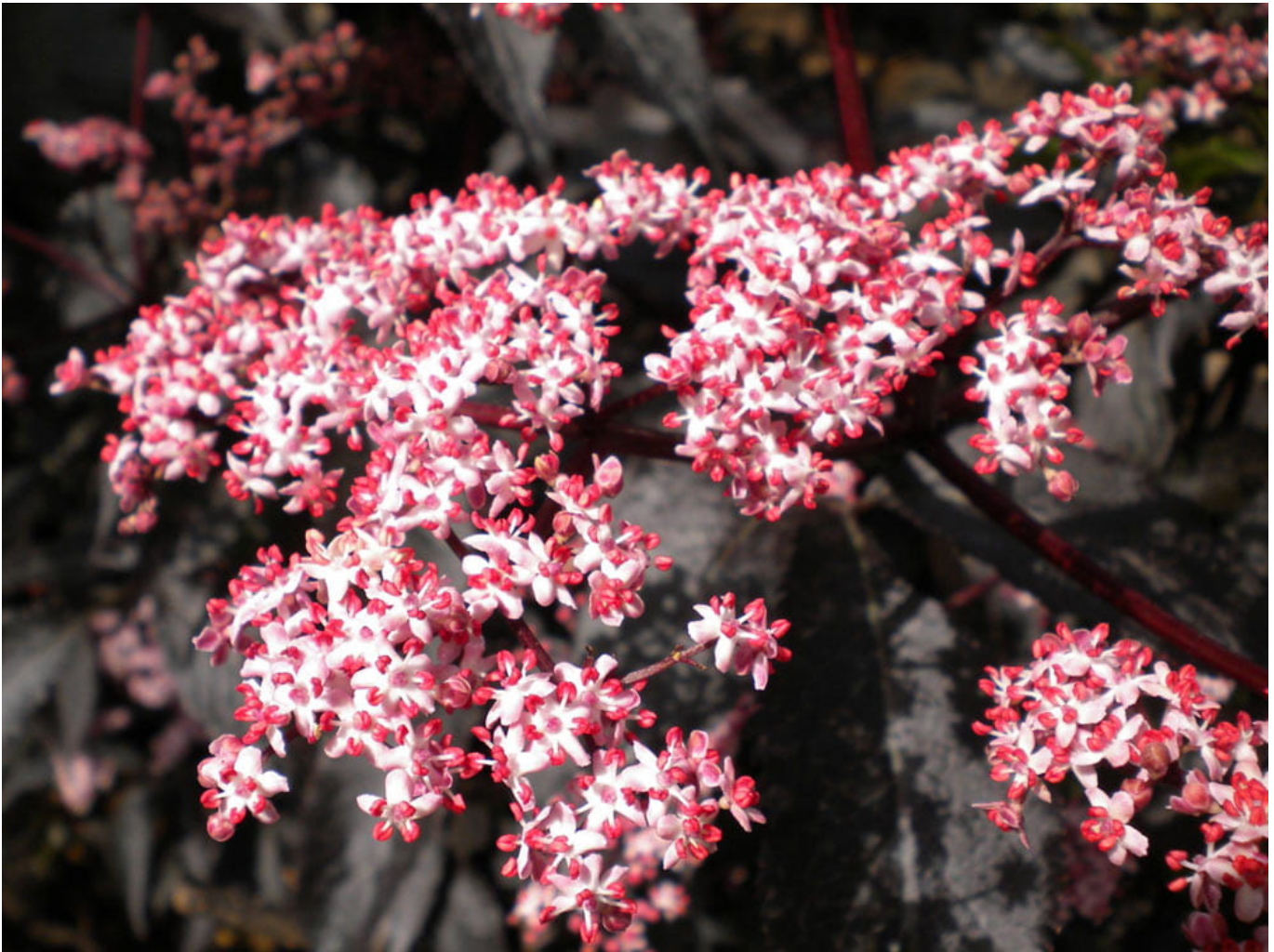
Fliederbeere 'Black Beauty' • Sambucus nigra 'Black Beauty'