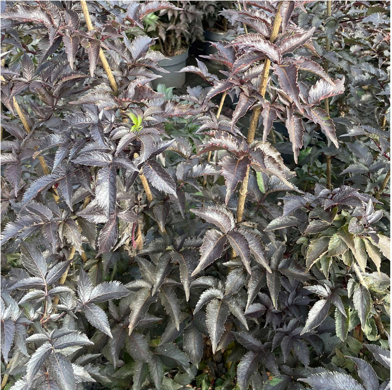
Dunkellaubige Säulen-Holunder 'Black Tower' C5 40 - 60 cm Liefergröße: 40 - 60 cm - Sambucus nigra 'Eiffel 1' Black Tower

Der Dunkellaubige Säulen-Holunder 'Black Tower' hat eine außergewöhnliche dunkle Laubfarbe zu bieten. Zudem hat er große, weiße Blütendolden, aus denen später die köstlichen und sehr gesunden Fliederbeeren heranreifen. Die Pflanze hat einen schmalen und kegelförmigen Wuchs und ist daher hervorragend für kleine Gärten und engere Passagen geeignet.