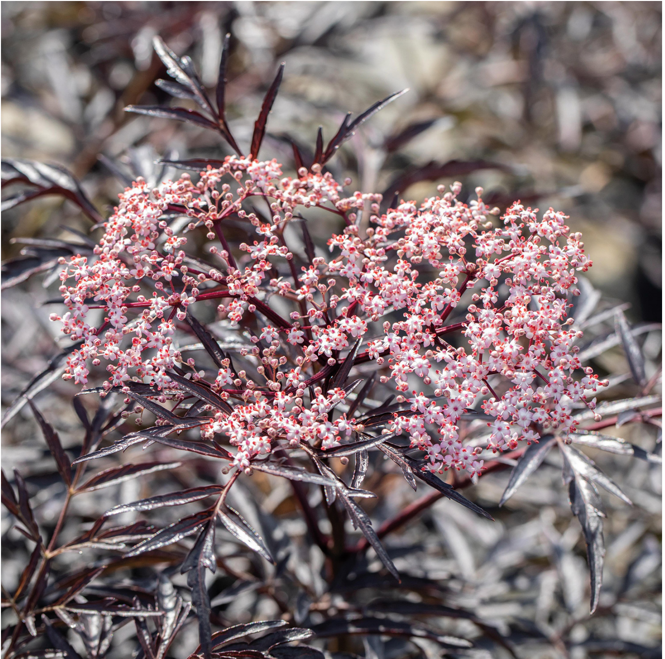
Fliederbeere 'Black Lace®' 5 Liter, 60 - 100 cm Liefergröße: 60 - 100 cm - Sambucus nigra 'Black Lace®'

Die Fliederbeere "Black Lace®", die auch unter der Bezeichnung Holunderbeere sehr bekannt ist, ist ein Zier- sowie ein Nutzstrauch. "Black Lace" heißt ins Deutsche übersetzt "schwarze Spitze", was durch die feinen schwarzen Blätter zu erklären ist. Von Mai bis Juni blüht dieser hübsche Fliederbeerenstrauch mit leuchtend rosa Blütenständen, die einen wunderbaren Kontrast zu dem dunkelrotem, geschnitztem Laub