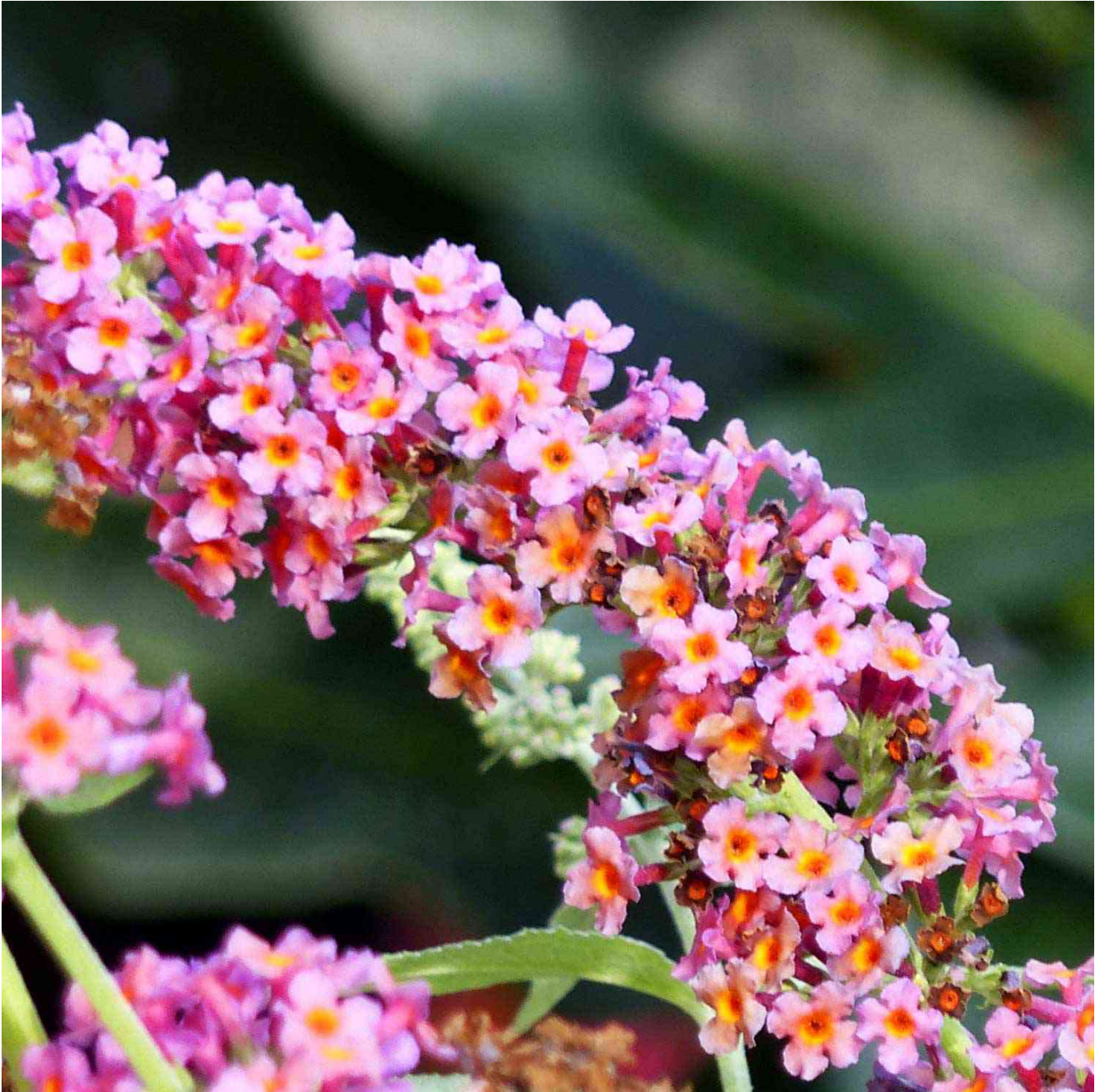
Schmetterlingsflieder 'Flower Power' Liefergröße: 40 - 60 cm - Buddleja davidii 'Flower Power'

Schmetterlingsflieder 'Flower Power': Ein Duftwunder für Ihren Garten Schmetterlingsflieder 'Flower Power': Ein Magnet für Schmetterlinge Der Schmetterlingsflieder 'Flower Power' ist eine Bereicherung für jeden Garten, der mit seinem betörenden Duft nicht nur Schmetterlinge, sondern auch Gartenliebhaber anzieht. Seine farbenprächtigen Blüten machen ihn zudem zu einer idealen Wahl als Schnittblume für die Vase. Vorteile des Schmetterlingsfliers 'Flower Power' Wunderschöner Duft: Lockt Schmetterlinge und andere nützliche Insekten an. Ideal als Schnittblume: Bringt den Sommer auch in Ihr Zuhause. Winterschutz empfohlen: Bei starkem Frost schützt eine Abdeckung die Pflanze und sichert das Ausschlagvermögen im Frühjahr. Anspruchslos und pflegeleicht: 'Flower Power' benötigt