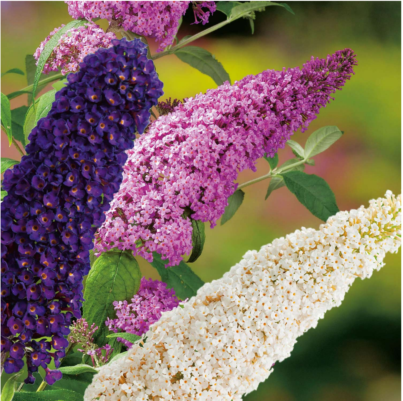
Drei-Farben-Sommerlieder 'Tricolor' Liefergröße: 30 - 40 cm - Buddleja davidii 'Tri-Color'

Sommerlieder 'Tricolor': Eine bunte Oase im GartenDer Sommerlieder 'Tricolor' fasziniert mit einem einzigartigen Farbmix aus weißen, violetten und pinken Blüten, die nicht nur das Auge erfreuen, sondern auch Schmetterlinge und Bienen anlocken.Dreifarbige BlütenprachtAls Zusammenspiel dreier Farben bietet 'Tricolor' von Juni bis September ein spektakuläres Blütenschauspiel. Die lanzettlichen, silbrig schimmernden Blätter bilden den perfekten Kontrast zu dieser bunten Vielfalt.GestaltungsmöglichkeitenMit seinem schnellen Wuchs und der maximalen Größe von 2,5 Metern eignet sich der 'Tricolor' sowohl für Einzel- als auch für Gruppenpflanzungen, als Gartenpflanze, in Kübeln, Beeten oder Rabatten.Blütezeit: Juni bis SeptemberFarben: Weiß, Violett, PinkWuchs: Schnell, bis zu 2,5 m hoch und breitStandort: Sonnig, durchlässiger BodenPflege und Standort'Tricolor' ist pflegeleicht und winterhart, gedeiht am besten an einem sonnigen Standort mit durchlässigem Boden. Ein starker Rückschnitt im März fördert das kräftige Ausreifen und eine reiche Blütenpracht.FazitDer Sommerlieder 'Tricolor' ist ein Muss für jeden Garten, der mit seiner dreifarbigem Blütenpracht und dem betörenden Duft nicht nur eine Augenweide bietet, sondern auch ein Paradies für Schmetterlinge und Bienen schafft.