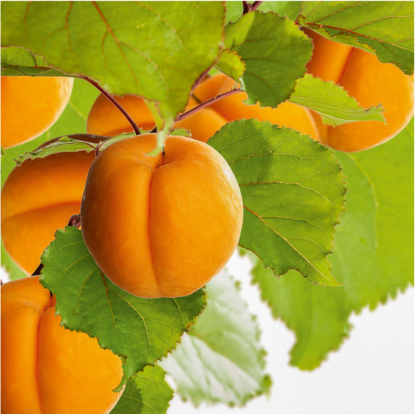
Säulen-Aprikose 'Golden Sun®' Lieferform: Im 5 Liter Topf - Prunus armeniaca 'Golden Sun®'

Säulen-Aprikose 'Golden Sun®': Platzsparende Süße für jeden Garten Säulen-Aprikose 'Golden Sun®': Ein Sonnenschein im Garten Die Säulen-Aprikose 'Golden Sun®' bringt mit ihrer schlanken, säulenförmigen Wuchsart süße, aromatische Früchte auch in den kleinsten Garten oder auf die Terrasse. Ihre leuchtend orangen Aprikosen reifen unter der Sommersonne und bieten einen exzellenten Geschmack, der direkt vom Baum genossen oder in der Küche verarbeitet werden kann. Vorteile der Säulen-Aprikose 'Golden Sun®' Kompakte Größe: Ideal für begrenzte Räume, ohne auf die Freude an eigenen Früchten verzichten zu müssen. Reichhaltige Ernte: Trotz ihrer schlanken Form liefert 'Golden Sun®' eine überraschende Menge an süßen Früchten. Süße, aromatische Früchte: Die Aprikosen zeichnen sich durch ihr intensives Aroma und ihre saftige Konsistenz aus. Pflegeleicht: 'Golden Sun®' ist robust und widerstandsfähig gegen viele Krankheiten, was den Pflegeaufwand reduziert. Pflanz- und Pflegehinweise Die Säulen-Aprikose 'Golden Sun®' bevorzugt einen sonnigen Standort mit gut durchlässigem, nährstoffreichem Boden. Eine regelmäßige Bewässerung fördert das Wachstum und die Fruchtbildung, besonders in Trockenperioden. Ein jährlicher Schnitt ist nicht zwingend erforderlich, kann aber helfen, die säulenförmige Wuchsart zu erhalten und die Belüftung zu verbessern. Sonnige Genüsse in Ihrem Garten Mit der Säulen-Aprikose 'Golden Sun®' holen Sie sich ein Stück Sommer in