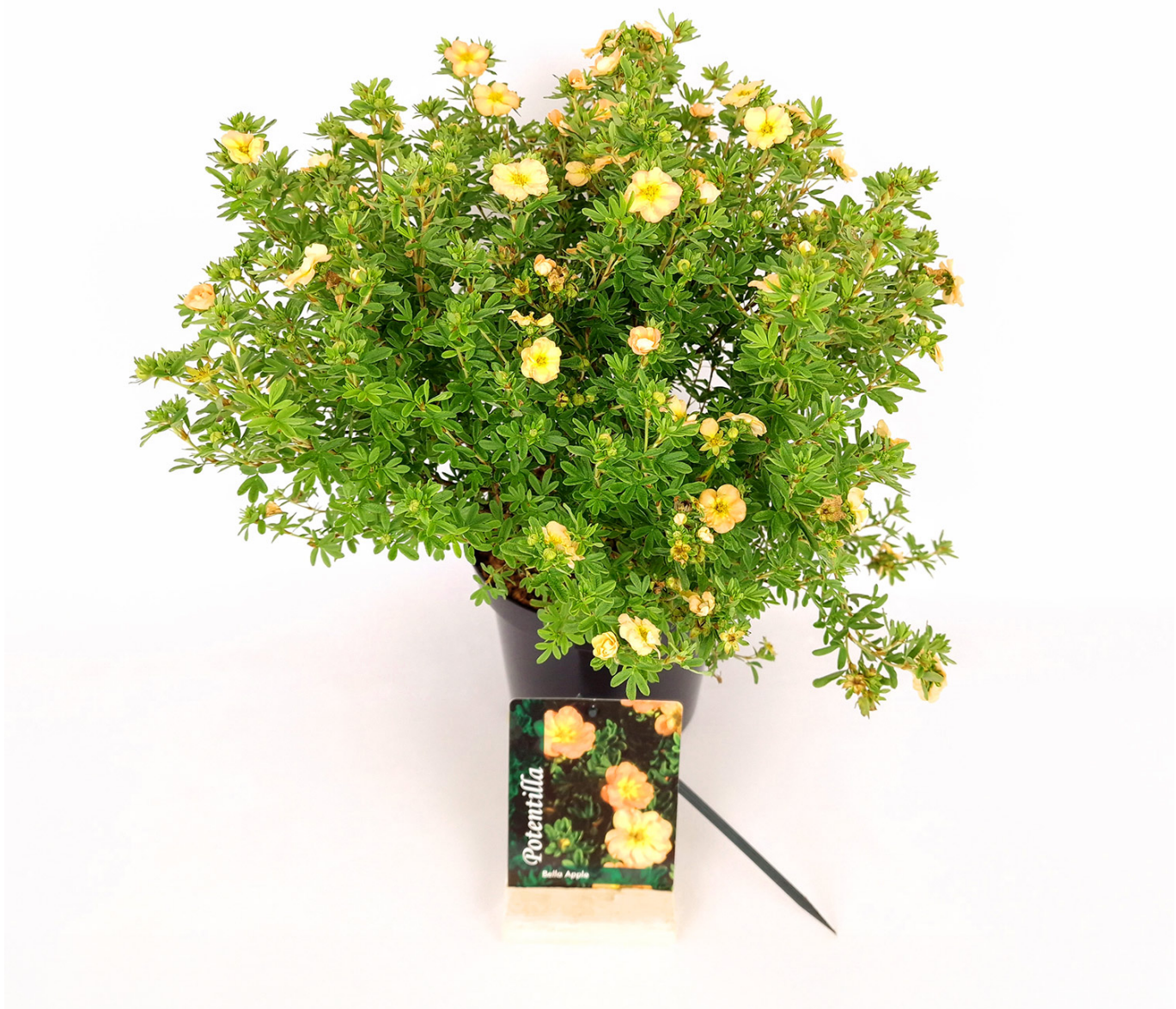
Fingerstrauch 'Bella Apple' Liefergröße: 30 - 40 cm - Potentilla fruticosa 'Bella Apple'

Fingerstrauch 'Bella Lindsey®': Sonnenglanz im Garten Fingerstrauch 'Bella Lindsey®': Ein Hauch von Sonnenschein Der Fingerstrauch 'Bella Lindsey®' verzaubert mit leuchtend gelben Blüten, die eine sonnige und fröhliche Atmosphäre verbreiten. Sein kompakter Wuchs und die reiche Blütenpracht, kombiniert mit attraktiven grünen Blättern, machen ihn zu einer hervorragenden Wahl für jede Gartengestaltung. Ob in kleinen Gärten, in Beeten oder als niedrige Heckenpflanze, 'Bella Lindsey'® bringt Farbe und Lebendigkeit in Ihren Außenbereich. Vorteile des Fingerstrauchs 'Bella Lindsey®' Leuchtend gelbe Blüten: Sorgen für eine lebendige Farbgestaltung und eine positive Stimmung im Garten. Kompakter Wuchs: Ideal für begrenzte Räume und vielseitig in der Gartengestaltung einsetzbar. Reiche Blütenpracht: Bietet über die gesamte Saison hinweg eine attraktive Optik. Pflegeleicht und robust: Passt sich gut an verschiedene Bodenbedingungen an und benötigt wenig Pflege. Pflanz- und Pflegehinweise Der Fingerstrauch 'Bella Lindsey®' bevorzugt einen sonnigen bis halbschattigen Standort mit gut durchlässigem Boden. Regelmäßiges Gießen fördert ein gesundes Wachstum, besonders in trockenen Perioden. Ein leichter Rückschnitt im Frühjahr hilft, die kompakte Form zu bewahren und fördert eine üppige Blütenbildung. Beleben Sie Ihren Garten mit 'Bella Lindsey®' Mit dem Fingerstrauch 'Bella Lindsey®' holen Sie sich das Leuchten der Sonne in Ihren Garten. Die Kombination aus strahlend