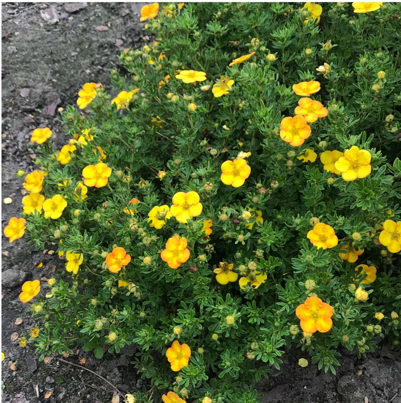
Fingerstrauch 'Bella Lindsey'® Liefergröße: 30 - 40 cm - Potentilla fruticosa 'Bella Lindsey'®

Fingerstrauch 'Bella Lindsey®': Sonnenglanz im Garten Fingerstrauch 'Bella Lindsey®': Ein Hauch von Sonnenschein Der Fingerstrauch 'Bella Lindsey®' verzaubert mit leuchtend gelben Blüten, die eine sonnige und fröhliche Atmosphäre verbreiten. Sein kompakter Wuchs und die reiche Blütenpracht, kombiniert mit attraktiven grünen Blättern, machen ihn zu einer hervorragenden Wahl für jede Gartengestaltung. Ob in kleinen Gärten, in Beeten oder als niedrige Heckenpflanze, 'Bella Lindsey'® bringt Farbe und Lebendigkeit in Ihren Außenbereich. Vorteile des Fingerstrauchs 'Bella Lindsey®' Leuchtend gelbe Blüten: Sorgen für eine lebendige Farbgestaltung und eine positive Stimmung im Garten. Kompakter Wuchs: Ideal für begrenzte Räume und vielseitig in der Gartengestaltung einsetzbar. Reiche Blütenpracht: Bietet über die gesamte Saison hinweg eine attraktive Optik. Pflegeleicht und robust: Passt sich gut an verschiedene Bodenbedingungen an und benötigt wenig Pflege. Pflanz- und