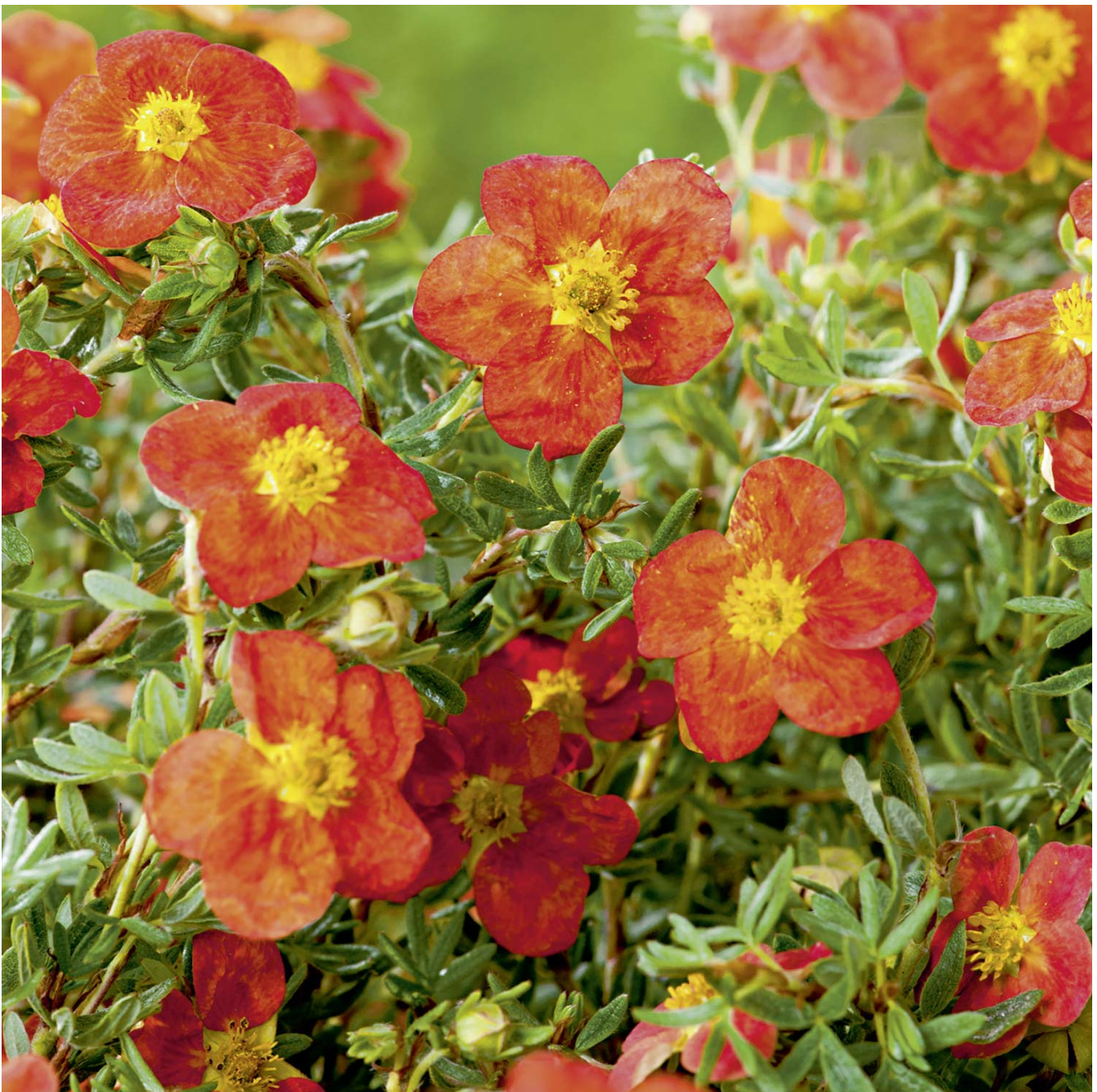
Fingerstrauch 'Flammenmeer', 3 Liter, 20 - 30 cm Liefergröße: 20 - 30 cm - Potentilla fruticosa 'Flammenmeer'